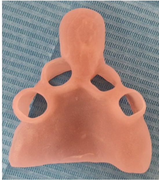
Slika 2. Individualna žlica za otisak u implantoprotetici

Individualna je žlica napravljena po anatomskom modelu pacijenta iz svjetlosno polimerizirajućega ili autoakrilata (Slika 2). Individualne žlice u potpunosti obuhvaćaju strukture koje se otiskuju i omogućavaju jednoličan sloj otisnog materijala. Time se smanjuje deformacija materijala pri vađenju materijala iz usta kao i polimerizacijska kontrakcija (3).