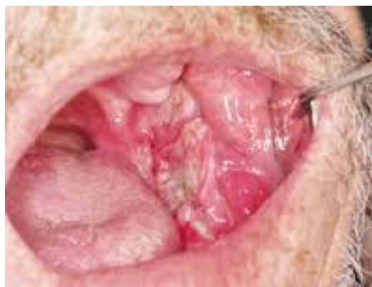
Slika 8. Karcinom usne šupljine. Preuzeto: (20)