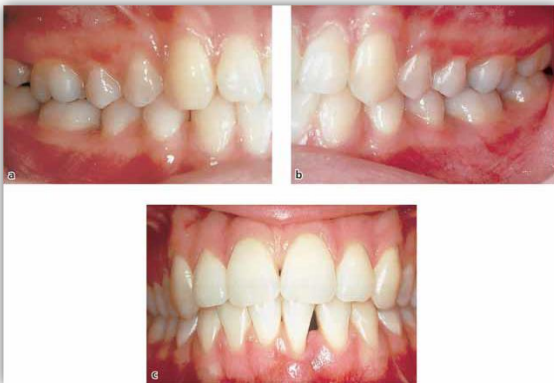
Slika 2. Klinički izgled parodontalnih tkiva kod petnaestogodišnje djevojčice oboljele od juvenilnog parodontitisa. Preuzeto: (14).