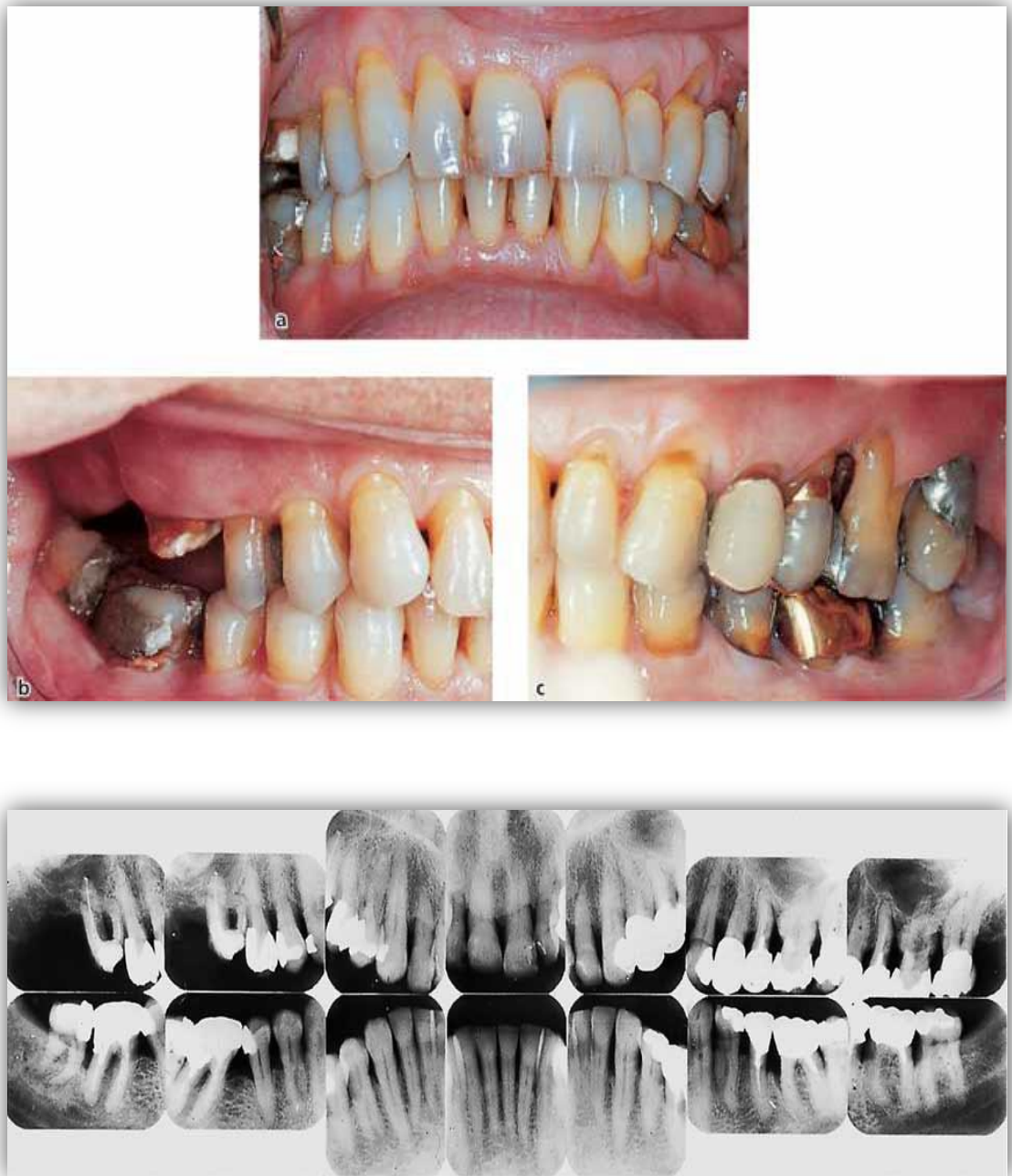
Slika 1. Klinički i radiografski status pedesetpetogodišnjega muškarca s parodontitisom. Preuzeto: (4).