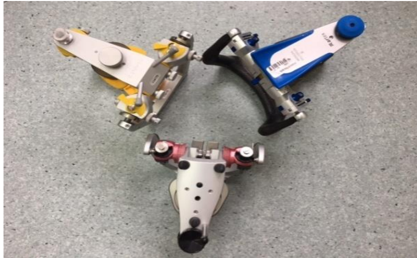
Slika 1. Prilagodljivi artikulatorski sustavi u ovom istraživanju (SAM 3, Protar 7 i Artex)

Baze centričnih/ekscentričnih registrata prilagodile su se prema okluzijskim plohama gornjih zubi na gornjemu radnom modelu. Sam postupak uzimanja pojedinog registrata izvršio se u ustima svakog ispitanika vođenjem donje čeljusti u položaj centrične relacije (tehnika bimanulne manipulacije), položaj protruzijskih zuba (tete-a-tete) te lijevi i desni laterotruzijski zubni položaj (vođenje očajnikom).