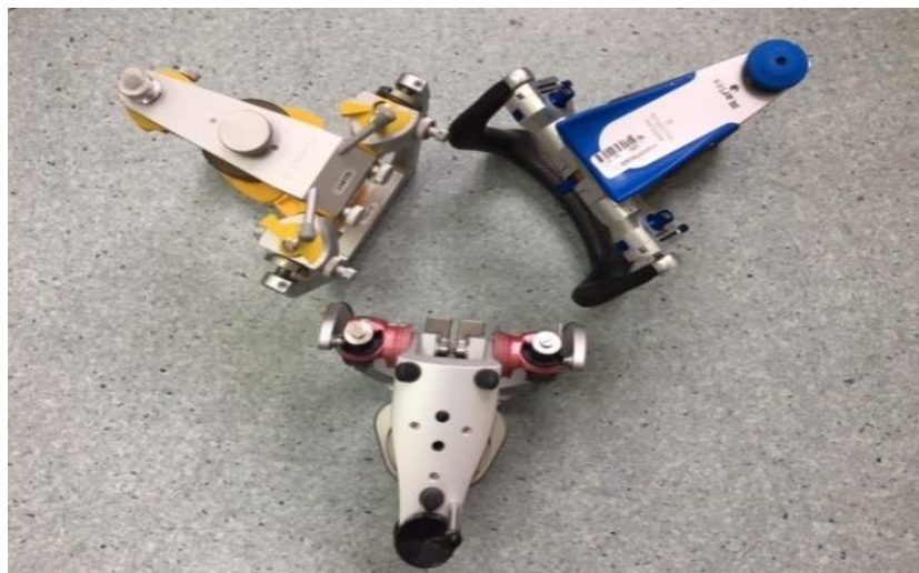
Slika 1. Prilagodljivi artikulatorski sustavi u ovom istraživanju (SAM 3, Protar 7 i Artex)

Baze centričnih/ekscentričnih registrata prilagodile su se prema okluzijskim plohama gornjih zubi na gornjemu radnom modelu. Sam postupak uzimanja pojedinog registrata izvršio se u ustima svakog ispitanika vođenjem donje čeljusti u položaj centrične relacije (tehnika bimanulne manipulacije), položaj protruzijskih zuba (tete-a-tete) te lijevi i desni laterotruzijski zubni položaj (vođenje očnjakom).