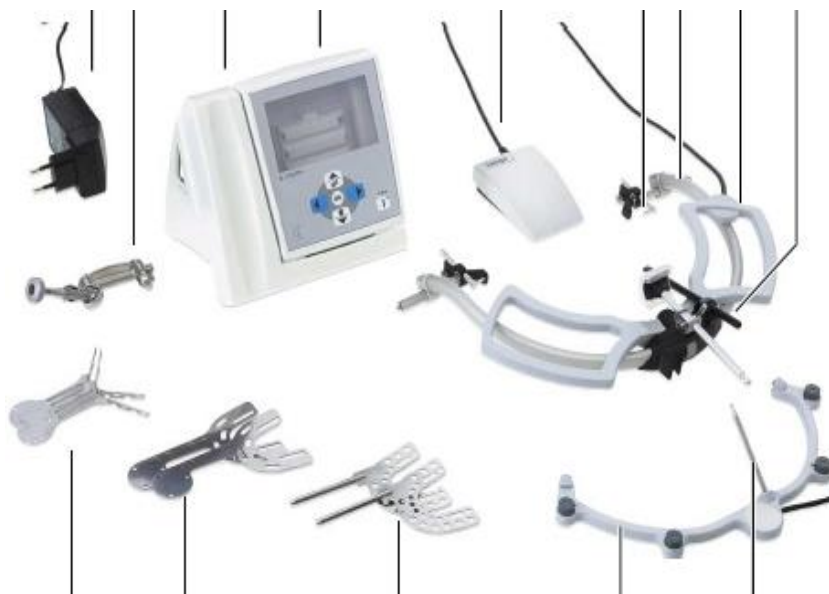
Slika 4. Dijelovi ultrazvučnog sustava Arcus Digma. Preuzeto iz: (20).

stupnjeva slobode, softver uređaja izračunava prostorni položaj kondila, sagitalne incizalne točke ili odabranu odrednicu okluzije. Drugim riječima, uređaj mjeri individualne kretnje donje čeljusti pacijenta koje se potom računalno obrađuju da bi se dobile matematičke vrijednosti (grafičke i brojčane) tih istih kretnji. Područje primjene ovog uređaja je široko. Može se koristiti njime u području instrumentalno-funkcijske dijagnostike i točnije primjene prilagodljivih artikulatorskih sustava kod različitih skupina pacijenata, poput pacijenata s kliničkim znakovima i simptomima temporomandibularnih poremećaja, protetskih pacijenata, ortodontskih pacijenata itd.