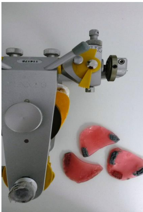
Slika 3. Prikaz ekscentričnih voštanih registrata i zglobnog mehanizma artikulatora SAM 3 (vrijednost Bennettova kuta)

Osim ovog mjerenja kod svakog ispitanika provelo se i mjerenje istih parametara ultrazvučnim aksiografom – aparaturom Arcus Digma (Arcus Digma II, Kavo, Biberach, Njemačka) (Slika 4) (20). Arcus Digma elektronički je uređaj za bilježenje kretnji donje čeljusti koji se zasniva na trodimenzionalnome ultrazvučnom mjerenju. Uređaj se sastoji od gornjega i donjeg luka. Donji luk uređaja pričvršćuje se na donji zubni niz paraokluzijskom žlicom te na sebi nosi emitere ultrazvučnih impulsa. Gornji luk (obrazni luk) ima četiri para senzora ultrazvučnih impulsa. Uređaj mjeri vremenska odstupanja emitiranih i registriranih ultrazvučnih impulsa. Ovisno o vremenskoj razlici ultrazvučnih intervala, na osnovi koncepta šest