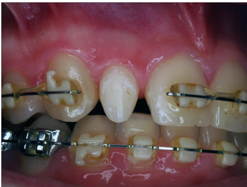
Slika 2. Klinički nalaz zuba 12: demineralizirajuća područja.