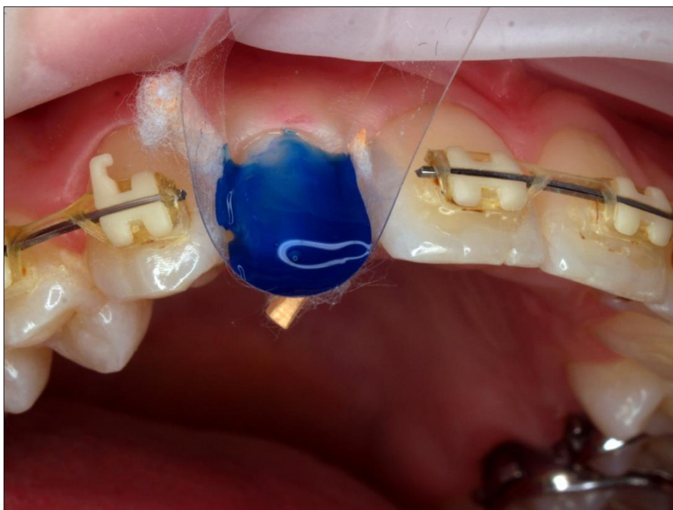
Slika 6. Postupak jetkanja.

Jetkanje pripremljene preparacijske površine provelo se u vremenu od 15 sekundi pomoću kiseline Email Preparator ( Ivoclar Vivadent, Schaan, Liechtenstein ) nakon čega se ista temeljito isprala i osušila (slike 6 i 7).