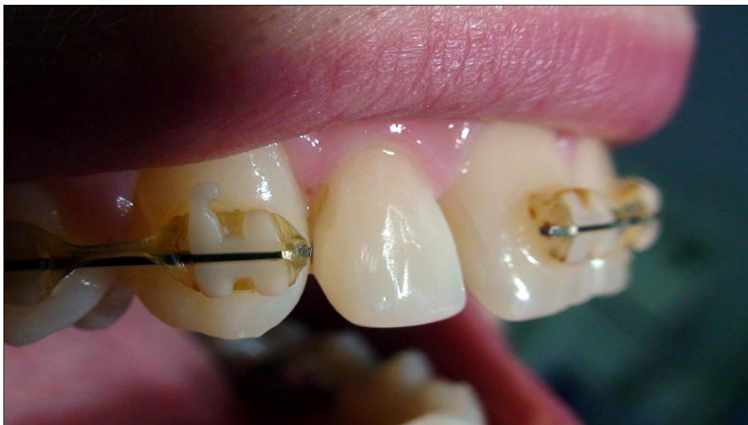
Slika 13. Izgled neposredno nakon završetka rekonstrukcije.