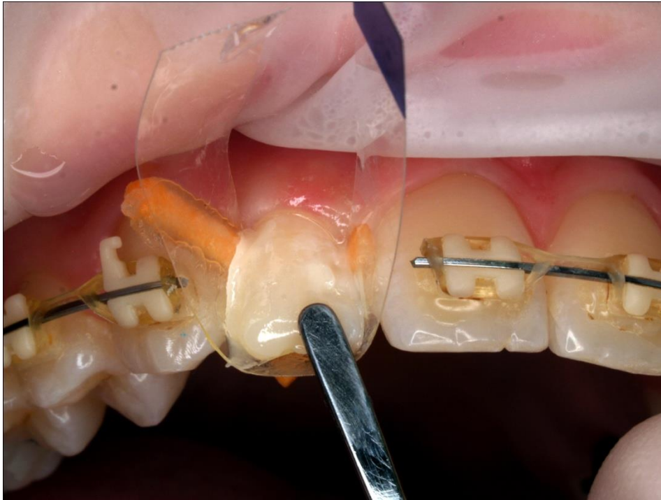
Slika 11. Postavljanje kompozita (istovremeno nanošenje više različitih boja i oblikovanje cijele krune).