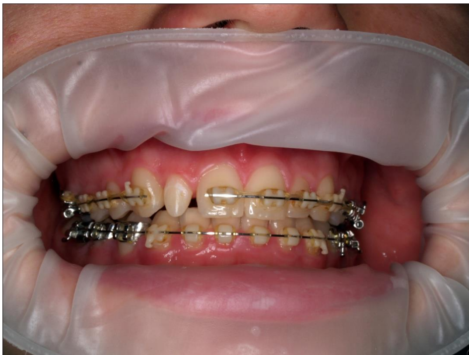
Slika 3. Postavljeni OptraGate sustav za izolaciju radnog polja.