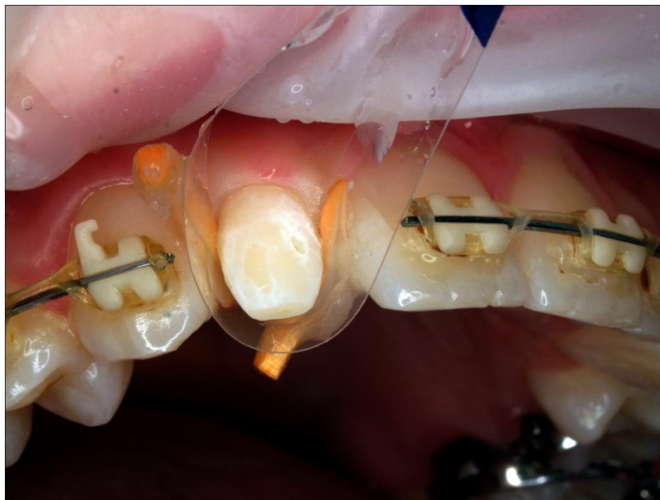
Slika 7. Zub nakon jetkanja, ispiranja i sušenja.

Kiselina se nanijela na cijelo područje pripremljene preparacije, pri čemu se područje približno 2 mm od ruba gingive nije jetkalo, osim u jednom uskom području (2 mm dužine i 1 mm širine) na kojem je bila prisutna pukotina s demineralizacijom. Navedeni je dio prvotno obrađen finim dijamantnim brusnim tijelom, a zatim najetkan, ispran i osušen zajedno s preostalom površinom.