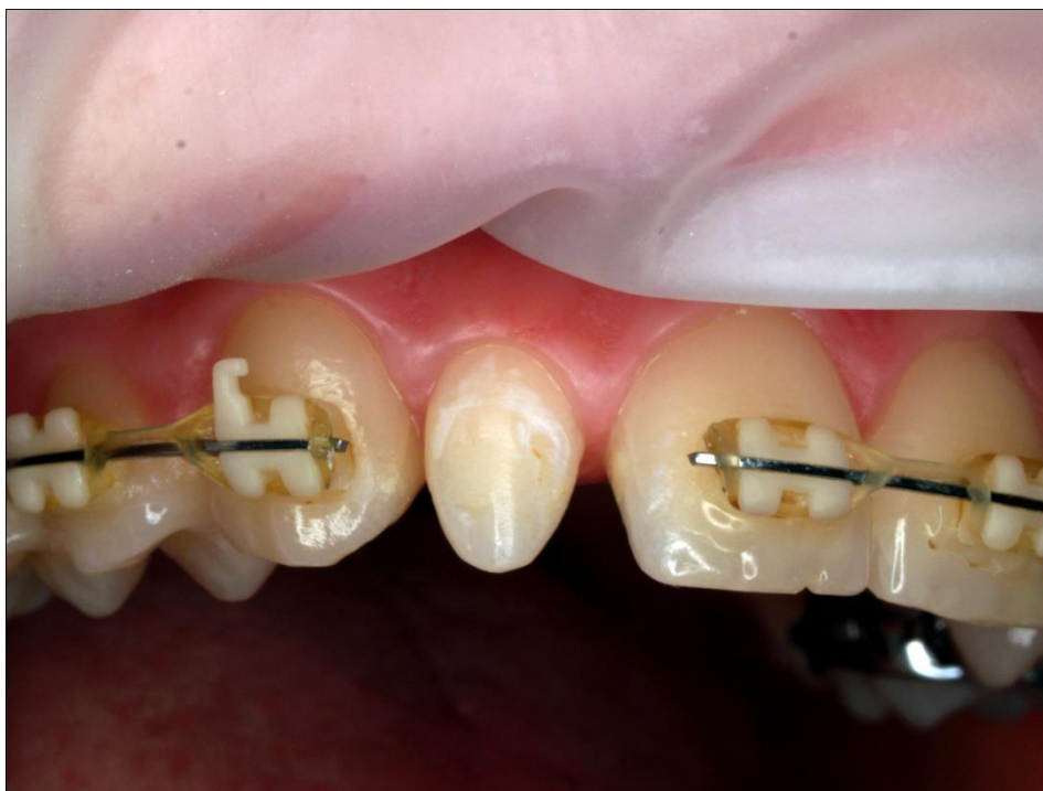
Slika 4. Prikaz izoliranog polja u području zuba 12.