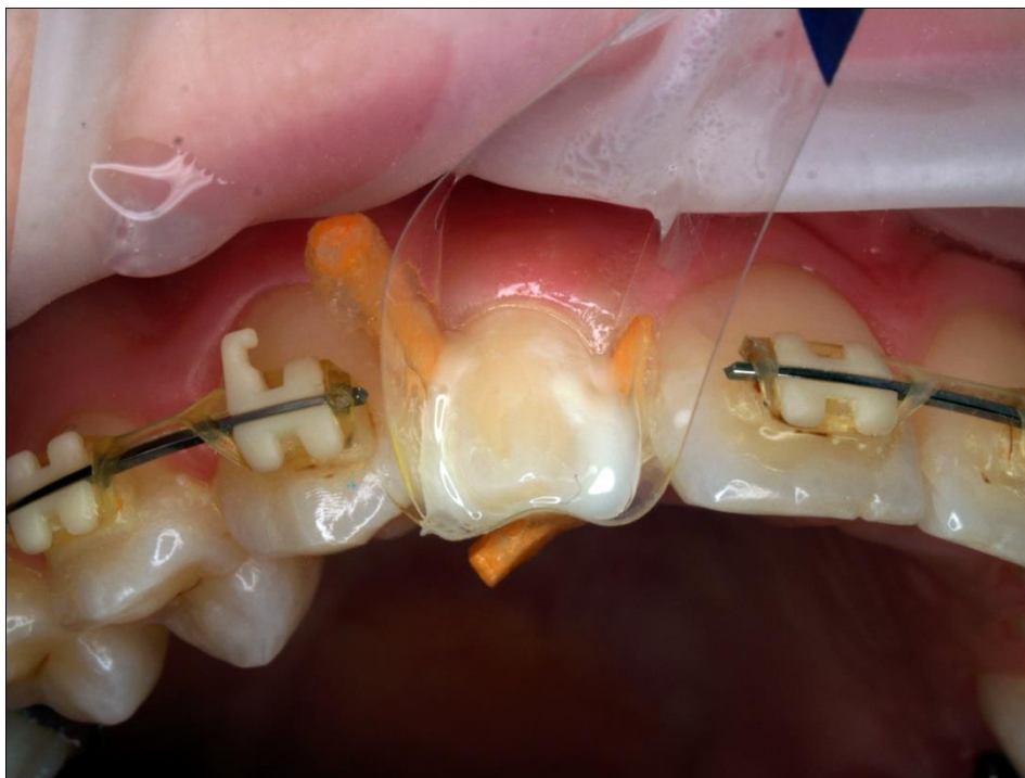
Slika 10. Postavljena osnova od tekućeg kompozita s nepčane strane.

raspoređene na incizalnoj trećini i prijelazu prema srednjoj i cervikalnoj trećini. Nakon završne polimerizacije pristupilo se oblikovanju i završnoj obradi izrađene estetske rekonstrukcije.