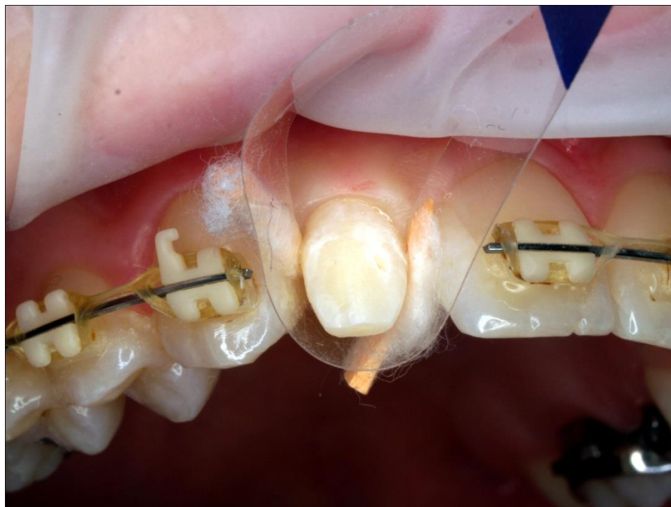
Slika 5. Postavljena prozirna matrica i interdentalni kolčići.

Osim zaštitne, ovdje matrica ima i oblikovnu ulogu jer svojim položajem i oblikom čini osnovu za postavljanje materijala za izradu rekonstrukcije. Važno je da granica prema postraničnim dijelovima vrata zuba bude besprijekorno napravljena i osigurana pomoću interdentalnih kolčića. Matrica se ne smije micati i mora čvrsto prilijegati uz krunu zuba. To se postiže primjenom interdentalnih kolčića koji se dodatno oblože tankim slojem vate. U ovome postupku uporabljeni su interdentalni drveni kolčići Sycamore Interdental Wedges (KerrHawe, Bioggio, Swiss). Vata postavljena oko kolčića navlači prisutnu vlagu u području kontakta matrice i time priječi njeno prodiranje u područje preparacije. Tijesan kontakt uz površinu zuba osigurava savršen prijelaz izrađene nadogradnje prema kruni zuba. Nakon što je postignut željeni oblik i položaj matrice, pristupa se jetkanju isprepariranog i izoliranog područja.