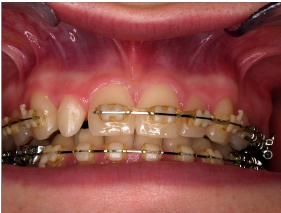
Slika 1. Klinički nalaz zuba 12: mikrodoncija i konični oblik krune.