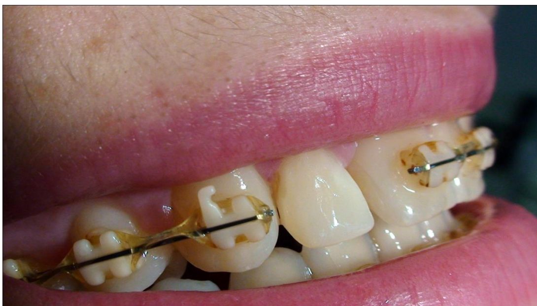
Slika 14. Završni izgled rekonstrukcije.