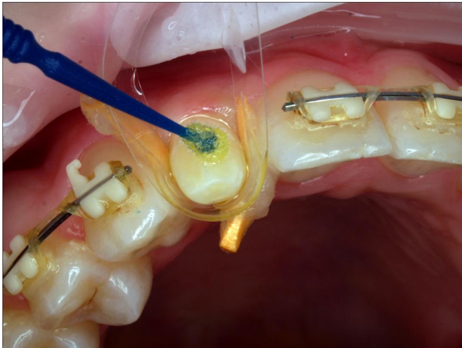
Slika 8. Nanošenje adhezijskog sustava.

U izradi rekonstrukcije uporabljen je samojetkajući adhezijski sustav šeste generacije AdheSE (IvoclarVivadent, Schaan, Liechtenstein) koji pripada grupi tzv. no mix sustava. Pojam no mix kod šeste generacije znači da se sustav (samojetkajući primer i adheziv) nanosi jedan za drugim, odnosno da se ne miješaju međusobno prije nanošenja u kavitet. Sustav je primijenjen prema preporuci proizvođača. Samojetkajući primer nanesen je na područje cijele krune koja je predviđena za vezu s nadogradnjom. Primer je nanesen u vremenu od 30 sekundi te ravnomjerno raspoređen na cijelu retencijsku površinu i potom ispuhan do potpunog odstranjenja tekućih ostataka. Nakon toga, u istom vremenu, nanesen je adheziv (slika 8) preko cijele površine te ravnomjerno raspoređen nakon čega je ostatak odstranjen pomoću kistića te završno ispuhan laganom strujom zraka.