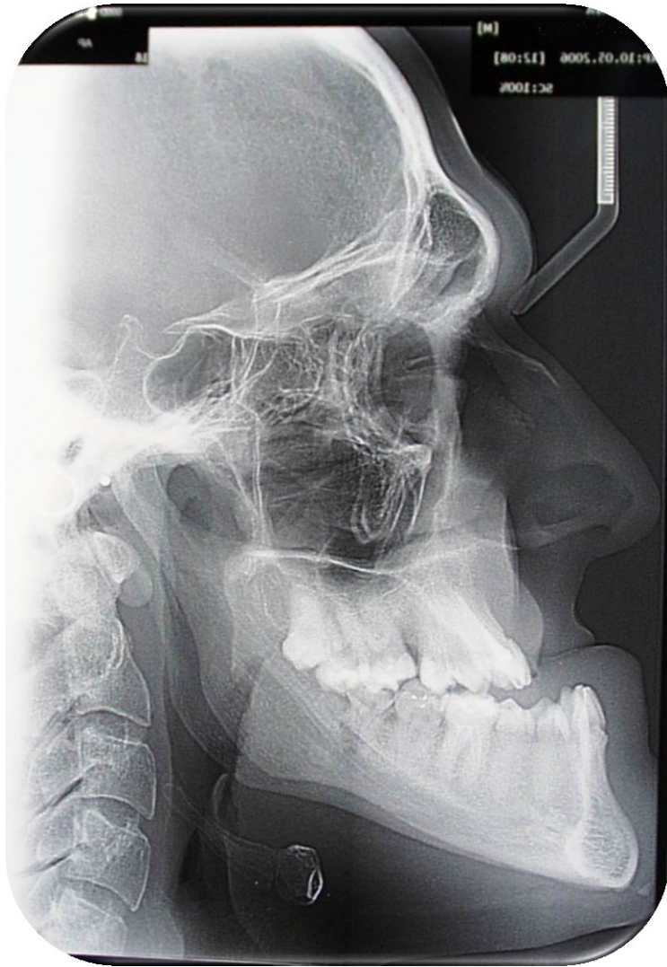
Slika 2. Lateralni kefalogram. Profil klase III po Angleu s mandibularnim prognatizmom, povečan mandibularni kut, povečan frontalni sinus.