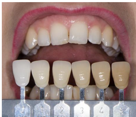
Slika 8. Početne različite nijanse u 3D Master linearnom ključu boja

može provesti tako da se krene od najsvjetlije, srednje ili najtamnije nijanse da bi odabir bio što brži (slike 8 i 9) (27).