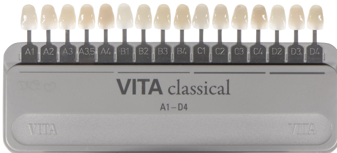
Slika 2. Distribucija boja u VITA Classical A1-D4 ključu prema nijansi

Obrnuto proporcionalni parametri posložene od najsvjetlijih i najmanje zasićenih do najtamnijih i najzasićenijih (slika 2) (26).