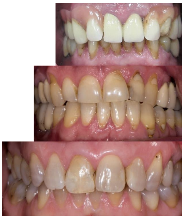
Slika 1. Različiti primjeri boje zuba pacijenata.

Raznolikost boje pojedinačnog zuba, ali i određenih skupina zuba, pridonosi individualnosti svakog pacijenta te predstavlja izazov stomatologu pri provođenju različitih zahvata u usnoj šupljini pri kojima je, osim promjene oblika i položaja, potrebno promijeniti i boju zuba (slika 1).