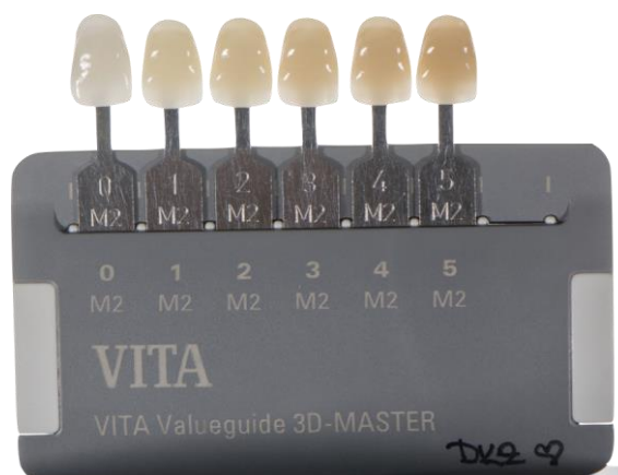
Slika 6. Primjerci različitih svjetlina u 3D Master linearnom ključu boja (tamno siva pločica)