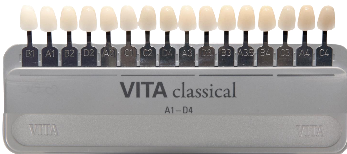
Slika 3. Distribucija boja u VITA Classical A1-D4 ključu prema svjetlini

Međutim, ova distribucija boja otežava postupak određivanja boje jer ljudsko oko posjeduje samo približno 6 do 7 milijuna čunjića koji raspoznaju razliku u nijansi (26). Istodobno se u oku promatrača nalazi više od 120 milijuna štapića za raspoznavanje razlike u svjetlini, što znači