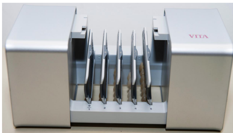
Slika 5. 3D Master linearni ključ boja

Sastoji se od šest pločica na kojima se nalazi određen broj zuba, što također ubrzava postupak, ali istodobno sprječava zamor oka jer stomatolog, prateći protokol, ne mora gledati sve zube nego samo odabrane (27). Dolazi u plastičnoj kutiji tako da su primjerci boja u njemu zaštićeni od utjecaja svjetla (slika 5).