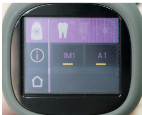
Slika 15. Rezultat mjerenja boje prirodnog zuba

Potrebno je odabrati odgovarajuću vrstu, izmjeriti boju i potom analizirati dobivene vrijednosti. Izmjerene vrijednosti izražavaju se i prema VITA Classical A1-D4 ključu i 3D Master linearnom ključu boja (slika 15).