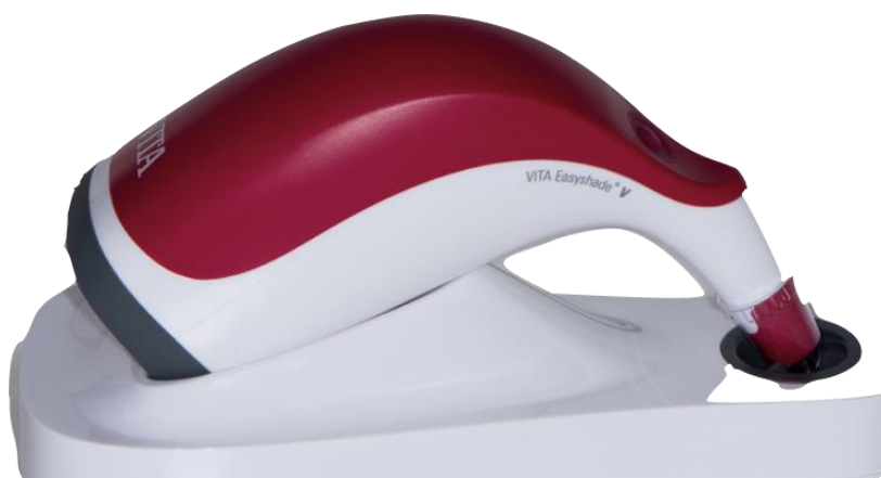
Slika 12. Kalibracija spektrofotometra Easyshade V

Spektrofotometar je prije uporabe potrebno kalibrirati i zaštititi mjernu sondu jednokratnim nastavcima koji sprječavaju prijenos infekcije (slika 12).