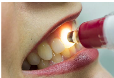
Slika 13. Pozicioniranje mjerne sonde na zubu

Program spektrofotometra nudi nekoliko sučelja i različite vrste mjerenja (slika 14).