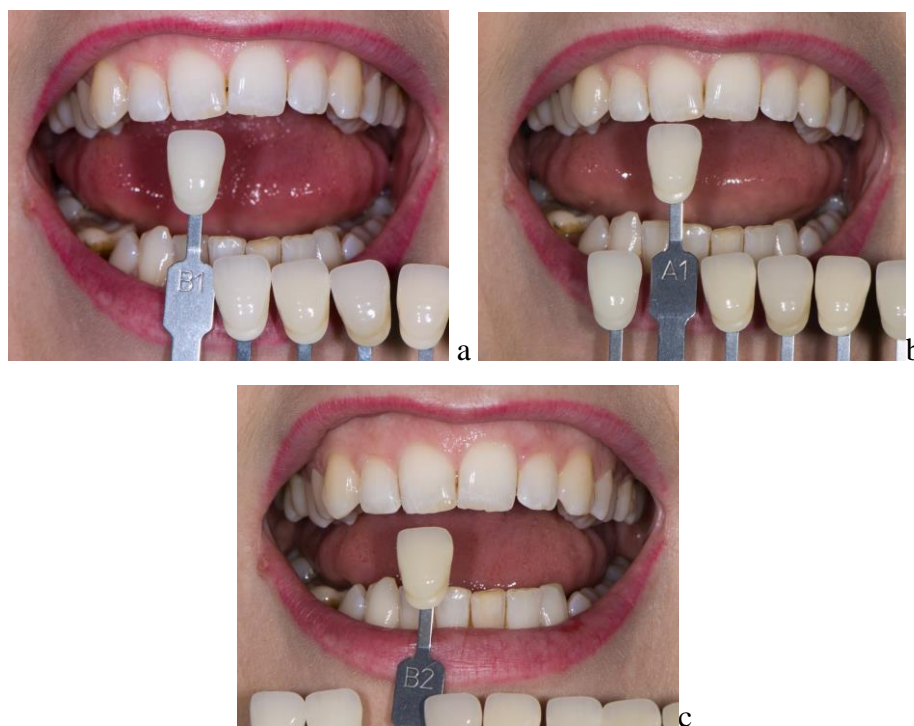
Slika 4. Postupak određivanja boje prirodnog zuba VITA Classical A1-D4 ključem boja posloženim prema svjetlini. a - B1 boja svjetlija je od promatranoga zuba; b - A1 boja odgovara boji promatranoga zuba; c - B2 boja tamnija je od promatranoga zuba.

Postupak određivanja boje ključem posloženim prema svjetlini moguće je potom provesti puno brže jer se po sistemu selekcije od najsvjetlije boje u ključu prema tamnijima odabire ona koja najbolje odgovara boji promatranog zuba. U slučaju pacijentice na slici 4 riječ je o A1 boji.