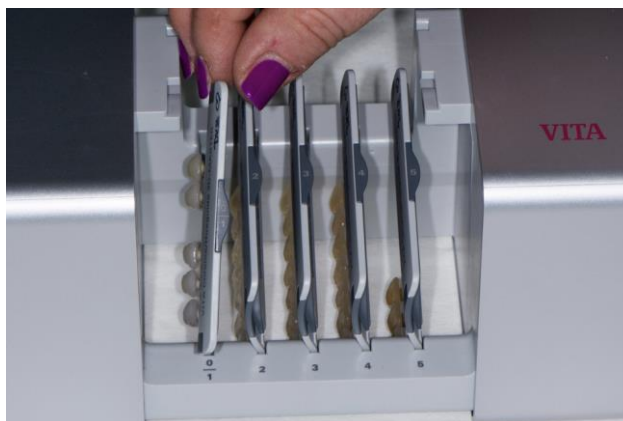
Slika 10. Odabir boje svjetline 1

Nakon odabira svjetline 1 iz kutije se odabire svijetlosiva pločica broj 1 (Slika 10) te se primjerci koje ključ nudi prinose promatranom zubu. U ovom slučaju svjetlina 1 nudi srednju nijansu manje (1M1) ili više zasićene (1M2) boje (slika 11).