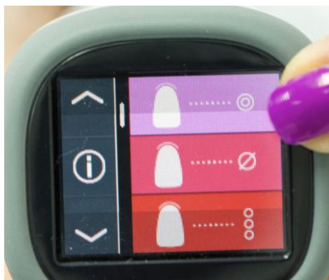
Slika 14. Odabir vrste mjerenja boje prirodnog zuba

Program spektrofotometra nudi nekoliko sučelja i različite vrste mjerenja (slika 14).