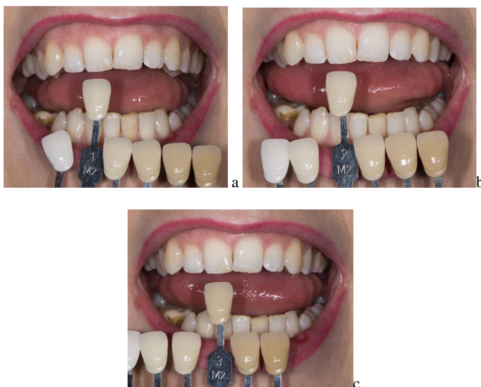
Slika 9. Postupak određivanja svjetline prirodnog zuba 3D Master linearnim ključem boja. a - svjetlina 1 odgovara boji promatranog zuba; b - svjetlina 2 tamnija je od promatranog zuba; c - svjetlina 3 tamnija je od promatranog zuba.