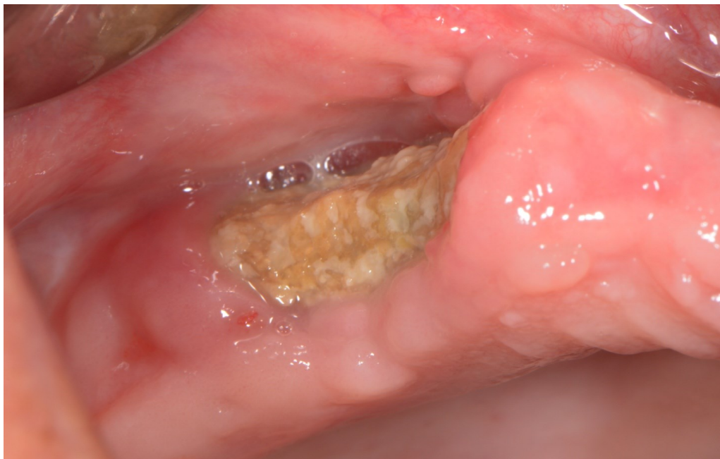
Slika 1. Klinička slika osteoradionekroze.

Često inicijalne lezije mogu biti asimptomatske, iako može biti prisutna i eksponirana devitalizirana kost s ulceriranom mukozom ili kožom. Zbog toga ORN često nije rano otkriven. Simptomi se počinju javljati u obliku bola, halitoze, disgeuzije, disestezija te je moguće zaostajanje hrane u području gdje je eksponiran sekvestar kosti. Interval između radioterapije i početka ORN-a može varirati, ali većinom se pojavljuje između četiri mjeseca i dvije godine (8). U najvećem broju slučajeva ORN se pojavljuje u razdoblju između šest do dvanaest mjeseci nakon zračenja, dok se nakon lokalne traume ORN može prezentirati i puno ranije. Važno je napomenuti da rizik ostaje doživotan, samo je s vremenom nešto manji. Ako je početak ORN-a u prvih 24 mjeseca nakon zračenja, može se povezati s radijacijskom dozom većom od 60 Gy, dok se kasni početak povezuje s traumom koja djeluje na kronično hipoksičnu kost. Na Slikama 1. i 2. može se vidjeti klinička slika čeljusti s ORN-om.