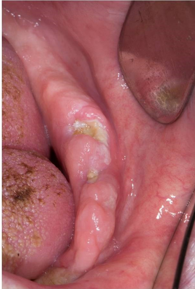
Slika 2. Klinička slika osteoradionekroze.

Preuzeto s dopuštenjem autora: doc. dr. sc. Marka Granića