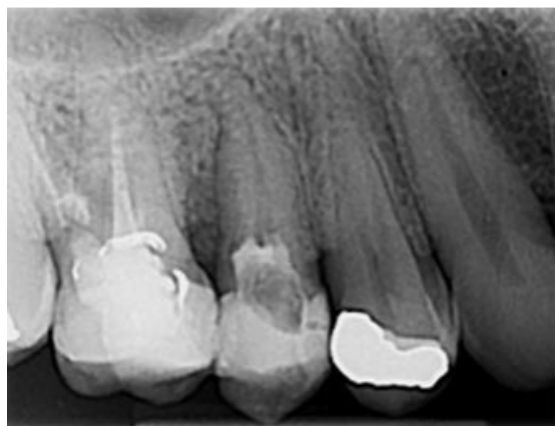
Slika 5. Rendgenska snimka drugog desnog gornjeg pretkutnjaka nakon postavljanja kalcijevog hidroksida.

Prilikom reparacija perforacija može se koristiti samo reparacijski materijal ili kombinacija s biokompatibilnom matricom/barijerom (7). Barijere se dijele na resorptivne i neresorptivne. Resorptivne barijere s najboljim učinkom su kolagen i kalcijev sulfat. Kao neresorptivne barijere i samostalni reparacijski materijali koriste se materijali na bazi kalcijevog sulfata; MTA i Biodentin (1). Prema brojnim istraživanjima, MTA pokazuje odlične rezultate i bez postavljanja matrice. Kombinacija se preporučuje koristiti za lakšu kontrolu pozicioniranja materijala, posebice ako nakon uklanjanja granulacijskog tkiva oko mjesta perforacije nastane šupljina (7).