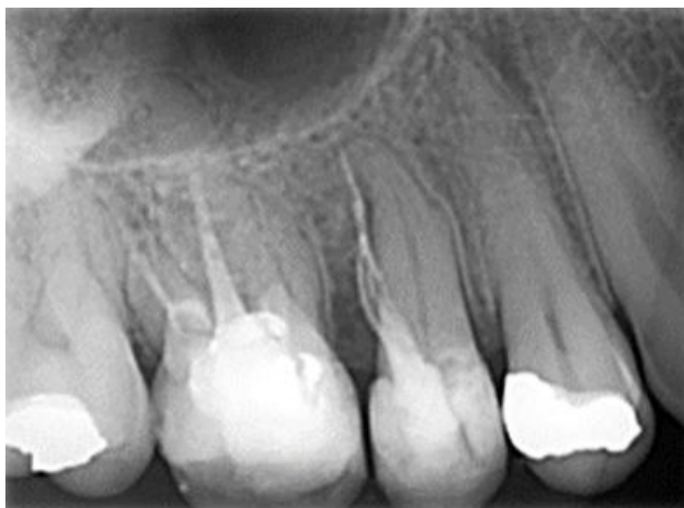
Slika 4. Na rendgenskoj snimci vidljiva je urađena perforacija te ispunjeni dezmodontni prostor materijalom za punjenje korijenskog kanala.