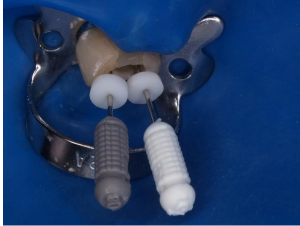
Slika 2. Endodontski zahvat na zubu izoliranom gumenom plahticom i kvačicom.

omekšavanje i otapanje dentina. U obilnim količinama sredstvo olakšava prodiranje instrumenata kroz kanal što za posljedicu prilikom neopreza može imati perforaciju.