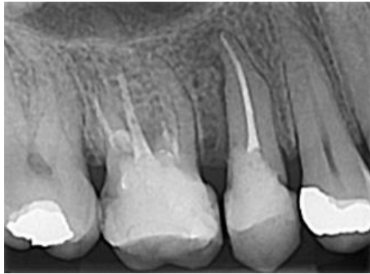
Slika 6. Rendgenska snimka drugog desnog gornjeg pretkutnjaka nakon završnog punjenja korijenskog kanala. Zatvaranje perforacije i privremeni ispun urađeni su uporabom staklenoionomernog cementa.