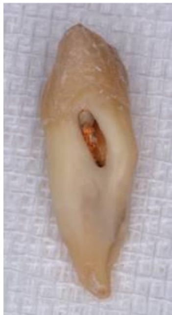
Slika 1. Perforacija u području koronarne trećine korijena.

Lokalizacija je najvažniji parametar kojim se procjenjuje ishod terapije. Perforacije u razini epitelnog pričvrstka i ruba alveolarne kosti imaju nepovoljan ishod terapije. Apikalnom migracijom spojnog epitela nastaje parodontni džep. Dolazi do bakterijske kolonizacije mjesta perforacije, zatim do gubitka kosti i epitelnog pričvrstka, a naposljetku do nastanka endoparodontne lezije. Nepovoljne su i perforacije u području furkacija višekorijenskih zubi jer upalni proces može dovesti do velikih oštećenja parodontnog tkiva (4).