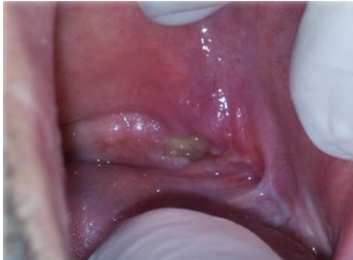
Slika 4. Klinički prikaz osteonekroze donje čeljusti