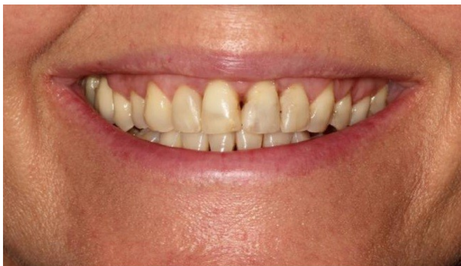
Slika 6. Gingivni osmijeh. Preuzeto s dopuštenjem autora: izv. prof. dr. sc. Andreja Carek

Gingivni osmijeh ili eng. gummy smile definira se kao od 2 milimetra veća vidljivost gingive prilikom osmijeha.