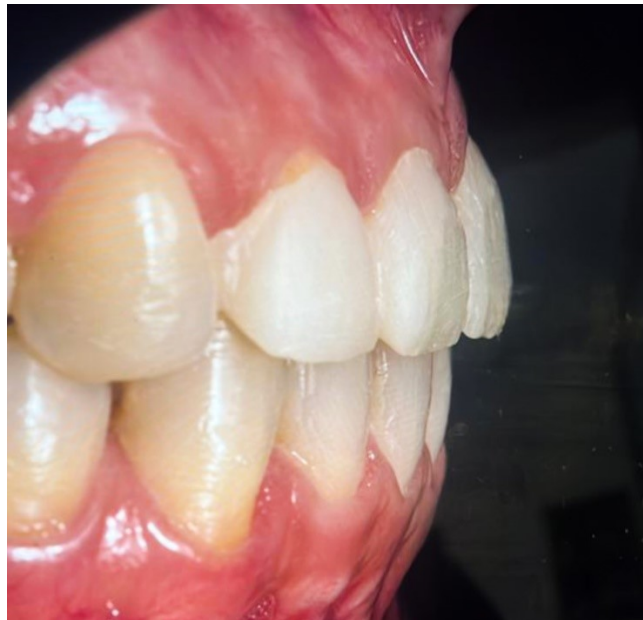
Slika 5. Mock up .