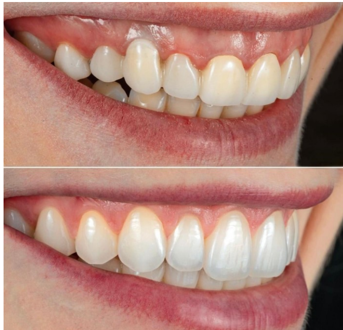
Slika 1. Restauracija estetske zone keramičkim ljuskicama s produljenjem kruna.