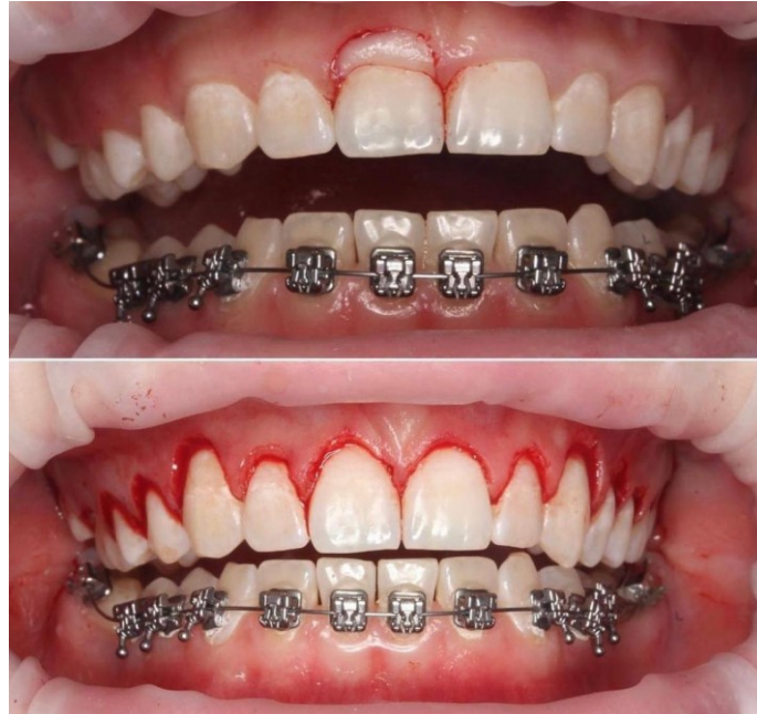
Slika 7. Gingivektomija – prije i poslije zahvata. Preuzeto s dopuštenjem autora: izv. prof. dr. sc. Andreja Carek