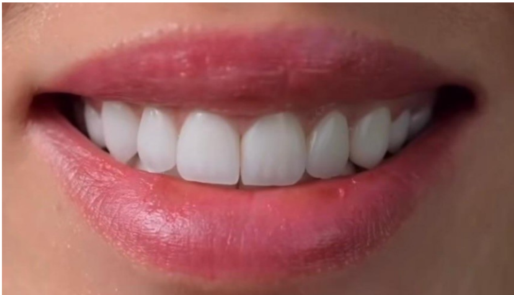
Slika 2. Keramičke ljuskice.

Estetske ljuskice terapijsko su sredstvo kojim se mijenja oblik, veličina, boja, nagib ili zaštićuje zub od različitih trošenja. Iziskuju minimalnu preparaciju vestibularne plohe te se primarno koriste za poboljšanje estetike osmijeha. Zahvaljujući razvoju adhezivne tehnike cementiranja, koja je uz mikromehaničko omogućila i kemijsko svezivanje protetskog nadomjeska za površinu zuba, postale su čest zahvat u ordinacijama dentalne medicine. Osim vestibularnih, postoje i palatinalne te okluzalne ljuske, koje se osim za estetsku korekciju izrađuju i u svrhu funkcijske rehabilitacije. Ovisno o materijalu razlikujemo kompozitne i keramičke ljuske. Ipak, zbog lošije estetike, bržeg trošenja kompozita i čestih diskoloracija, većina se pacijenata i stomatologa odlučuje za izradu keramičkih ljuskica. Keramičke ljuskice dugotrajni su protetski nadomjesci iznimnih estetskih svojstva. Karakterizira ih biokompatibilnost, trajnost i stabilnost. Površina ljuskica neporozna je, glatka i sjajna, što se postiže glaziranjem keramike. Tim se postupkom i sam nadomjestak štiti od trošenja i obojenja, dok smanjeno nakupljanje plaka na glatkoj površini ljuskice pridonosi očuvanju parodontnog zdravlja.