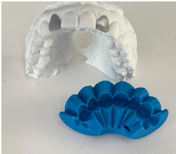
Slika 4. Wax up i silikonski ključ.

Druga opcija je digitalno planiranje u laboratoriju gdje tehničar analizira fotografije i skenove iz usta te pomoću programa za dizajniranje napravi prijedlog protetskog rada. Potom prijedlog plana šalje doktoru koji može dodatno sugerirati preinake. Naposljetku plan se ispiše pomoću 3D pisača i služi svrsi kao i klasičan wax-up .