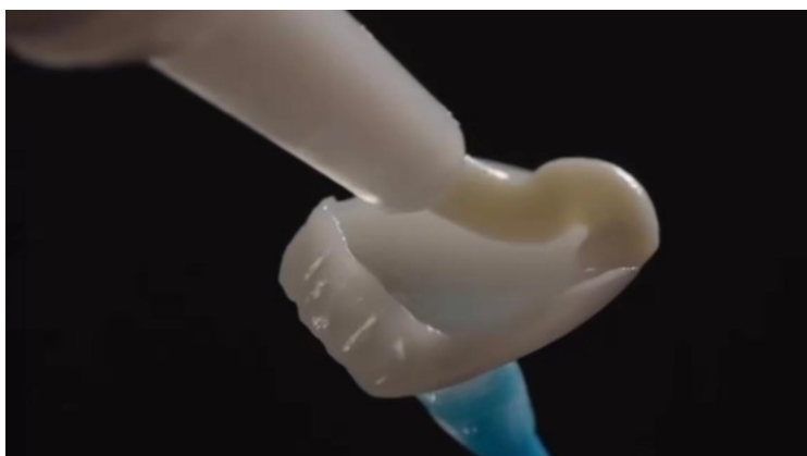
Slika 9. Nanošenje kompozitnog cementa.

Za cementiranje ljusaka upotrebljavaju se svjetlosno polimerizirajući kompozitni cementi koji omogućuju dulje vrijeme manipulacije, što je poželjno pogotovo ako se cementira više ljuski. U pripremljeni keramički nadomjestak unosi se cement i ljuska se pozicionira na zub.