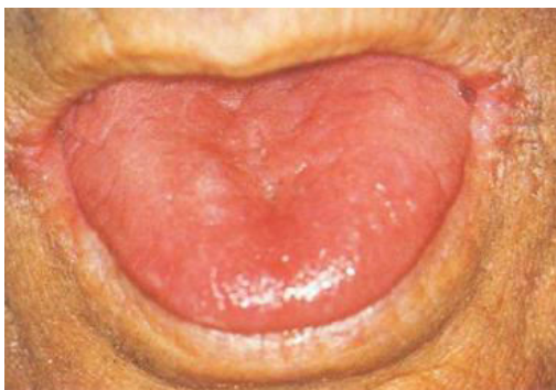
Slika 4. Angularni heilitis i atrofija jezičnih papila kod bolesnika s anemijom.

Sideropeniča anemija, koja nastaje kao posljedica gubitka krvi i nedostatka željeza, najčešća je anemija. Glavni pokazatelj anemije u usnoj šuplji je bljedoća sluznice. Zbog gubitka normalne keratinizacije, epitelne stanice usne šupljine atrofiraju. Jezik postaje gladak zbog atrofije filiformnih i fungiformnih papila. U skladu s tim, mijenja se i okusna osjetljivost. Bolesnici se mogu žaliti na osjećaj pečenja u ustima. Sluznica je sklona infekcijama i mehaničkim oštećenjima, što se osobito očituje u kutovima usana kao angularni heilitis (Slika 4).