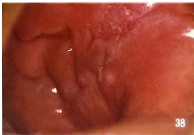
Slika 3. Kaldrmast izgled sluznice. Preuzeto iz (29).

sluznice crijeva može se pojaviti i na oralnoj sluznici, a uz patološke promjene izvodnih kanala malih žlijezda slinovnica, predstavlja granulomatozne promjene koje su glavna značajka bolesti (Slika 3).