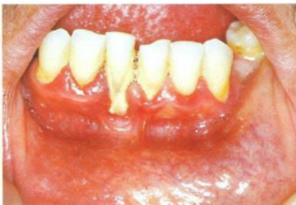
Slika 2. Parodontitis. Preuzeto iz (29).

Dugotrajna loša glikemijska kontrola dijabetičara povezana je s povećanom pojavom gingivitisa i parodontitisa te njihovim bržim napredovanjem, praćenim gubitkom alveolarne kosti (Slika 2).