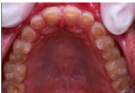
Slika 3. Zubne erozije uzrokovane GERB-om. Preuzeto iz (15).

erozije (18). Erozije mogu zahvatiti sve površine zuba, a najčešće su na okluzalnim i oralnim površinama (Slika 3).