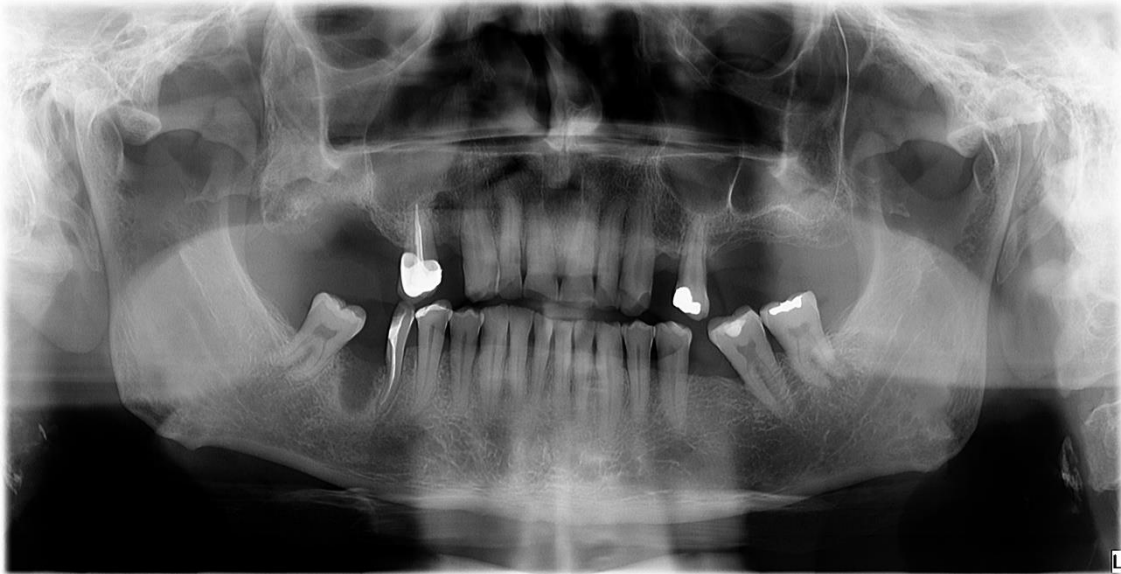
Slika 2. Ortopantomogram, oroantralna fistula nakon ekstrakcije zuba 16.

Preuzeto s dopuštenjem autora: Marija Sabljic, univ. mag. med. dent.