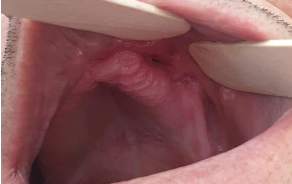
Slika 2. Klinički nalaz oroantralne fistule.