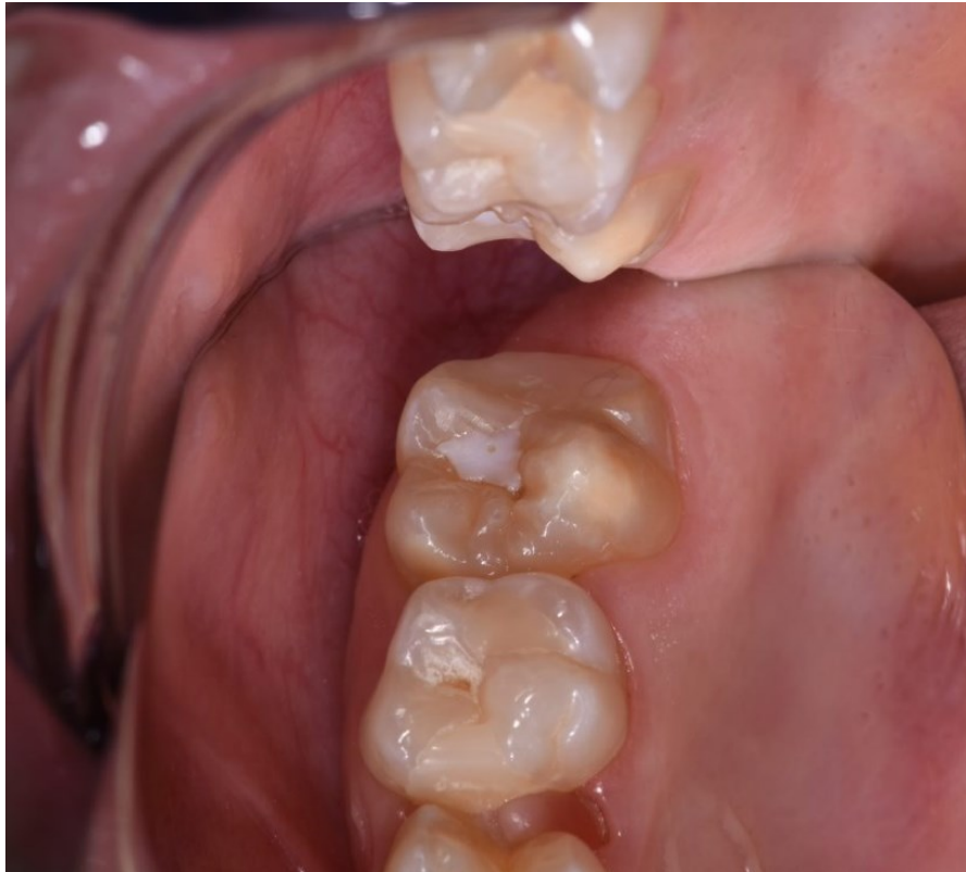
Slika 2. Blaga klinička slika MIH-e na gornjem trajnom prvom kutnjaku.