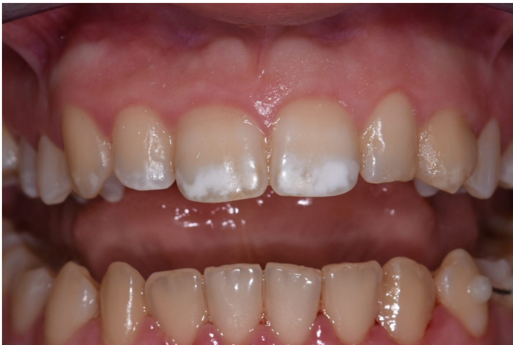
Slika 4. Izgled pacijentice prije ICON terapije.