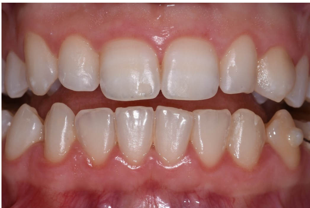
Slika 5. Izgled pacijentice nakon provedenog izbjeljivanja i ICON terapije.