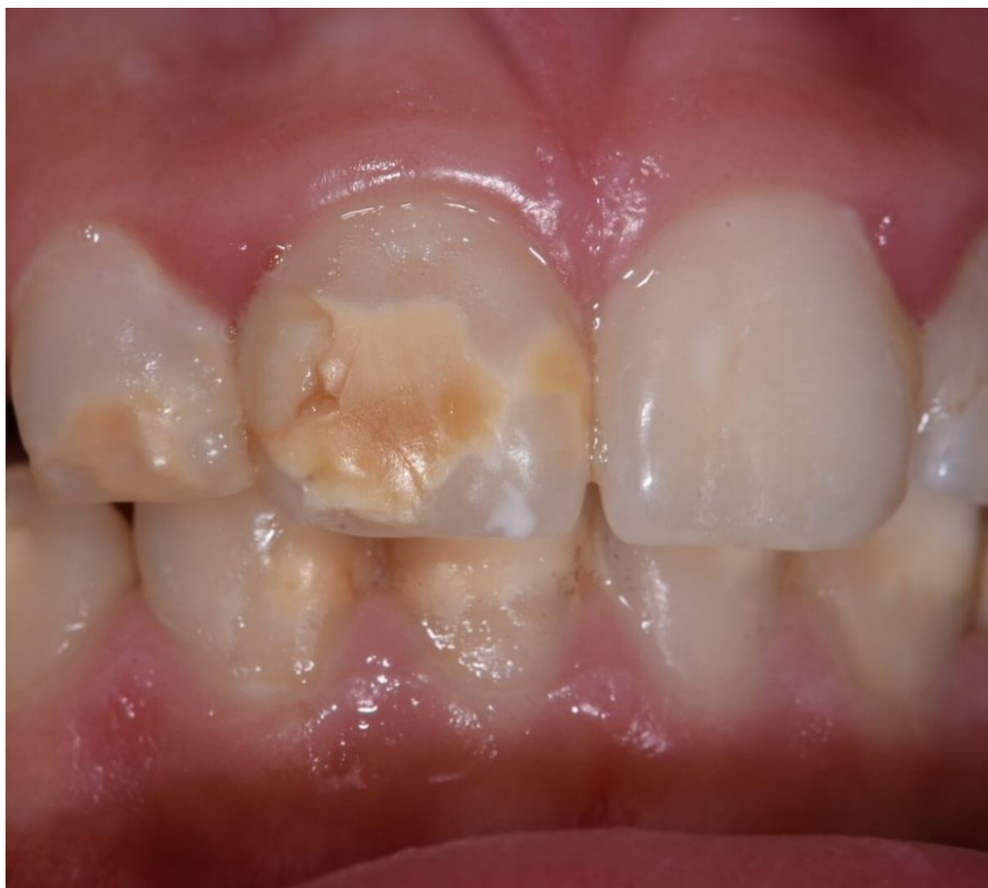
Slika 3. Opsežna klinička slika MIH-e na trajnim sjekutićima.