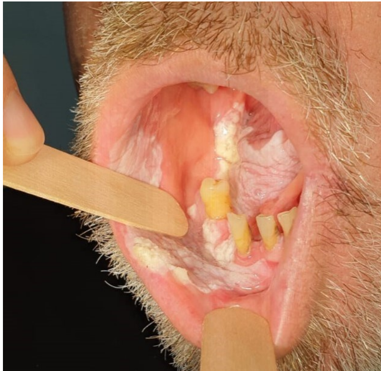
Slika 3. Proliferativna verukozna leukoplakija (Ijubaznošću doc.dr.sc. Ivana Salarića).

Proliferativna verukozna leukoplakija specifičan je tip višežarišne nehomogene OL koji pokazuje veliki postotak maligne alteracije (49,5 %) (Slika 3) (11). Započinje kao bijela linija koja se s vremenom mijenja u uzdignutu leziju nalik bradavici te koja pokazuje rezistenciju na sve oblike liječenja (3, 8).