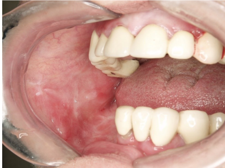
Slika 6. Oralni lihen planus.

Plakozni oblik bijela je hiperkeratotična blago uzdignuta lezija, homogene teksture te klinički nalikuje na OL (3, 18). Uobičajeno zahvaća dorzum jezika i bukalnu sluznicu. Ovaj oblik OLP-a češće je uočen u pušača, a kao retikularni i papularni otkriva se slučajno tijekom stomatološkog pregleda zbog čestog izostanka simptoma (3, 18).