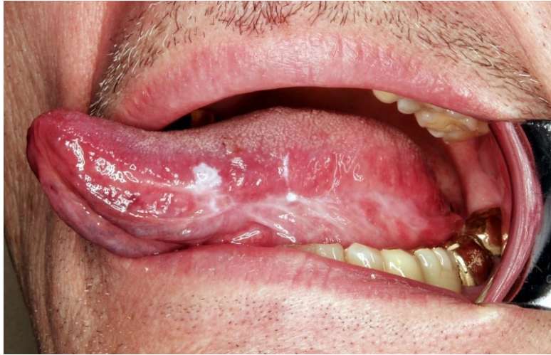
Slika 1. Homogena leukoplakija.

Nehomogena OL nepravilne je površine ponekad prošarane plitkim ulceracijama i nejasno definiranim rubovima (3, 6, 8). Nehomogena OL se klinički dijeli na tri podvrste: mrljastu-crveno bijela kombinacija boja gdje prevladava bijela te se može okarakterizirati kao eritroleukoplakija, nodularna- površina se sastoji od crvenih ili bijelih polipoidnih tvorbi, može biti verukozna (Slika 2) ili egzofitična tj. uzdignute ili naborane površine (3).