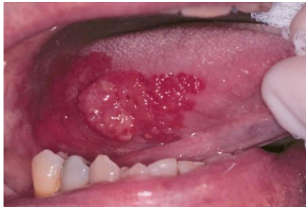
Slika 5. Eritroplakija.

postoji, no postoji nekoliko mogućih izgleda površine lezije. Površina promjene može biti baršunasta, granulirana, blago uleknuta i prošarana tračcima leukoplakije (3, 8, 15). Pojedini autori ju dijele na homogenu i nodularnu. Na dodir lezija je meka, a u slučaju induriranosti pokazuje maligni karakter (3). Najčešće lokalizacije u usnoj šupljini su: dno usne šupljine, ventralna strana jezika, meko nepce, bukalna sluznica i tonzilarni lukovi (3, 14). Lezije su najčešće manjeg promjera te se ne pojavljuju na više mjesta na sluznici. Simptomi uobičajeno izostaju, zbog čega se lezija kasno uočava. Eventualno može biti prisutno peckanje i metalni okus (3, 8).