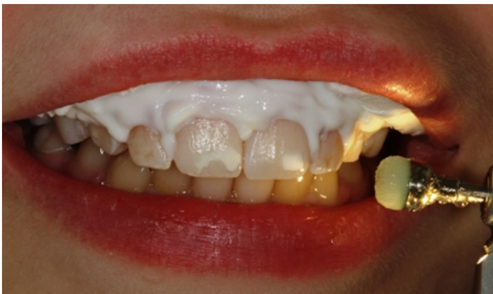
Slika 4. Uklanjanje površinskih naslaga četkicom pokretanom mikromotorom