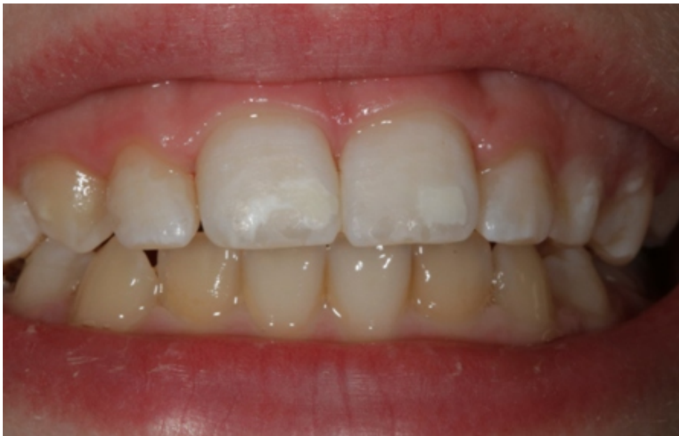
Slika 10. Izgled lezija neposredno nakon završetka postupka