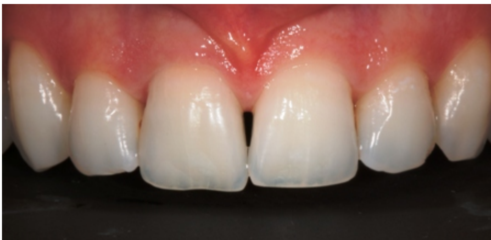
Slika 16. Izgled zuba tjedan dana nakon zahvata