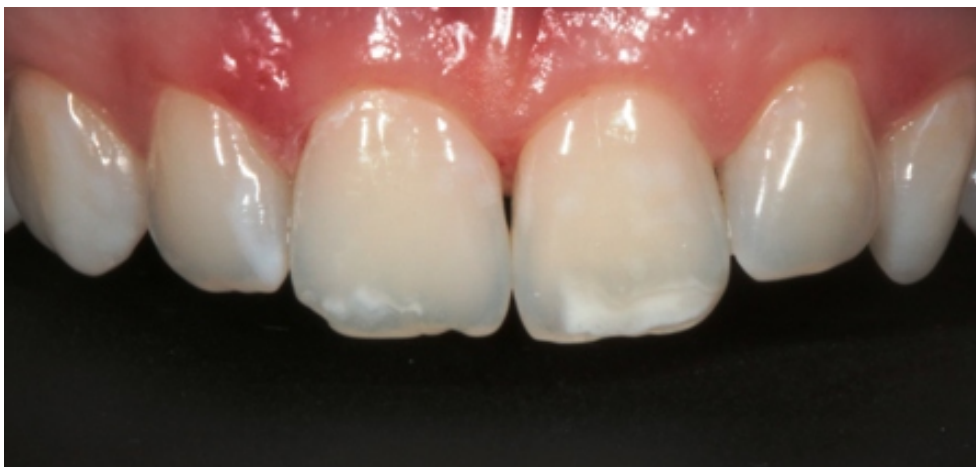
Slika 11. Početno stanje s hipomineraliziranim područjima na incizalnom rubu središnjih sjekutića

Pacijentica u dobi od 21 godine, dolazi u ordinaciju zbog estetskog problema bijele mrlje na prednjim zubima (Slika 11.). Prethodno nije bila u ortodontskoj terapiji. Kliničkim pregledom uočila se bijela mrlja na gornjim središnjim sjekutićima. Uz informirani pristanak pacijentice zubisupodvrgnuti ICON infiltracijskom postupku (Slika 12.). Nakon zahvata dobivena je promjena boje zuba (Slika 13.), a pacijentica je bila zadovoljna rezultatom.