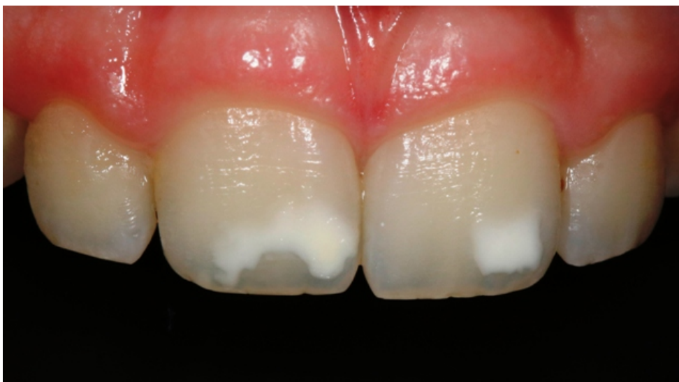
Slika 2. Bijele mrlje na središnjim sjekutićima

Pacijentica u dobi od 18 godina dolazi u ordinaciju zbog estetskog problema bijelih mrlja na gornjim prednjim zubima. Prethodno nije bila u ortodontskoj terapiji. Kliničkom pregledom uočene su bijele mrlje na gornjim sjekutićima (Slika 2.). Uz pristanak pacijentice zubi su podvrgnuti infiltraciji smolom ICON tehnikom (Slika 3.-9.). Rezultat zahvata je bio blaga promjena boje zuba (Slika 10.), pacijentica je bila zadovoljna rezultatom, međutim boja nije u potpunosti promijenjena.