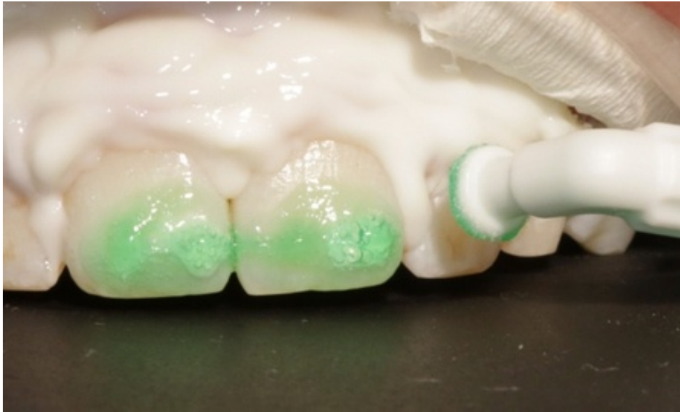
Slika 5. Nanošenje 15%-tneklorovodične kiseline IconEtch (DMG America, SAD)