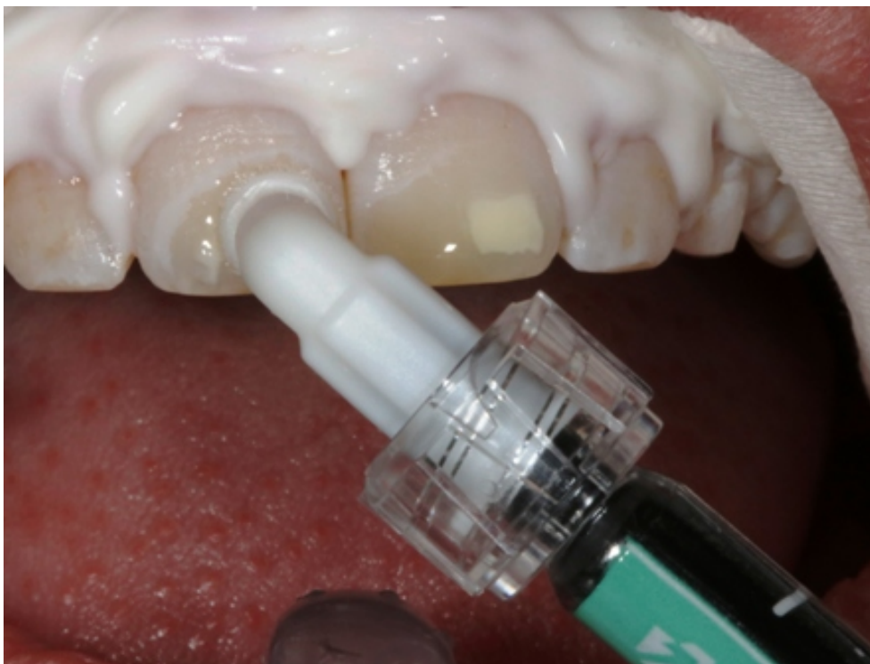
Slika 8. Nanošenje infiltracijske smole Icon-Infiltrant (DMG America, SAD)