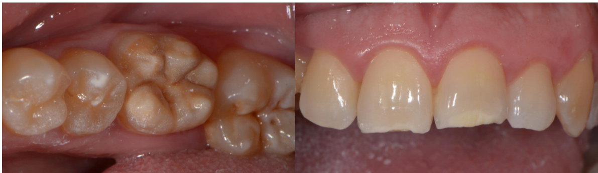
Slika 1. Molarano-incizivna hipoplazija koja zahvaća kvržice donjih prvih kutnjaka i incizalne rubove središnjih sjekutića.

Molarano-incizivna hipomineralizacija (MIH) sistemskog je porijekla, zahvaća jedan ili sve prve trajne kutnjake, a često uključujući i trajne sjekutiće (Slika 1.). Hipomineralizacija nastaje zbog ometanja resorptivnog potencijala ameloblasta i inhibicije proteolitičkih enzima, što dovodi do retencije proteina te manjka kalcijevog fosfata. Zahvaćenost sjekutića očituje se promjenom boje labijalnih površina bez gubitka cakline, rijetko praćene prekidom njezinog kontinuiteta. Kod MIH-a, caklina je podložnija nastanku karijesa pa je izgled defekta asimetričan, dok kontralateralni zub ne mora ili može biti umjereno do jače oštećen (22).