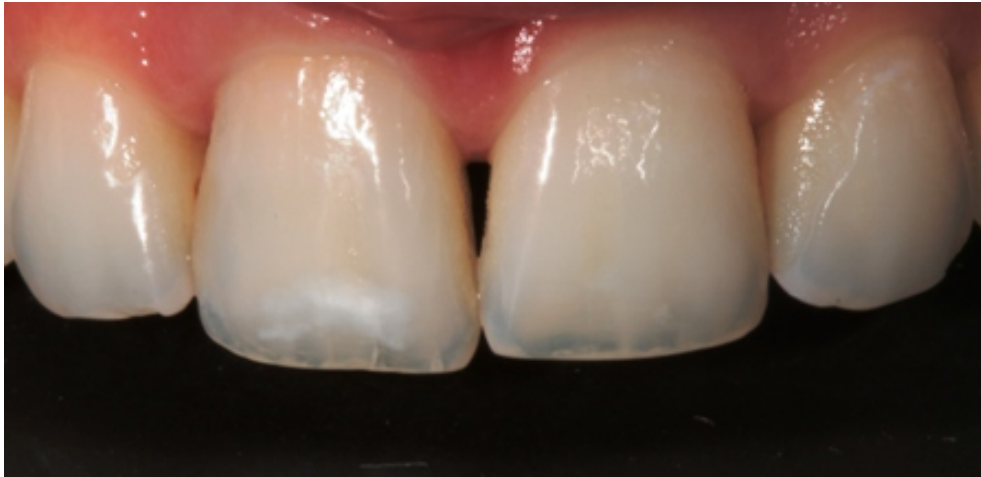
Slika 14. Stanje lezije prije zahvata