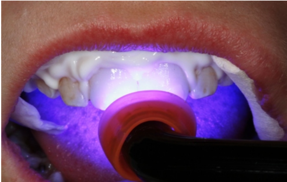
Slika 9. Polimerizacijananešene smole