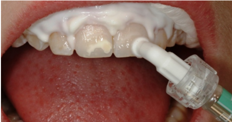
Slika 7. Nanošenje otopine etanola Icon-Dry (DMG America, SAD)