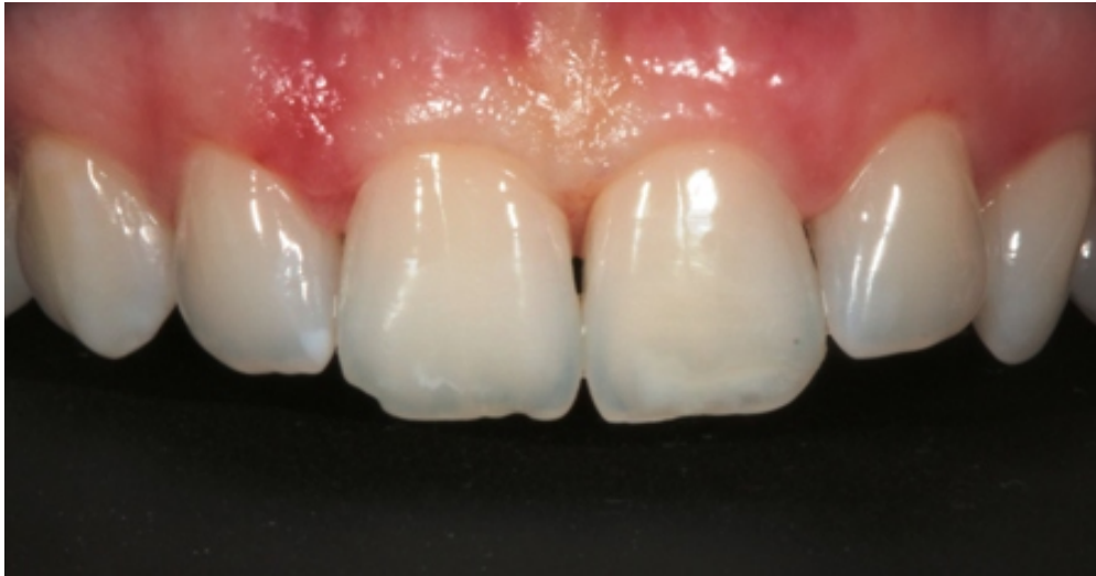
Slika 13. Stanje nakon provedenog postupka