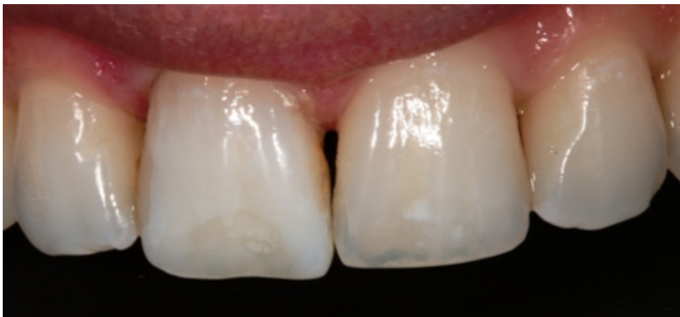
Slika 15. Stanje lezije neposredno nakon zahvata