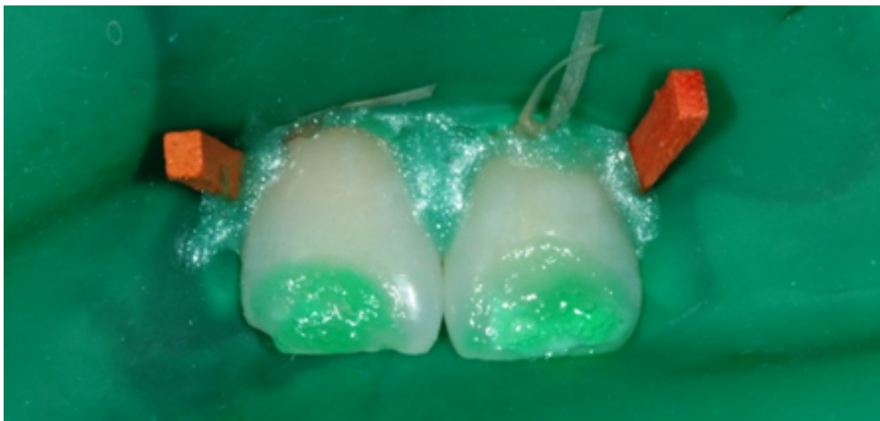
Slika 12. Izolacija radnog područja koferdamom