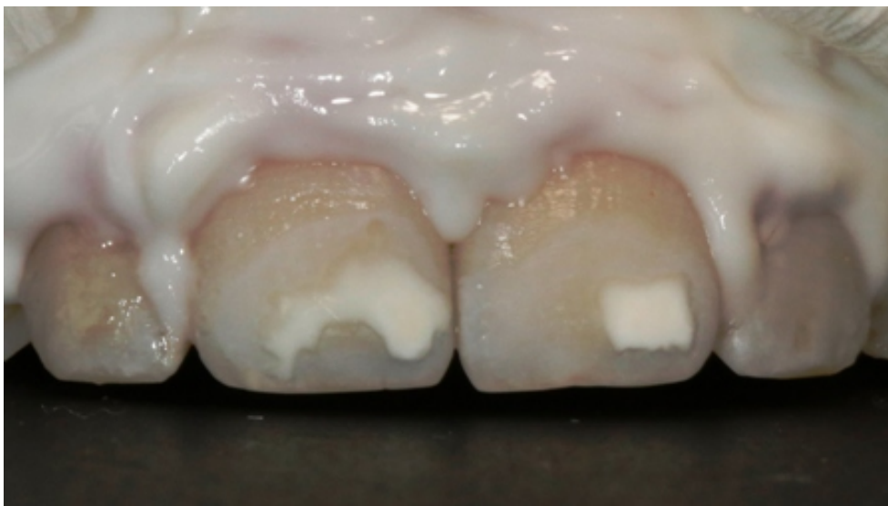
Slika 6. Izgled površine cakline nakon uklanjanja i ispiranja kiseline