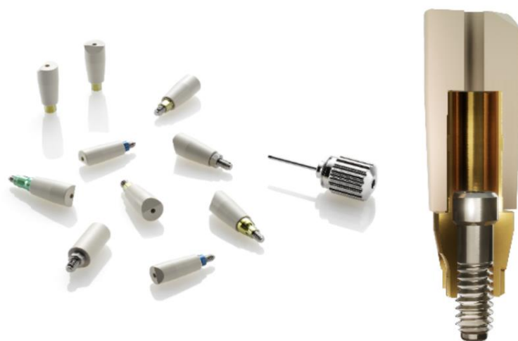
Slika 4. Elos Medtech Dental scanbody primjer. Preuzeto s (35).