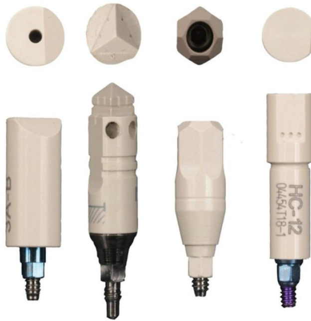
Slika 5. Scanbody : ELOS, MG, Ticare MG i TALL. Preuzeto sa (41).

Utvdili su da se šire i duže površine skeniranja lakše skeniraju i preciznije prenose poziciju implantata u laboratorij. Autori tvrde da scanbody -i koji sadrže oštre i nagle prijelaze s jedne površine na drugu uzrokuju veće promjene u preciznosti za razliku od onih koji imaju površine zaobljenih i kontinuiranih prijelaza. Također smatraju da se na digitalnom otisku bolje prikazuju površine koje su polirane i jednostavne od onih koje su granulirane i nepravilne. Pregledom dostupnih materijala izrade navode da je najbolje koristiti scanbody sa radioopaknim završnim slojem dok oni metalnog sjaja nisu pokazali takvu preciznost. U istraživanju koriste scanbody -e od PEEK-a jer je on materijal neutralne boje, jasno je ispoliran i stabilan na promjene temperature. Dokazuju da je Ticare MG (PRMG) scanbody najprecizniji u određivanju angulacije i visine implantata, dok je za prijenos udaljenosti od aksijalne osi najprecizniji Talladium (TALL). Najlošije rezultate dobili su koristeći MG scanbody koji se sastoji od dva djela te sadrži piramidalnu stranu i vrlo kompliciran dizajn (41).