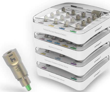
Slika 3. 3Shape scanbody primjer.

3Shape scanbody također su izrađeni tvornički od titanija što prema navodima proizvođača osigurava mogućnost sterilizacije do 100 puta. Scanbody izrađen od titanija osigurava njihovu vidljivost na rendgenskoj snimci što omogućava provjeru veze scanbody -a i implantata (24). U slučaju krivog pričvršćivanja scanbody -a u implantat, položaj implantata koji skeniramo bit će pogrešan te izrađeni protetski nadomjestak neće odgovarati.