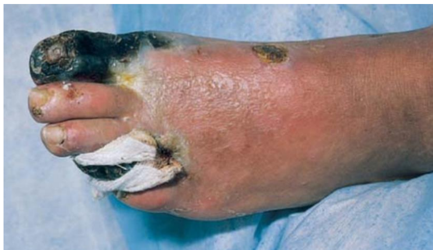
Slika 1. Dijabetičko stopalo. Preuzeto: (5)

Rane dijabetičkih pacijenata zacijeljuju sporo zbog ishemije, a hipoksija i oslabljena prehrana tkiva pridonose infekciji ulkusa.