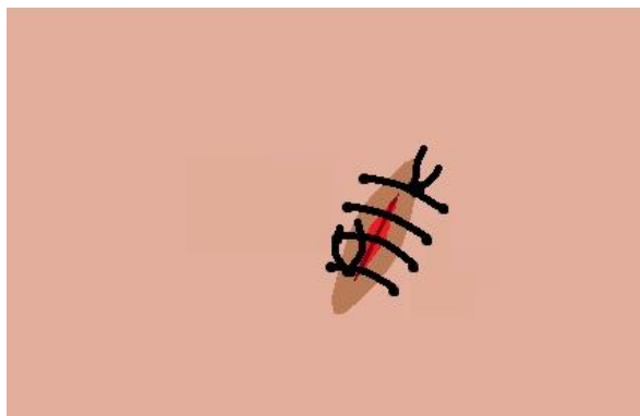
Slika 5. – Prikaz kontinuiranog šava bez zaključavanja

veže se čvor. Igla i konac se dotle vuku kroz tkivo dok ne ostane još samo mala omča koja se pri vezanju koristi kao kratki kraj konca. (19) Što je manje uboda za dobivanje savršene adaptacije reznja, to je cijeljenje povoljnije. (17,5)