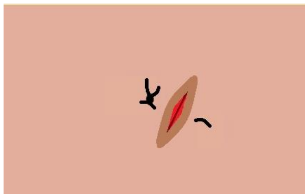
Slika 3. – Prikaz vertikalnog madrac šava

prolaska igle, ali u istoj liniji, te se provuče oralno prema bukalno. Zatim slijedi čvoranje. (18,22) Kod takvog šava dolazi do sigurne adaptacije rubova rane, ima veću snagu od pojedinačnog šava, ali spram horizontalnog madrac šava mehanički je slabiji. (5,27)