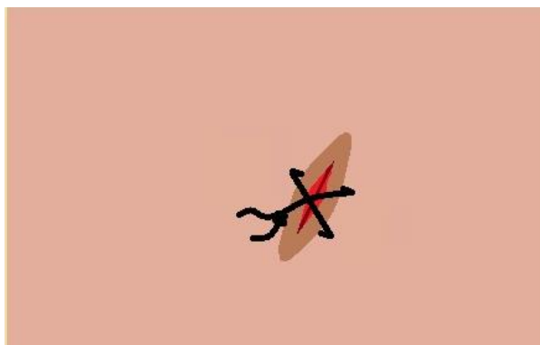
Slika 2. – Prikaz križnog šava

Tehnika šivanja križnog šava objedinjuje dva jednostavna pojedinačna šava. Naime, prvo se napravi jedan pojedinačni šav, ali bez čvoranja. Zatim se napravi još jedan pojedinačni šav, istog smjera, ali udaljen 1 cm u liniji rane od prvog pojedinačnog šava. Napravi se čvor. Takav šav na površini rane formira oblik X čime se omogućuje postavljanje rubova rane u sredinu, a samim time i postizanje dobre hemostaze. (18)