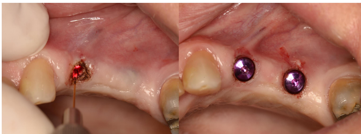
Slika 2. Otvaranje implantata diodnim laserom.

Važno je svesti ekspoziciju tkiva laserskoj zruci na minimum kako bi spriječili provođenje topline do implantata. Kada koristimo ispravnu valnu duljinu, titanski implantati ne apsorbiraju, već reflektiraju lasersku svjetlost. Implantati obloženi hidroksiapatitom apsorbiraju energiju lasera te u takvim situacijama treba biti posebno oprezan (6).