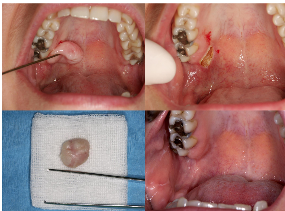
Slika 5. Uklanjanje fibroma diodnim laserom. Ljubaznošću izv. prof. dr. sc. Dragane Gabrić.

Uklanjanje fibroma se provodi diodnim laserom na takozvanim fibrom postavkama, valne duljine 975 nm, snage 5 W, u CW načinu rada. 14 dana nakon operacije došlo je do potpunog cijeljenja (6).