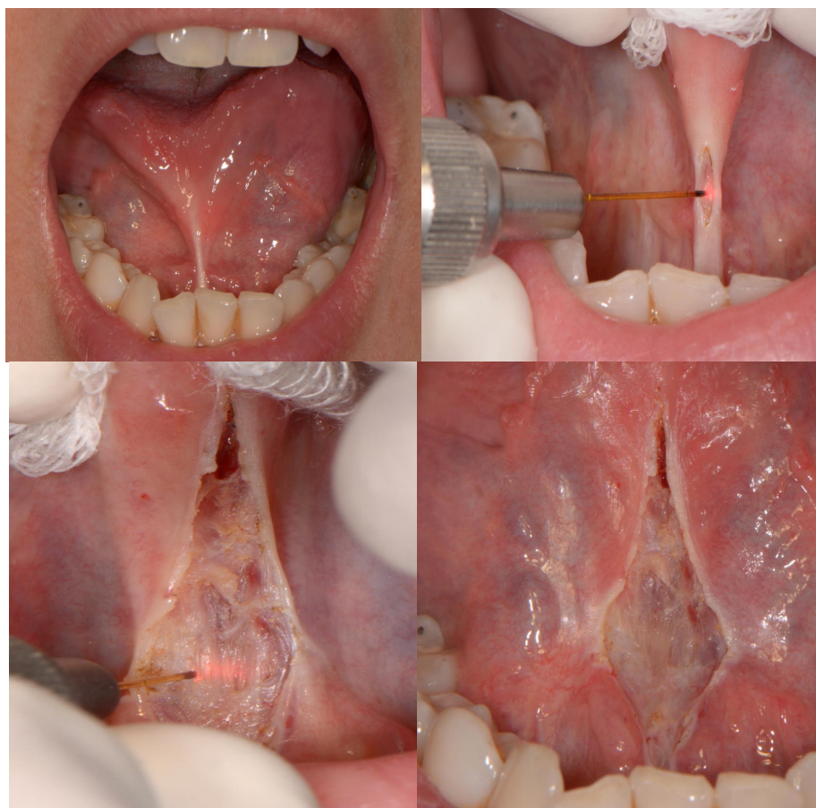
Slika 4. Lingvalni frenulum uklonjen diodnim laserom.

Tkivo je u potpunosti zacijelilo per secundam nakon 7 dana (40).