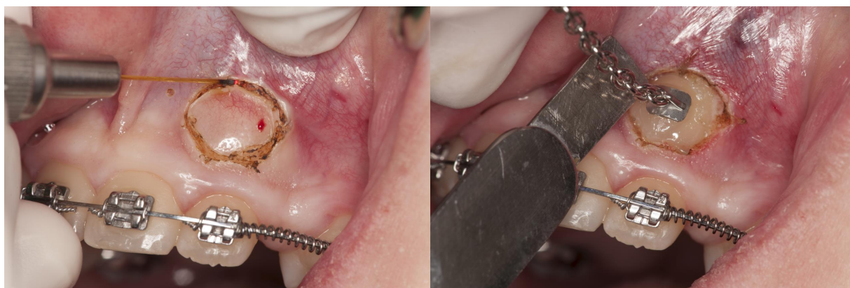
Slika 6. Prikazivanje impaktiranog zuba diodnim laserom i ljepljenje ortodontske bravice.

Ekspozicija impaktiranog zuba provodi se diodnim laserom na gingivektomija postavkama. Učini se kružna incizija oko krune impaktiranog zuba, a mukoza se odstrani polugom sve dok kruna zuba ne bude vidljiva (6).