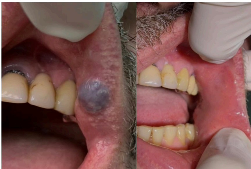
Slika 3. Benigna oralna vaskularna lezija uklonjena diodnim laserom.

Postoje 3 tehnike uklanjanja benignih oralnih vaskularnih lezija laserom: ekscizijska biopsija (EB), intralezijnska fotokoagulacija (ILP) i transmukozna termokoagulacija (TMT) (33).