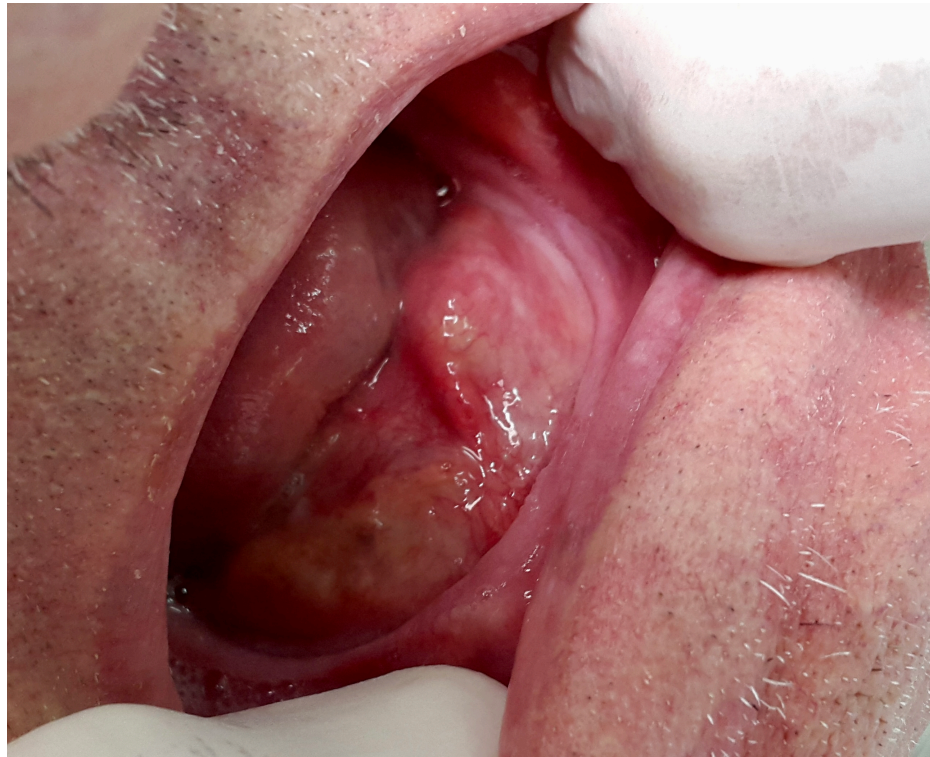
Slika 1. Oteklina na lijevoj strani dna usne šupljine

Nakon detaljno skupljenih anamnestičkih podataka, napravljen je fizikalni intraoralni pregled kojim se uočila oteklina na lijevoj strani dna usne šupljine te izrazita crvenilost otvora izvodnog kanala submandibularne žlijezde ( caruncula sublingualis ). Zatim se bimanualnom palpacijom lijeve submandibularne žlijezde palpirala tvrda, dobro ograničena tvorba, izrazito osjetljiva na bol. Na temelju anamneze i fizikalnog pregleda postavlja se dijagnoza - sialolitijaza lijeve submandibularne žlijezde.