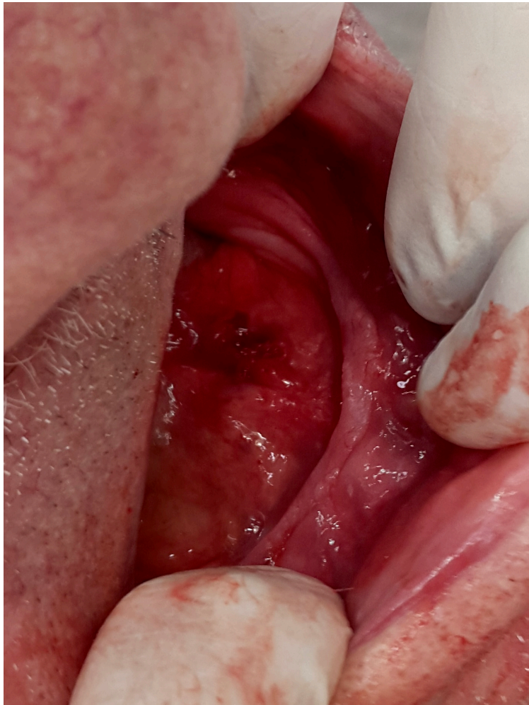
Slika 7. Sluznica neposredno nakon vađenja sijalolita