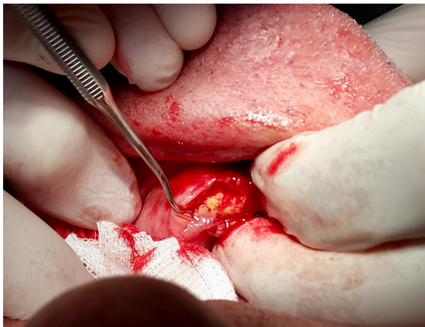
Slika 4. Ekstirpacija sijalolita iz izvodnog kanala submandibularne žlijezde (preuzeto s dopuštenjem autora prof. dr. sc. Berislava Perića)