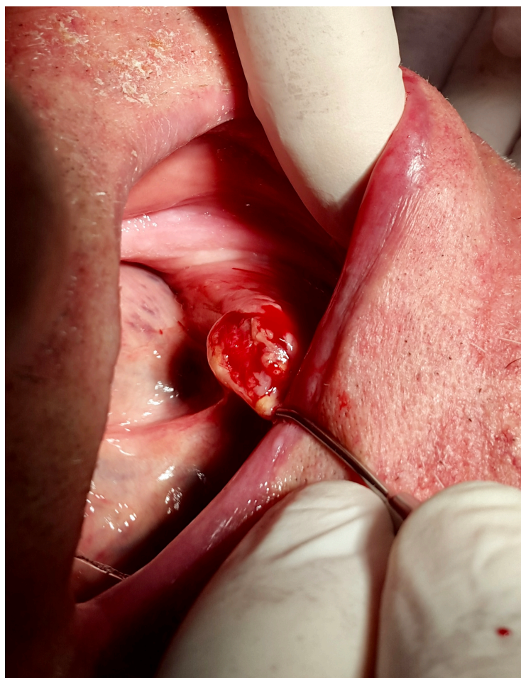
Slika 3. Incizija sluznice i kanala u razini sijalolita (preuzeto s dopuštanjem autora prof. dr. sc. Berislava Perića)

Nakon incizije i oslobađanja sijalolita, sijalolit se ekstirpira odnosno upotpunosti uklanja pomoću anatomske pincete (ravne pincete sa poprječnim udubljenjima) i savijenom kohleom (kohlea pogodna za donju čeljust). Pokreti moraju biti kontrolirani kako ne bi došlo do paranja sluznice, i kamenac se lagano gurao u smjeru otvora kako ne bi došlo do oštećenja zahvaćene žlijezde i okolnih struktura. S obzirom da je kamenac bio smješten u zadnjoj trećini izvodnog kanala, nije bilo potrebno uklanjati submandibularnu žlijezdu zajedno sa kamencom.