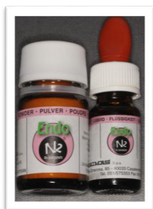
Slika 4. Endo N2