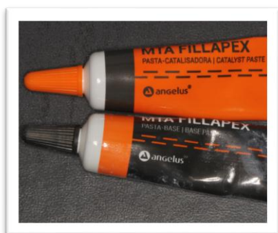
Slika 1. MTA