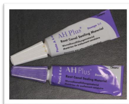
Slika 2. AH Plus