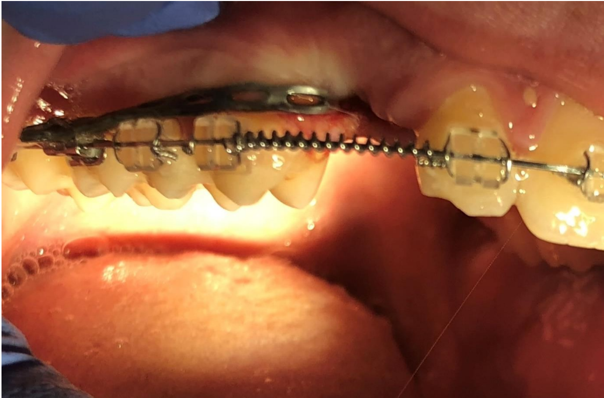
Slika 6. Ortodontsko izvlačenje labijalno impaktiranog maksilarnog očnjaka.