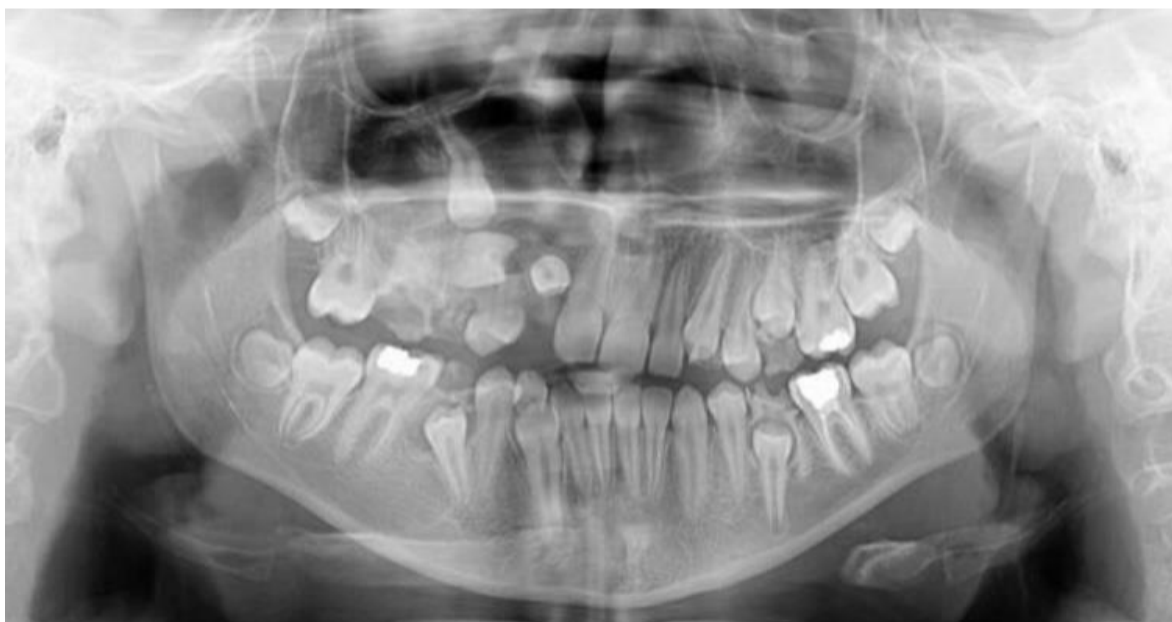
Slika 5. Labijalna visoka nedislocirana impakcija zuba 13.

Ovdje se impaktirani zub nalazi u projekciji sredine alveole te je položen visoko apikalno (Slika 5.). Metoda izbora kirurškog prikaza je metoda zatvorenog režnja. Učini se rez po sredini grebena s rasteretnim okomitim rezovima labijalno, ili, ukoliko pozicija zuba dozvoli, sulkularna incizija s palatinalne strane susjednog zuba. Zatim se uklanja kost kako bi se oslobodio najširi dio krune. Lančić se adhezivnim postupkom lijepi na labijalnu plohu zuba. Izvrši se repozicija režnja, a lančić prolazi ispod režnja ili izlazi kroz inciziju na sredini grebena. Zatim se veže na luk ili na susjednu bravicu, a s prvom se aktivacijom može krenuti za dva do tri tjedna od operativnog zahvata (Slika 6.) (5).