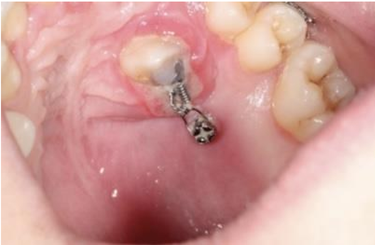
Slika 7. Izvlačenje zuba pomoću mini vijak implantata.

Kada se palatinalna impakcija očnjaka dijagnosticira tek nakon nicanja svih ostalih trajnih zuba, samostalna kirurška ili kirurško-ortodonska terapija su jedina moguća rješenja. Tada je metoda izbora kirurškog prikaza metoda zatvorene erupcije. Nakon zacijeljivanja tkiva postoje dvije varijante nastavka terapije – spontano nicanje ili ortodonsko izvlačenje. Kada se zub ortodonski izvlači, potrebno je eruptivnu silu usmjeriti lingvalno i zub vući prema distalno i palatinalno kako bi se izbjegao dodir očnjaka i palatinalne kosti te tako spriječilo oštećenje korijena lateralnog sjekutića. Kada se zub vuče lateralno prema bezubom grebenu, dolazi do pritiska krune na palatinalnu kost i nekroze čiji je rezultat resorpcija kosti, a iza krune izostaje remodelacija kosti. U terapiju se mogu uključiti i mini vijak implantati (engl. TADs – temporary anchorage devices ) (Slika 7.) (5, 30) .