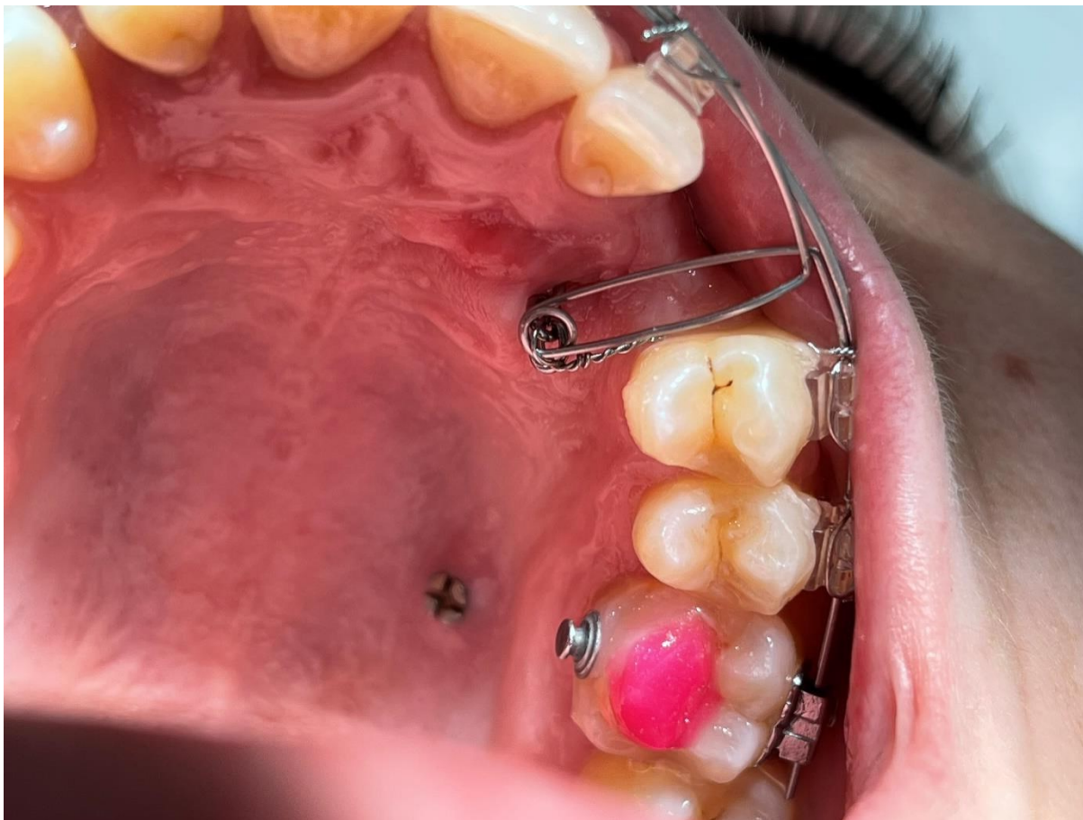
Slika 8. Smještanje zuba u luk pomoću Ballista petlje.

Preuzeto s dopuštanjem autora: prof. dr. sc. Sandra Anić Milošević, dr. med. dent.