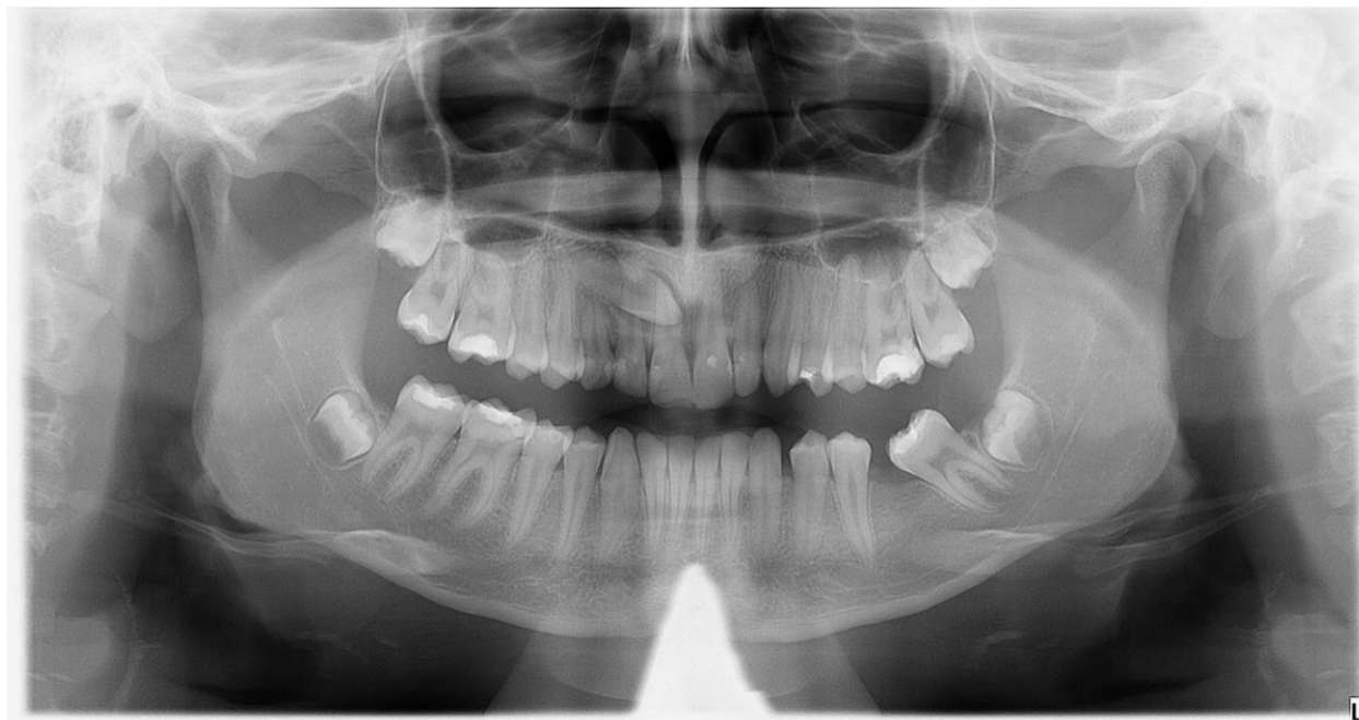
Slika 3. Ektopična labijalna impakcija desnog maksilarnog očnjaka.

Kod ovoga tipa impakcije, impaktirani se očnjak najčešće nalazi mezijalno od lateralnog inciziva (Slika 3.). U ovome slučaju, metoda izbora kirurškog prikaza zuba je apikalno pomaknuti režanj. Ukoliko je prisutno dovoljno labijalne kosti, odiže se puni mukoperiostalni režanj, a ako je prisutna labijalna dehiscijencija, izvede se djelomični raskoljeni režanj. U režanj treba uključiti najmanje dva milimetra gingive, ali oko sjekutića treba ostaviti najmanje dva milimetra gingive. Kost se ukloni i učini se otvor veći od krune zuba. Ortodonska terapija može započeti šest tjedana nakon zahvata. Ukoliko ortodont sumnja na mogućnost prerastanja gingive preko zuba u tom razdoblju, na zub se može zalijepiti bravica (5).