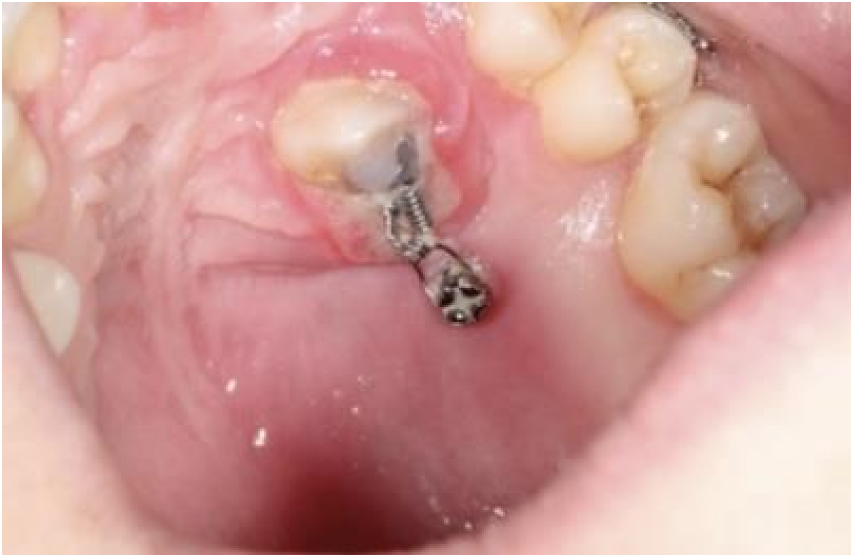
Slika 7. Izvlačenje zuba pomoću mini vijak implantata.

Kada se palatinalna impakcija očnjaka dijagnosticira tek nakon nicanja svih ostalih trajnih zuba, samostalna kirurška ili kirurško-ortodonska terapija su jedina moguća rješenja. Tada je metoda izbora kirurškog prikaza metoda zatvorene erupcije. Nakon zacijeljivanja tkiva postoje dvije varijante nastavka terapije – spontano nicanje ili ortodonsko izvlačenje. Kada se zub ortodonski izvlači, potrebno je eruptivnu silu usmjeriti lingvalno i zub vući prema distalno i palatinalno kako bi se izbjegao dodir očnjaka i palatinalne kosti te tako spriječilo oštećenje korijena lateralnog sjekutića. Kada se zub vuče lateralno prema bezubom grebenu, dolazi do pritiska krune na palatinalnu kost i nekroze čiji je rezultat resorpcija kosti, a iza krune izostaje remodelacija kosti. U terapiju se mogu uključiti i mini vijak implantati (engl. TADs – temporary anchorage devices ) (Slika 7.) (5, 30) .