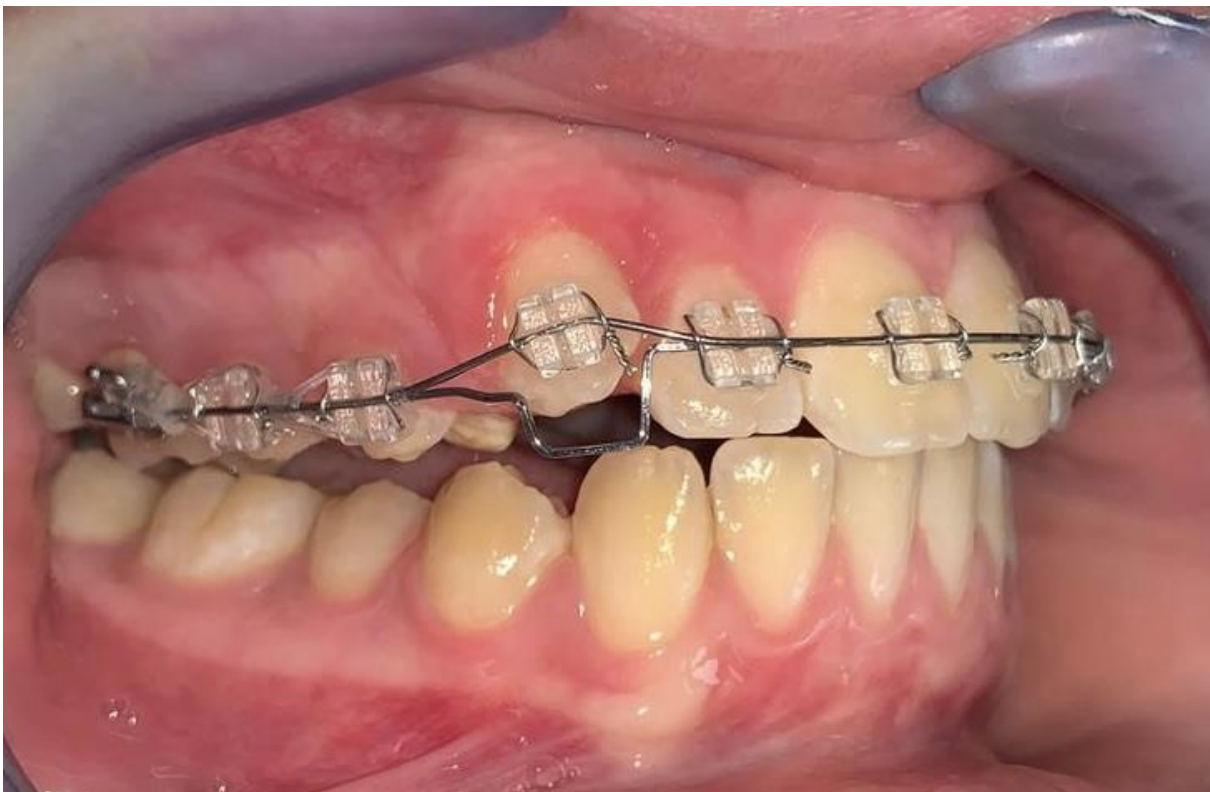
Slika 4. Nivelacija impaktiranog maksilarnog očnjaka pomoću sekundarnog luka.

Kod ovoga tipa impakcije, vrh impaktiranog zuba nalazi se koronalno od caklinsko-cementnog spojišta okolnih zuba te je prisutna široka zona pričvrstne gingive. Metoda izbora kirurškog prikaza zuba je gingivektomija. Jednostavnim rezom otkriju se dvije trećine krune zuba, bez uklanjanja kosti. Postavlja se zaštitni zavoj kako bi se spriječilo prerastanje gingive. Nakon razdoblja zacijeljenja u trajanju od tri tjedna, lijepi se bravica na zub i počinje se s ortodontskom terapijom. U većini slučajeva, impaktirani je zub smješten na sredini alveolarnog grebena, pravilno orijentiran te nakon kirurškog prikaza nivelacija zuba ne predstavlja poteškoću (Slika 4.) (5, 28).