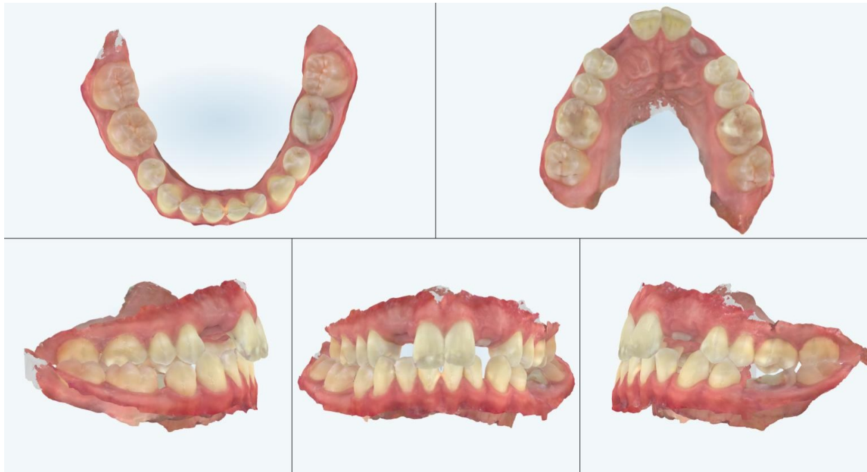
Slika 1. Klinički prikaz stanja pacijenta s hipodoncijom gornjih lateralnih sjekutića, donjih drugih pretkutnjaka i impakcijom gornjih očnjaka (digitalni otisak).