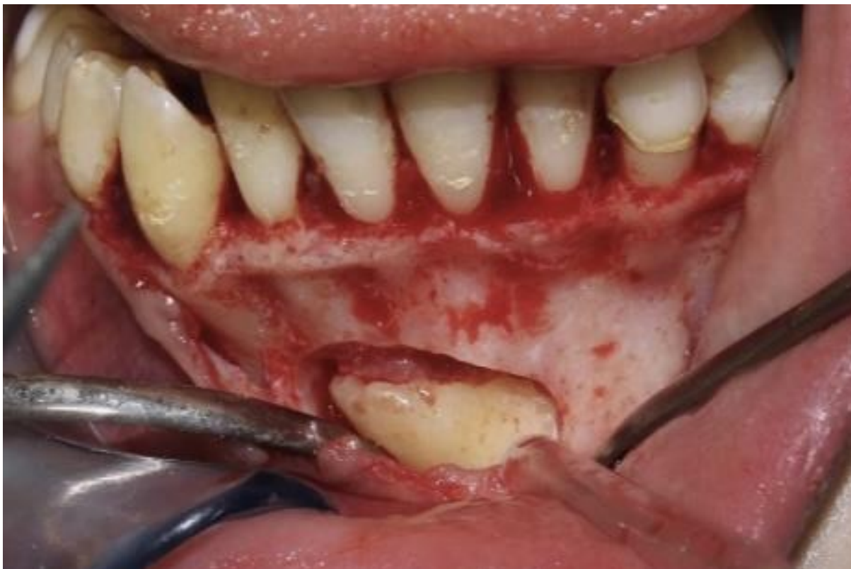
Slika 9. Horizontalna impakcija zuba 33.