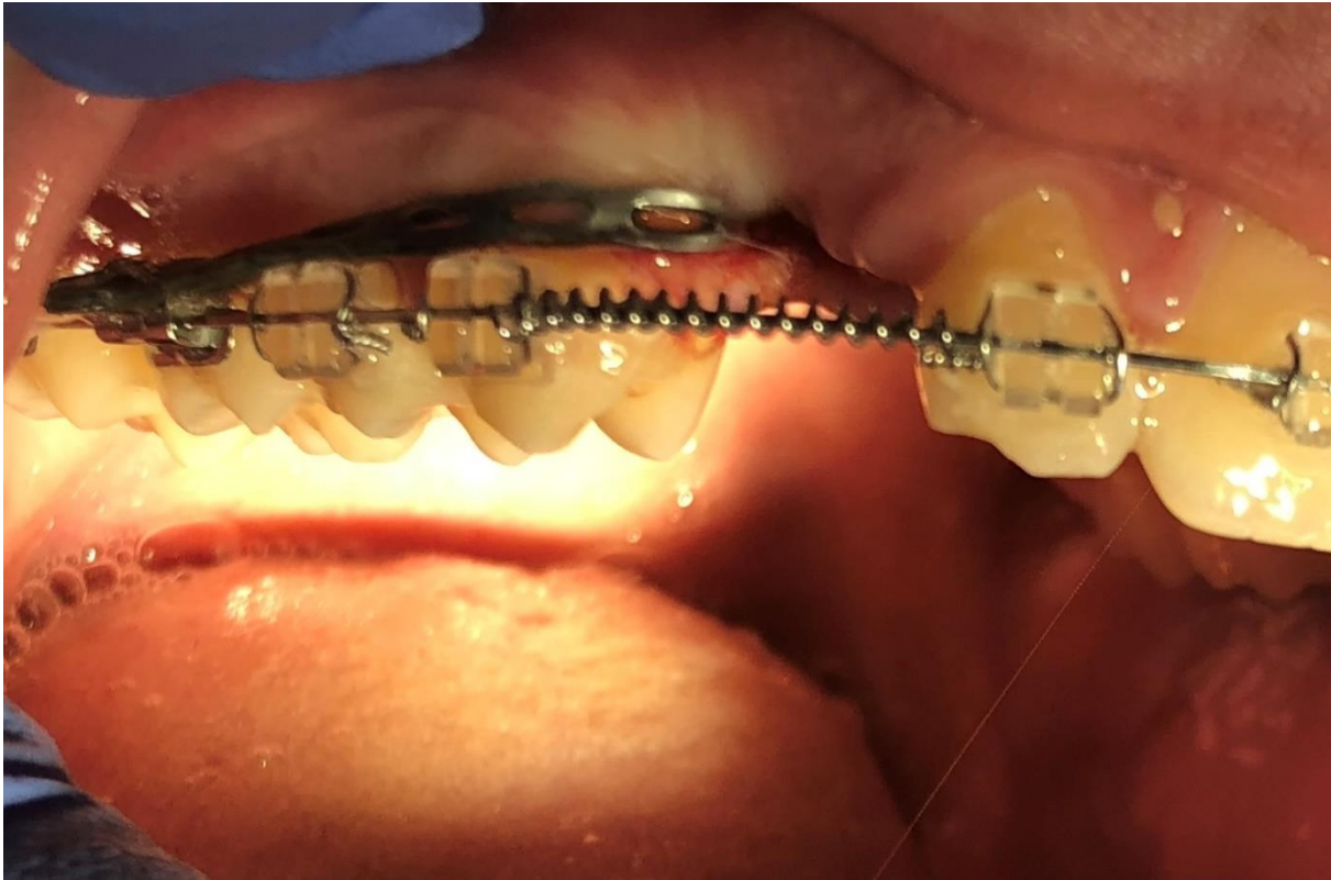
Slika 6. Ortodontsko izvlačenje labijalno impaktiranog maksilarnog očnjaka.