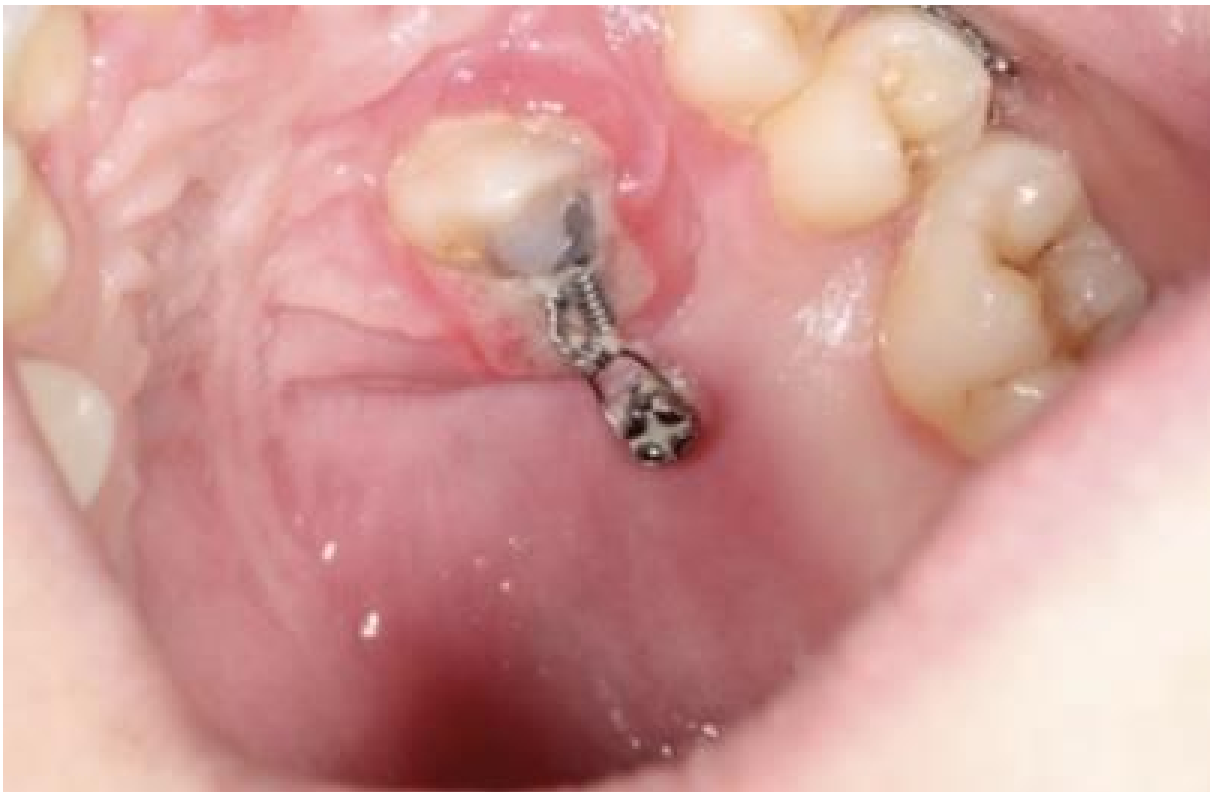
Slika 7. Izvlačenje zuba pomoću mini vijak implantata.

Kada se palatinalna impakcija očnjaka dijagnosticira tek nakon nicanja svih ostalih trajnih zuba, samostalna kirurška ili kirurško-ortodonska terapija su jedina moguća rješenja. Tada je metoda izbora kirurškog prikaza metoda zatvorene erupcije. Nakon zacijeljivanja tkiva postoje dvije varijante nastavka terapije – spontano nicanje ili ortodonsko izvlačenje. Kada se zub ortodonski izvlači, potrebno je eruptivnu silu usmjeriti lingvalno i zub vući prema distalno i palatinalno kako bi se izbjegao dodir očnjaka i palatinalne kosti te tako spriječilo oštećenje korijena lateralnog sjekutića. Kada se zub vuče lateralno prema bezubom grebenu, dolazi do pritiska krune na palatinalnu kost i nekroze čiji je rezultat resorpcija kosti, a iza krune izostaje remodelacija kosti. U terapiju se mogu uključiti i mini vijak implantati (engl. TADs – temporary anchorage devices ) (Slika 7.) (5, 30) .