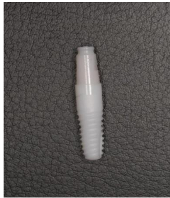
Slika 1. Jednodijelni cirkonij-oksadni implantat, WhiteSky, Bredent®.

Bikortikalni implantati tipa vijka (BCS, engl. Basal cortical screw implants ) iskorištavaju potencijal bazalne kosti sidreći se u kortikalnoj kosti na barem dva mjesta čime se postiže dobra primarna stabilnost implantata, i mogućnost imedijatnog opterećenja. Ugrađuju se kroz gingivu alveolarnog grebena „flapless“ tehnikom, bez odizanja mukoperiostalnog režnja. Sadrže agresivne navoje koji omogućavaju retenciju i sudjeluju u prijenosu opterećenja (22). Mini implantati su vrsta jednodijelnih implantata smanjenog promjera (<3mm), te posebnog oblika glave koji osigurava retenciju protetskog rada. Koriste se pri smanjenim dimenzijama alveolarnog grebena kada nije moguće sidriti veće implantate, najčešće za retenciju mandibularnih totalnih proteza na implantatima. Također se ugrađuju neinvazivnom tehnikom bez odizanja mukoperiostalnog režnja (23).