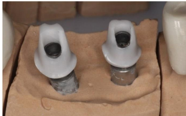
Slika 2. Cirkonij-oksidna nadogradnja na radnom modelu.

Prema načinu izrade, implantatne nadogradnje dijelimo na konfekcijske i individualne. Konfekcijske su strojno prefabricirane, s mogućnošću prilagodbe u laboratoriju ili intraoralno. Izrađuju se od titanija ili cirkonij-oksidne keramike (slika 2). Zahtijevaju precizno postavljanje implantata u kosti, jer svako naknadno brušenje može oslabiti keramiku te smanjiti retenciju i rezistenciju protetskog rada. Imaju prednosti poput niže cijene i jednostavnije izrade, ali ne mogu postići idealan izlazni profil mekih tkiva. Stoga se koriste u lateralnim segmentima, dok se u estetskoj regiji izrađuju individualne nadogradnje. Individualne nadogradnje specifične su za svakog pacijenta, zahtijevaju otisak, a izrađuju se modeliranjem u vosku na radnom modelu i lijevanjem u laboratoriju ili virtualnim modeliranjem CAD/CAM sustavom (26).