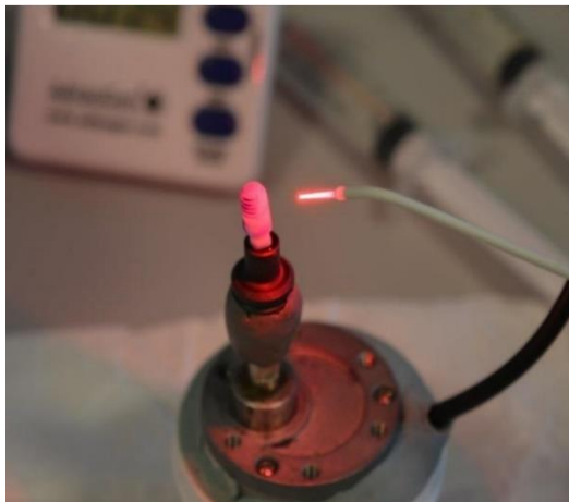
Slika 5. Cirkonij-oksidi implantat smješten u rotacijski motor i tretiran diodnim laserom Helbo® (Helbo, Grieskirchen, Austria).

Ultraljubičasto (UV, engl. Ultraviolet ) zračenje i hladna atmosferska plazma mogu inducirati ekscitaciju elektrona, povećavajući površinsku energiju cirkonijevog dioksida. Kontaktni kut vode pjeskarenih površina smanjio se sa 51^\circ na 9,4^\circ nakon tretmana ultraljubičastim svjetlom od 15 minuta čime cirkonijev dioksid postiže ultrahidrofilno stanje. Histomorfometrijska analiza pokazala je da su uzorci tretirani ultraljubičastim svjetlom imali bolju oseointegraciju i jači kontakt kosti i implantata te da su četiri tjedna nakon implantacije bili gotovo u potpunosti okruženi s kosti, naspram netretiranih uzoraka koji su i dalje sadržavali fibrozno vezivno tkivo (54). Također je zabilježena pojačana stanična aktivnost i gustoća ljudskih gingivalnih fibroblasta i ekspresija integrina na cirkonij-oksidnim površinama tretiranim hladnom atmosferskom plazmom u razdoblju od 30 i 60 sekundi, prilikom korištenja helija kao plina nosača. Nakon tretmana od 90 sekundi i duže, aktivnost ovih stanica krenula je opadati, što upućuje da hladna atmosferska plazma ima rano i kratko pozitivno djelovanje na cirkonij-oksidnoj površini (55). Plazmom obrađene cirkonijske površine pokazale su povećanje nanotvrdoće zbog povećanog sadržaja cirkonija u premazu te povećani osteogeni potencijal, bolja mehanička svojstva i otpornost na koroziju (56).