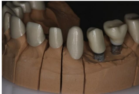
Slika 4. Radni model s izrađenom osnovom iz cirkonij-oksidge keramike za krunice na implantatima – pričvršćivanje cementom.

Također, nedostatak je nemogućnost skidanja rada uslijed tehnoloških komplikacija kao što su lom nadogradnje, vijka, ili same krunice. Najčešće se koristi kompozitni cement, za koji vrijede sve prednosti i nedostaci cementiranja (33).