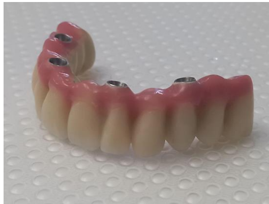
Slika 10. All-on-4.