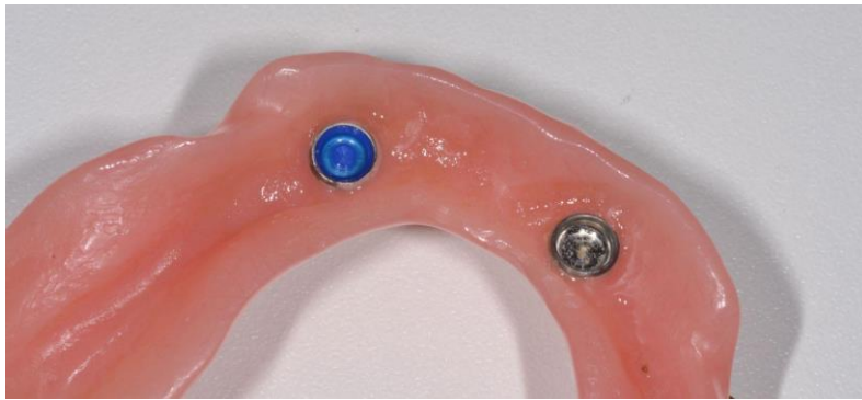
Slika 11. Proteza na kopčanje.

Koncept okluzije koja se preporučuje za pokrovne proteze pričvršćene implantatima je bilateralno balansirana okluzija (127).