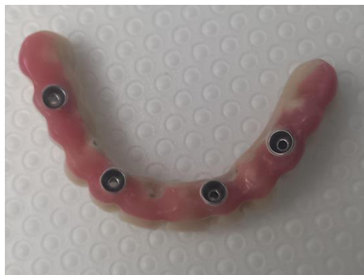
Slika 9. All-on-4.

Kod definitivnog rada “all-on-4” koncepta sugerira se bilateralno balansirana okluzija. Ukoliko je u suprotnoj čeljusti prirodna denticija, sugerira se okluzija vođena očnjakom, a ako je u suprotnoj čeljusti most nošen implantatima, sugerira se grupna funkcija.