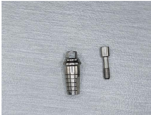
Slika 1. Nadogradnje za pričvršćivanje vijkom