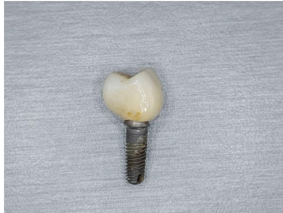
Slika 8. Protetska kruna na implantatu.

Pozitivne karakteristike protetskog nadomjestka pričvršćenog vijkom su mogućnost reparacije ukoliko je potrebno te zdravlje periimplantantnog tkiva.