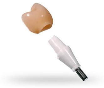
Slika 4. Nadogradnja od cirkonij-oksida keramike.

b.) Cirkonij-oksida keramika izbor je u prednjem području zubnog niza kod pacijenata s tankim biotipom gingive te pacijenata s upitnom oralnom higijenom. Zbog boje pruža bolje estetske rezultate te je biokompatibilna i pruža dobra fizikalna svojstva gdje se očekuju veća funkcijska opterećenja. Smanjuje adheziju plaka i bakterijsku invaziju te se na taj način sprječava upala mekog tkiva oko implantata i resorpcija kosti.