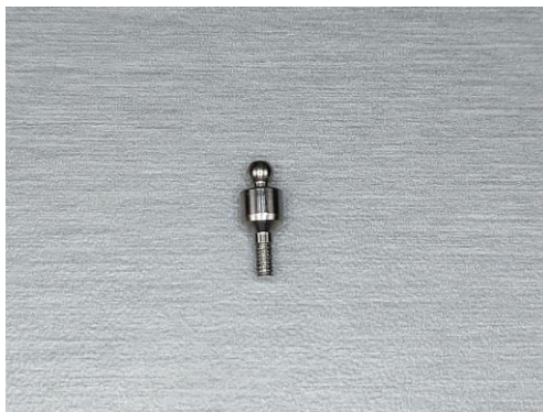
Slika 3. Nadogradnja za retenciju pričvrsnika

Konfekcijske nadogradnje su gotove strojno definirane koje se izravno pričvršćuju na implantat. Laboratorijski se mogu dodatno prilagođavati, ali i intraoralno kako bi se postiglo dobro prilijevanje protetske krune ili protetskog mosta (10). Konfekcijskim nadogradnjama je vrlo zahtjevno postići estetski prihvatljiv izlazni profil mekog tkiva.