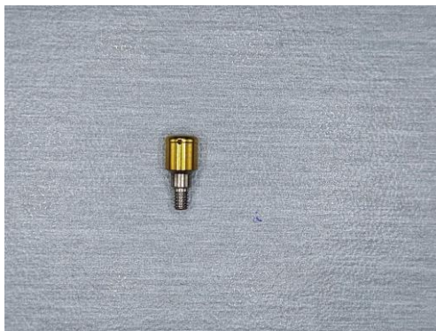
Slika 2. Nadogradnje za retenciju pričvrsnika