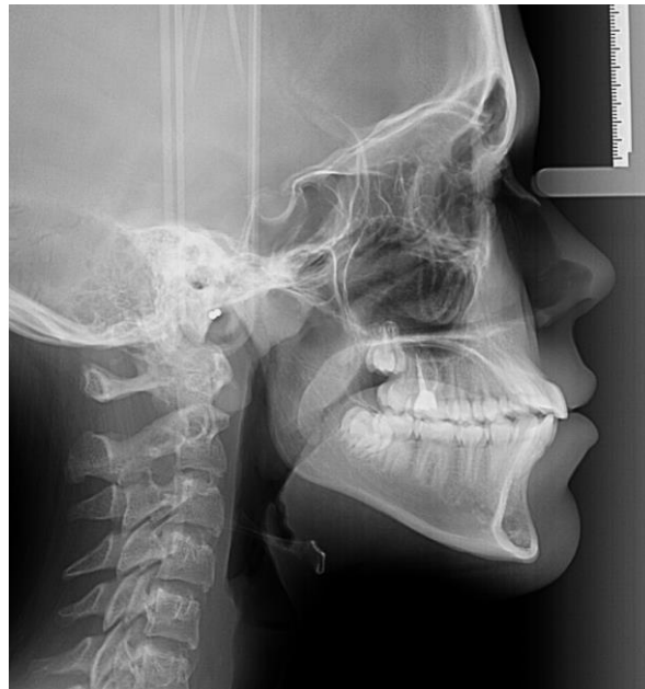
Slika 7. Kefalometrijska radiografija.

Kod planiranja implantoprotetske terapije u ovoj dobnoj skupini potrebno je pratiti rast i razvoj čeljusti koji nije isti za dječake i djevojčice te se ne podudara s kronološkom dobi djeteta. Najpreciznije praćenje je praćenje koštanog rasta metodom uzimanja kefalometrijskih radiografa svakih šest mjeseci.