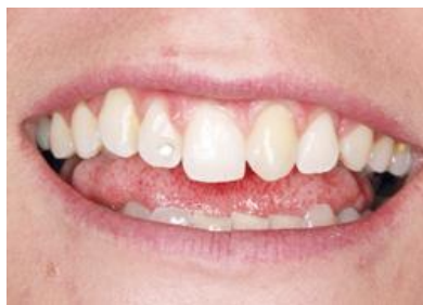
Slika 4. Početna situacija kod pacijentice. Preuzeto: (11)