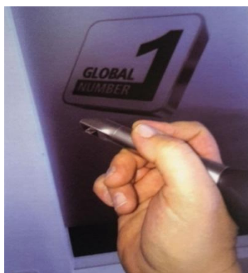
Slika 18. 3D intraoralni skener. Preuzeto: (22)

Govoreći o digitalnim otiscima važno je naglasiti sustave u sklopu kojih se koriste, a to su ordinacijski i laboratorijski sustavi (22). U ordinacijskim digitalnim sustavima kliničar nakon preparacije bataljaka 3D intraoralnim skenerima uzima otiske, zatim slijede faze softverskog dizajna istih te konačno faza glodanja (22). U laboratorijskim sustavima tijek je malo drugačiji. Uzimaju se konvencionalni otisci nakon čega se u tvrdoj sadri izljevaju radni modeli. Modeli se zatim skeniraju te slijedi softverski dizajn restauracije i glodanje (22).