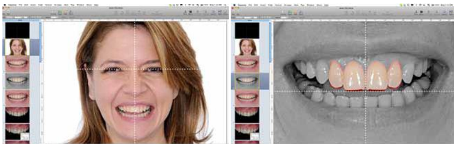
Slika 7. Označavanje bipupilarne i vertikalne linije lica.

softveru se provodi analiza postojećih estetskih parametara i izrađuje se jedan ili više predložaka konačnog izgleda koji se prezentiraju pacijentu. Nakon što se pacijent složi s digitalnim predloškom, prema njemu DT izrađuje precizni voštani predložak istih proporcija. Uz pomoć provizornog materijala, pacijent može u svojim ustima vidjeti, osjetiti i doživjeti svoj budući novi osmijeh koji se može dodatno korigirati kako bi se postigao željeni rezultat (12,13,14).