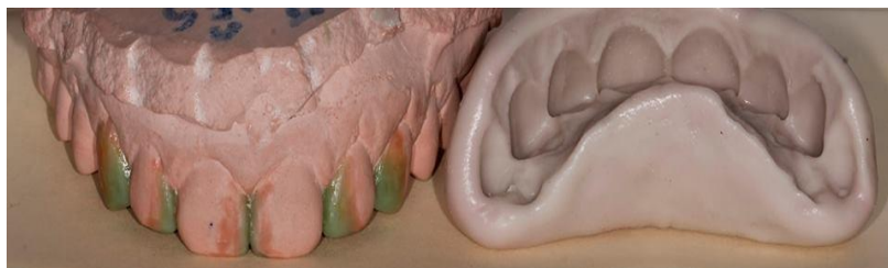
Slika 2. Model s wax up-om. Silikonski ključ.