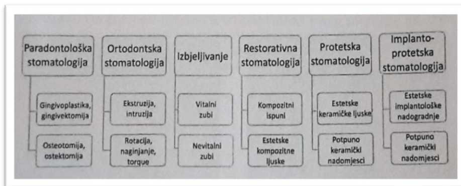
Slika 17. Stomatološke grane i postupci koji su potrebni u postizanju estetskog izgleda pacijenta. Preuzeto: (8)

Svi estetski dentalni postupci mogu se podijeliti u dvije osnovne skupine: pripremne i definitivne (8). U pripremne, iako su u nekim slučajevima i definitivni, pripadaju parodontološki i ortodontski estetski postupci te postupak izbjeljivanja zubi. Njihovo provođenje smatra se neophodnim za izradu definitivnih nadomjestaka, a u svrhu postizanja potpunog sklada u estetskom izgledu pacijenta. Navedeni se postupci smatraju definitivnima ukoliko nakon njihovog provođenja nije potrebno provoditi daljnje zahtjeve, npr. ispravljanje položaja zubi ili gingivne asimetrije u slučaju kada ne postoji niti jedno drugo estetsko odstupanje (8).