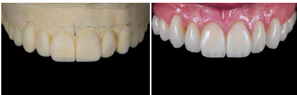
Slika 15. Dijagnostički wax up.