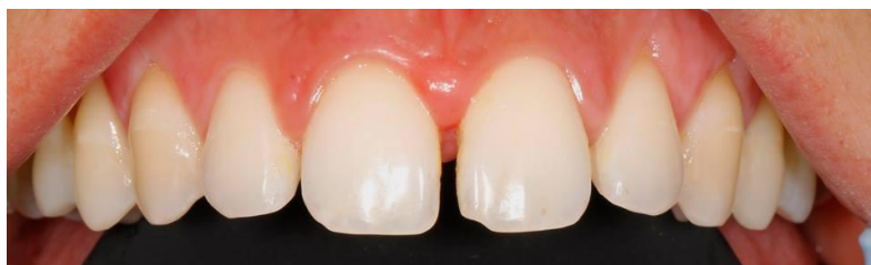
Slika 1. Početna situacija kod pacijentice.

Pomoću wax up-a određuju se najpovoljniji oblik i položaj nadomjeska. Wax up pruža dijagnostičku informaciju koja pomaže pri postavljanju plana terapije u smislu ukazivanja na potrebu za prethodnim endodontskim ili ortodontskim liječenjem, odnosno služi kao vodič za brušenje zubi. Također olakšava odabir vrste nadomjeska obzirom na to da omogućuje procjenu raspoloživog prostora. Isto tako pomaže pri analizi okluzijskih odnosa. Wax up predstavlja trodimenzionalni voštani model koji oponaša željeni oblik zubi nakon terapije. U ovoj fazi modifikacije su moguće do potpunog prihvaćanja predložene terapije (11). Pomoću wax up-a može se izraditi privremeni nadomjestak. Preko modela s wax up-om uzima se otisak silikonom ili napravi kalup od prešane folije. Dobiveni silikonski ključ ili kalup ispune se autopolimerizirajućom smolom ili bisakrilat kompozitom te se postavi preko zuba u ustima. Nakon polimerizacije dobiva se privremeni nadomjestak koji predstavlja prototip definitivnog protetskog rada (11).