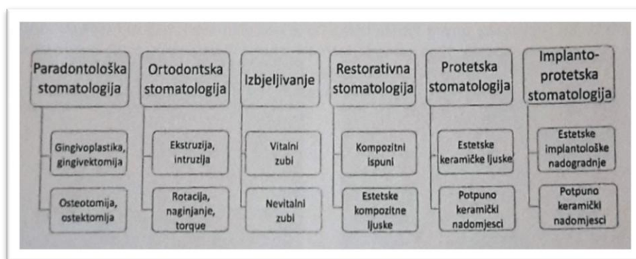
Slika 17. Stomatološke grane i postupci koji su potrebni u postizanju estetskog izgleda pacijenta.

Svi estetski dentalni postupci mogu se podijeliti u dvije osnovne skupine: pripremne i definitivne (8). U pripremne, iako su u nekim slučajevima i definitivni, pripadaju parodontološki i ortodontski estetski postupci te postupak izbjeljivanja zubi. Njihovo provođenje smatra se neophodnim za izradu definitivnih nadomjestaka, a u svrhu postizanja potpunog sklada u estetskom izgledu pacijenta. Navedeni se postupci smatraju definitivnima ukoliko nakon njihovog provođenja nije potrebno provoditi daljnje zahtjeve, npr. ispravljanje položaja zubi ili gingivne asimetrije u slučaju kada ne postoji niti jedno drugo estetsko odstupanje (8).