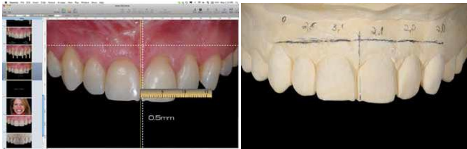
Slika 13. Mjerjenje neskladnosti između središnje linije lica i središnje dentalne linije. Preuzeto: (14)