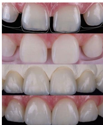
Slika 6. Koraci izrade indirektnog mock up-a.