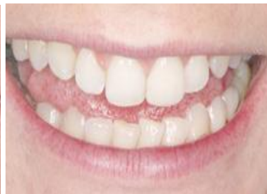
Slika 5. Mock up lijevog središnjeg sjekutića izrađen direktno kompozitnim materijalom. Preuzeto: (11)