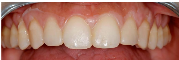
Slika 3. Mock up gornjih prednji zubi dobiven silikonskim ključem ispunjenim autopolimerizirajućom smolom i otisnutim preko zubi.