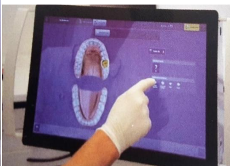
Slika 19. Skeniranje u ustima pacijenta i obilježavanje ruba preparacije. Preuzeto: (22)