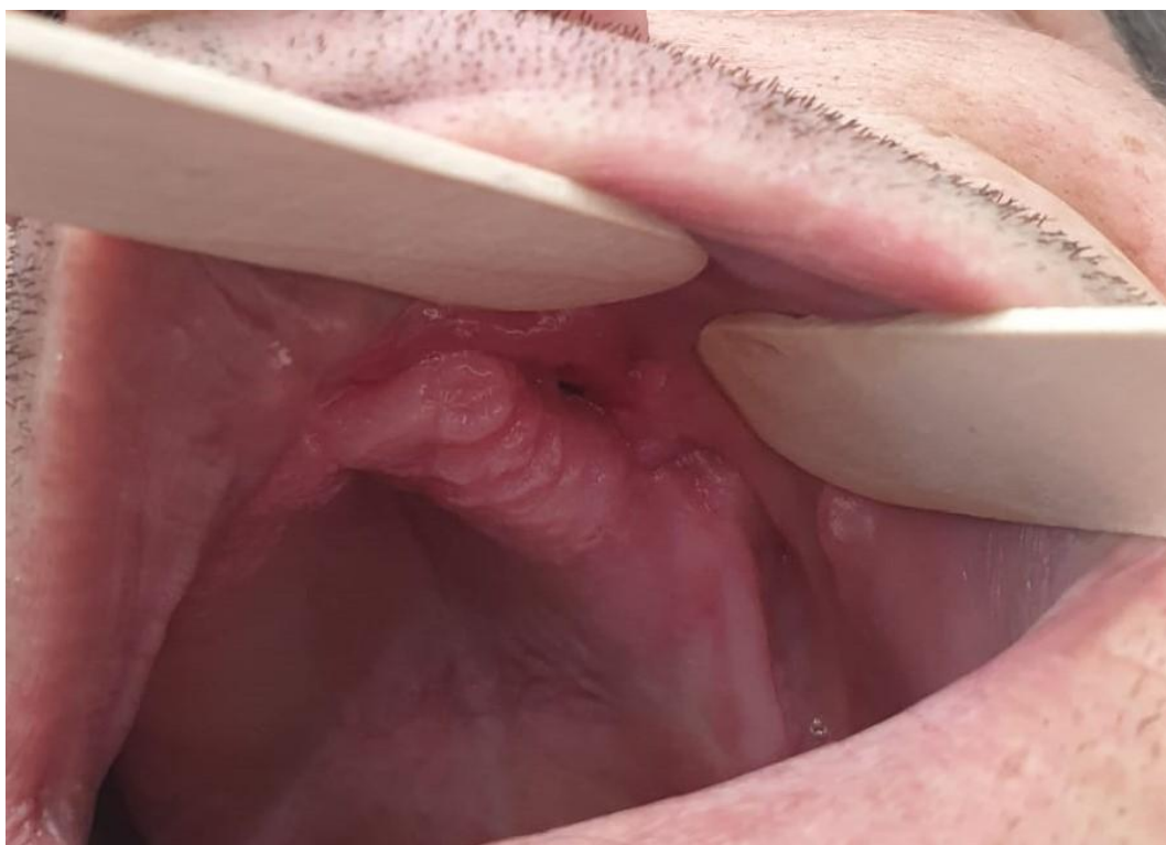
Slika 1. Oroantralna fistula.