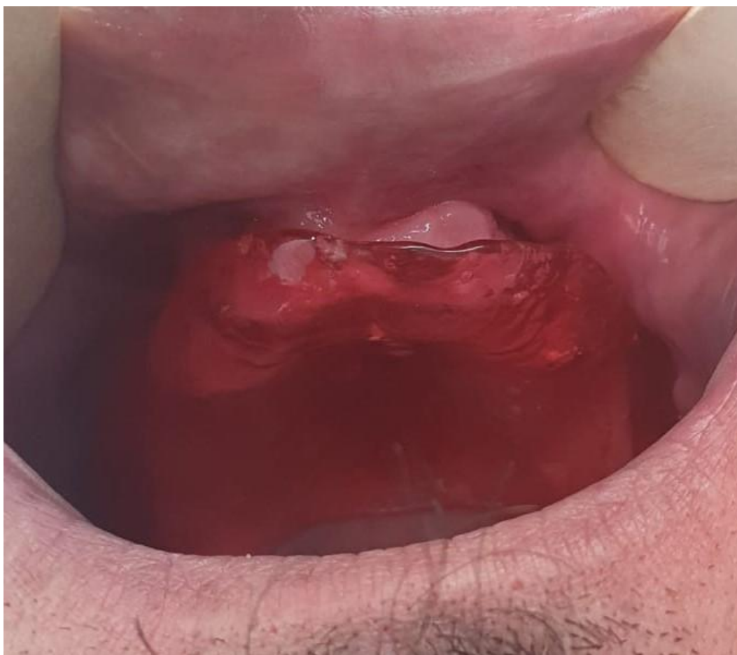
Slika 3. Liječenje oroantralne fistule s palatinalnom pločom.

Dugotrajnim nošenjem palatinalne ploče, uz učestalo ispiranje sinusa fiziološkom otopinom, primjenom antibiotika i ispiranjem antibiotskom otopinom, moguće je smiriti upalu sinusa i postići spontano cijeljenje fistule. Ovom metodom, u nekim slučajevima, moguće je spontano zacjeljenje fistula koje postoje duže od mjesec dana (19).