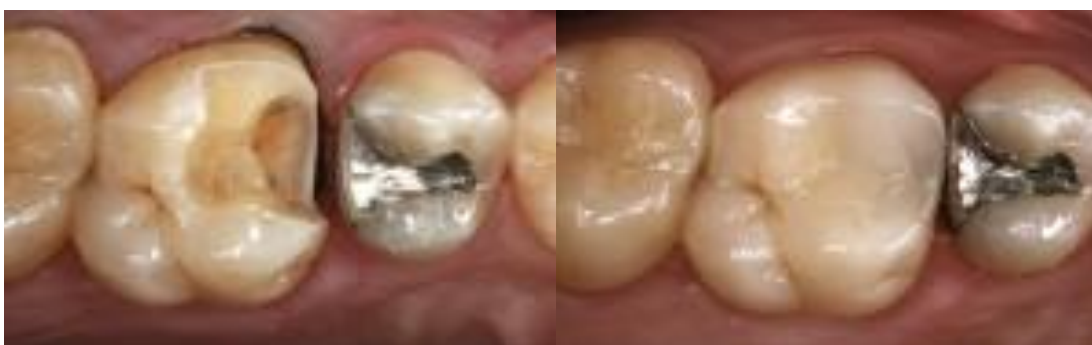
Slika 3. Kavitet za overlay (lijevo) i isti zub nakon opskrbe keramičkim overlayem (desno). Preuzeto: (8)