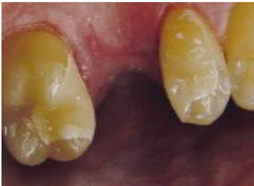
Slika 7. Privremene restauracije na zubima koji su preparirani za inlay. Preuzeto: (9)