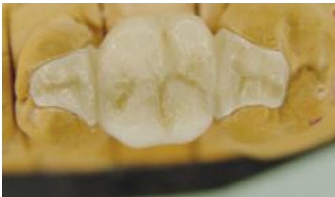
Slika 4. Keramički inlay kao sidro mosta u stražnjem segmentu.

Razlikujemo tri vrste indikacija a to su: estetska, protektivna i protetska (2). Indikacija za estetske indirektno ispune je želja pacijenta za izradom estetskog ispuna, najčešće na lateralnim zubima (estetska), kad širina primarnog okluzalnog kaviteta prelazi širinu polovine okluzalne plohe s tim da bukalna i lingvalna stijenka moraju biti očuvane bez vidljivih pukotina i ispuna (5). Prednost pred direktnim ispunima je svakako duža funkcijska trajnost, njihova bolja mehanička svojstva te, kod onlaya i overlaya, mogućnost zaštite kvržica od pucanja (protektivna). Osim ovih indikacija inlayi se koriste i kao sidra za mostove (protetska indikacija) manjih raspona (slika 4) (1).