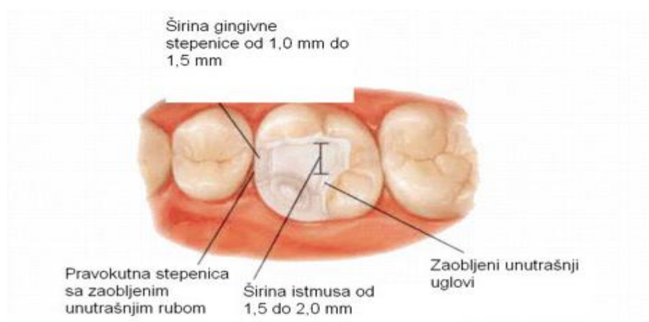
Slika 6. Kavitet za estetski onlay. Preuzeto: (10)

Pri brušenju kvržica za onlay i overlay bitno je da brušene kvržice nisu oštre i da su reducirane 1,5 mm za neradnu i 2 mm za radnu. Vanjski dio brušene kvržice završava pravokutnom stepenicom 1,0 – 1,5 mm (slika 6) (1). Pacijenta treba uvijek opskrbiti privremenim nadomjeskom iz estetskih i funkcijskih razloga te radi kontrole boli, osim kad raspolažemo aparaturom koja omogućuje strojnu izradu nadomjeska u jednom posjetu (2).