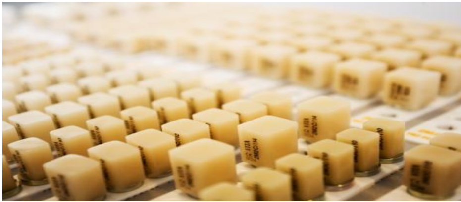
Slika 9. Keramički blokovi za glodanje u CAD-CAM glodavici.

Nakon što smo računalno oblikovali predmet slijedi glodanje. Nakon glodanja se rad dovršava bojanjem (2). Najveća prednost ove metode je svakako ušteda vremena jer nam daje mogućnost da u samo jednom posjetu prepariramo kavitet, oblikujemo i izradimo nadomjestak bez potrebe za otiscima, privremenim restauracijama i laboratorijem. Uz to nam tehnika CAD-CAM-a daje dobru estetiku i trajnost rada. Preparacija za CAD-CAM inlaye je ista kao i za klasične keramičke inlaye (3).