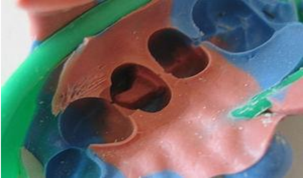
Slika 8. Dvostruki otisak za indirektni ispun. Preuzeto: (11)

Osim otiska čeljusti, u kojoj se izrađuje nadomjestak, potreban nam je i otisak suprotne čeljusti u konfekcijskoj žlici te registriranje međučeljusnih odnosa. Nakon toga izrađuje se glavni (master) model i radni model koji mora biti od supertvrde sadre. Glavni model nam je potreban jer se radni model može pohabati prilikom rada, a ovako na glavnom modelu možemo kontrolirati dosjed.