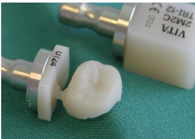
Slika 2. Overlay izrađen CAD-CAM tehnikom. Preuzeto: (7)