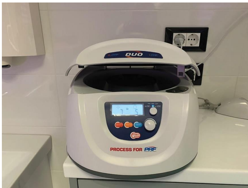
Slika 1. Stolna centrifuga za pripremu PRF-a

PRF razvijen od strane Choukrouna i sur., takozvani L-PRF (engl. leukocyte PRF ) centrifugiran je na višim vrijednostima okretaja u minuti. Istraživanjima je ustanovljeno da će smanjenje broja okretaja centrifugiranja dovesti do povećanja broja stanica i pod tom pretpostavkom razvijen je A-PRF (engl. advanced PRF ). A-PRF protokol odvija se pri otprilike 1500 okretaja u minuti tijekom 14 minuta. Upotrebom ovog protokola utvrđen je povećan broj trombocita, limfocita i neutrofila što dovodi i do povećane diferencijacije makrofaga koji su odgovorni i za diferencijaciju osteoblasta. Još jedna vrsta PRF-a je I-PRF ili injekcijski PRF. Za razliku od PRP-a koji postoji i u obliku tekućine, PRF je postojao isključivo u obliku gela iz čega proizlazi da se nije mogao injicirati. I-PRF centrifugira se na 700 okretaja u minuti tijekom 3 minute. Koriste se plastične epruvete koje ne dovode do aktivnog procesa koagulacije što omogućuje da se nakon nekoliko minuta centrifugiranja PRF lako aspirira i primjenjuje injiciranjem (20).