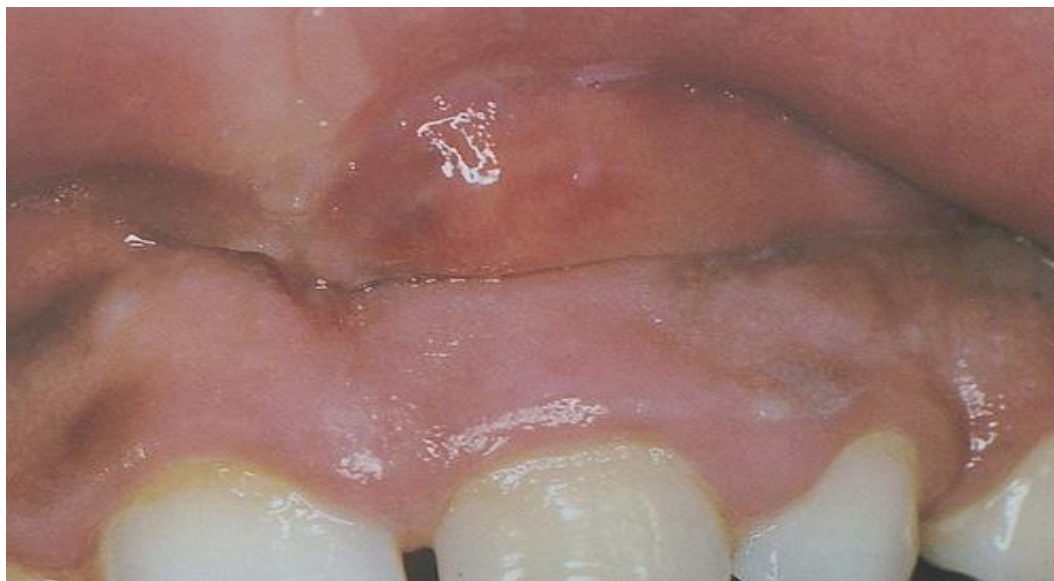
Slika 4. Slika apscesa.

Etiologija: Akutni apikalni absces (Slika 4) lokalizirana je ili difuzna likvefakcijska lezija koja razara periradikularna tkiva, a jak je upalni odgovor na bakterijske i nebakterijske iritacije nekrotične pulpe.