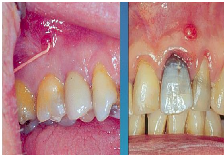
Slika 4. Kronični apikalni apsces s fistulom.

Simptomatologija: Za ovakve je apscese karakteristično da su asimptomatski jer se nastali gnoj može prazniti (drenirati) kroz sinus trakt, odnosno, fistulu, osim ako dođe do začepljenja puta drenaže – fistule, kada nastaje bol. Fistula je vrlo tvrdokorna jer je djelomično ili potpuno građena od epitela okruženog upalnim vezivom. Klinički, radiografski i histološki nalaz odgovara onom kod kroničnog apikalnog parodontitisa (2).