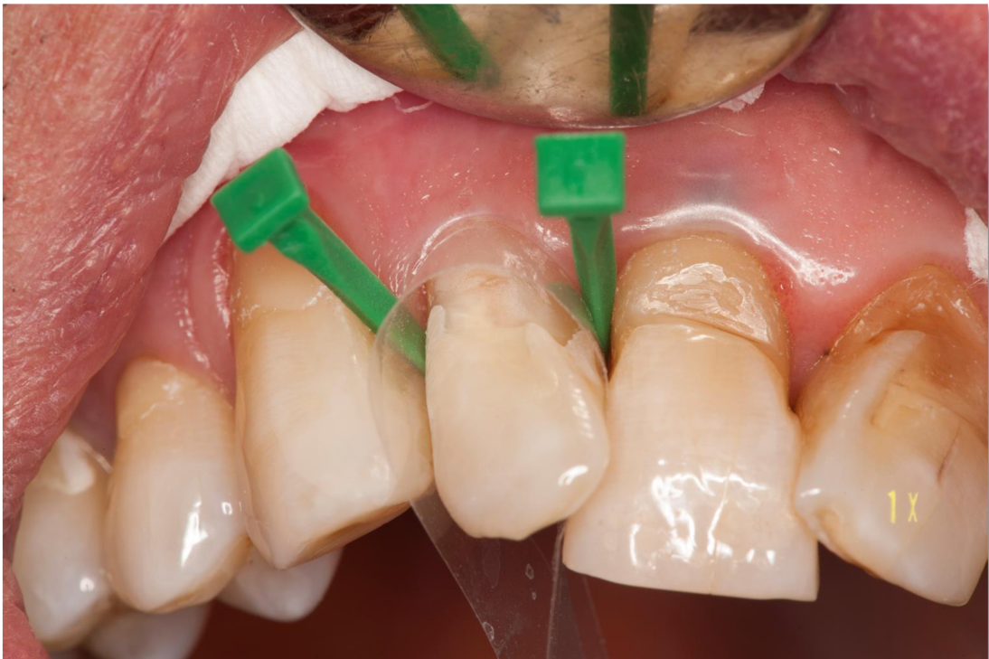
Slika 9. Izgled lezije nakon jetkanja cakline fosfornom kiselinom, ispiranja i sušnja zrakom.

Kompozitnim materijalima postižu se izvrsni estetski rezultati. I tekući kompoziti i giomeri i kompozitni materijali zahtijevaju suho radno polje što se u restauraciji cervikalnih lezija može postići uporabom celuloidnih traka. Klinički postupak restoracije cervikalnih lezija kompozitom prikazan je na slikama 9-13., a isti klinički postupak se primjenjuje u restoraciji cervikalnih lezija giomerima.