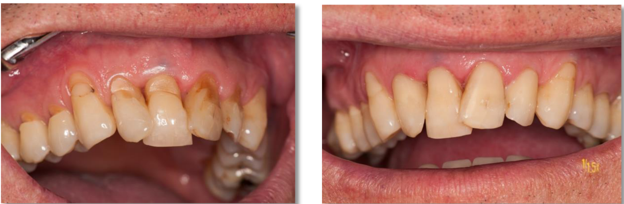
Slika 13. Izgled lezija prije i nakon restauracije.

Kod jako opsežnih lezija gdje postoji veće oštećenje vestibularnih ili oralnih ploha i snižena vertikalna dimezija zubi (erozija, abrazija) porebna je opsežnija protetska rekonstrukcija. Mogu se izraditi oralne i vestibularne keramičke ljuskice, okluzalni keramički čipsevi, inley, onley, ili klasična protetska rehabilitacija krunicama.