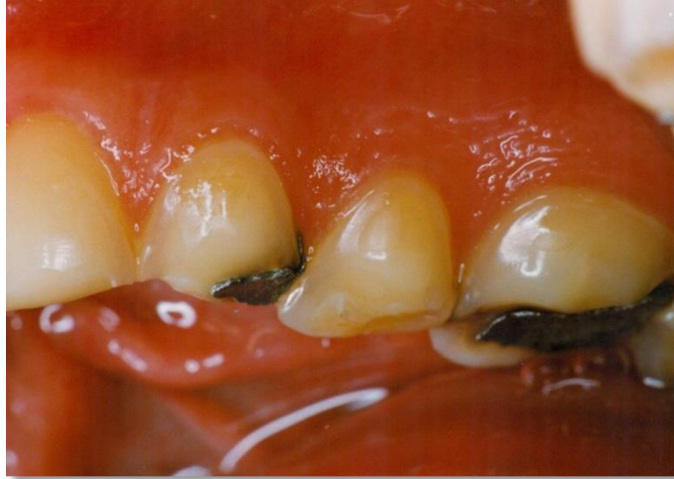
Slika 4. Sjajni izgled bukalnih ploha zuba i stršeći amalgamski ispuni što se u literaturi opisuje kao "rocky islands".