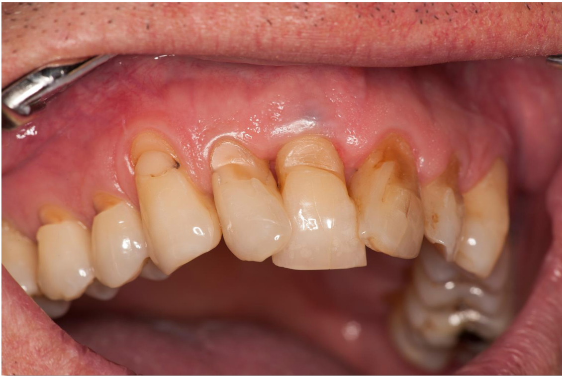
Slika 7. Klinički izgled nekarijesnih cervikalnih lezija. Na pojedinim zubima lezije zahvaćaju i korijen zuba zbog recesije gingive i posljedičnog produljenja kliničke krune.