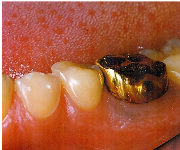
Slika 5. Nesrazmjer u veličini zlatne krunice i okolnih erodiranih zubi koji su cjelini smanjeni.