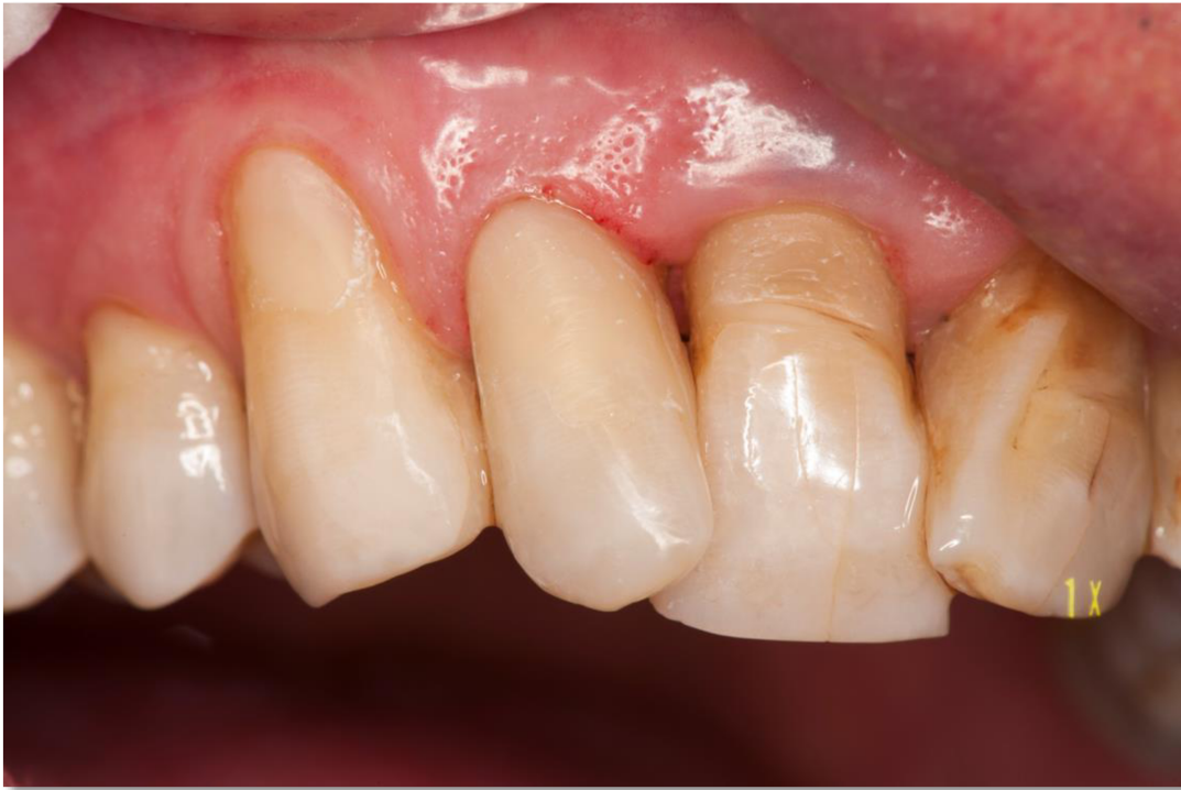
Slika 12 . Nekarijesna cerviksna lezija na zubu 22 restaurirana kompozitnim materijalom.