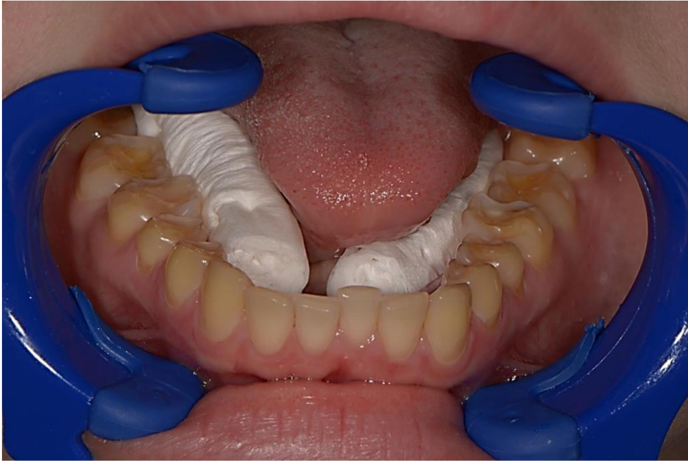
Slika 2. Erozija na donjim zubima. Na bočnim zubima dominira žuta boja dentina Zbog gubitaka okluzalne cakline.