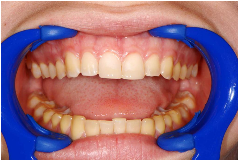
Slika 1. Generalizirana erozija. Vestibularne plohe gornjih prednjih zubi restaurirane su kompozitnim materijalom.