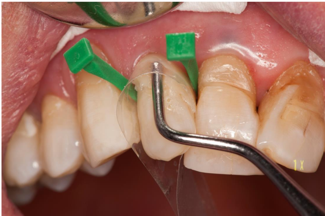
Slika 11. Unošenje i adaptacija kompozitnog materijala. Ako je dubina lezije veća od 2 mm potrebna je slojevita tehnika rada.