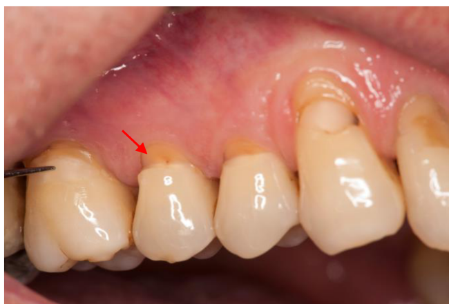
Slika 8 . Cervikalne lezije na bočnim zubima. Na drugom pretkutnjaku oštećenje seže do pulpe.