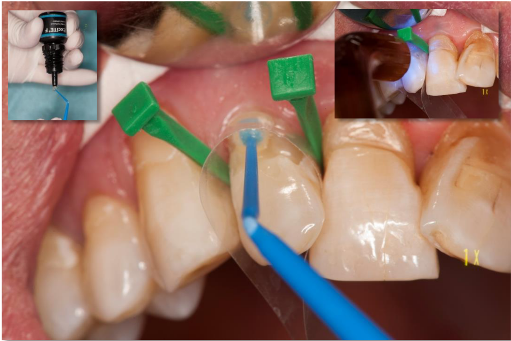
Slika 10. Nanošenje i polimerizacija adhezivnog sredstva.