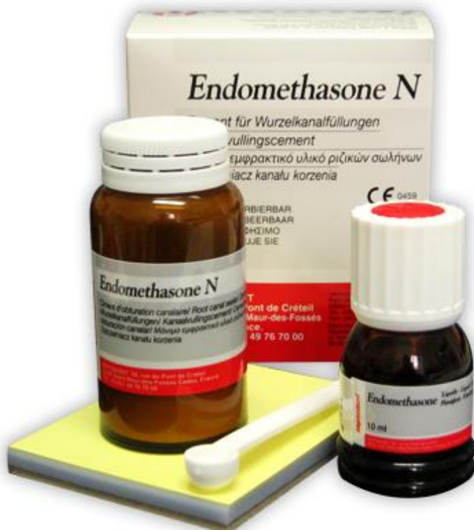
Slika 4. Endometasone. Preuzeto iz: (24).