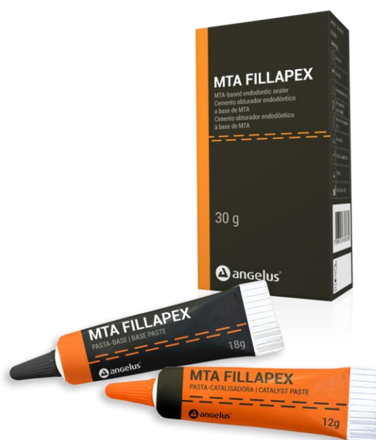
Slika 5. MTA Fillapex. Preuzeto iz: (32).

prisutnost vlage tijekom stvrdnjavanja. Prednosti MTA su: biokompatibilnost i poticanje remineralizacije (27), poticanje diferencijacije i migracije odontoblasta (28), antimikrobna aktivnost zbog viske pH vrijednosti (29) te poticanje stvaranja hidroksilapatita (30), reparacije i regeneracije parodontalnog ligamenta (31).