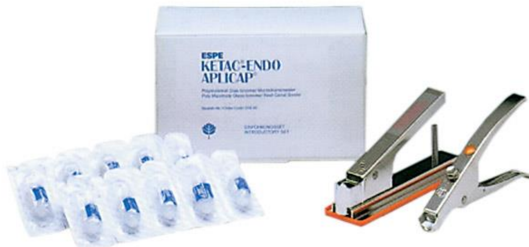
Slika 3. Ketac-Endo. Preuzeto iz: (22).