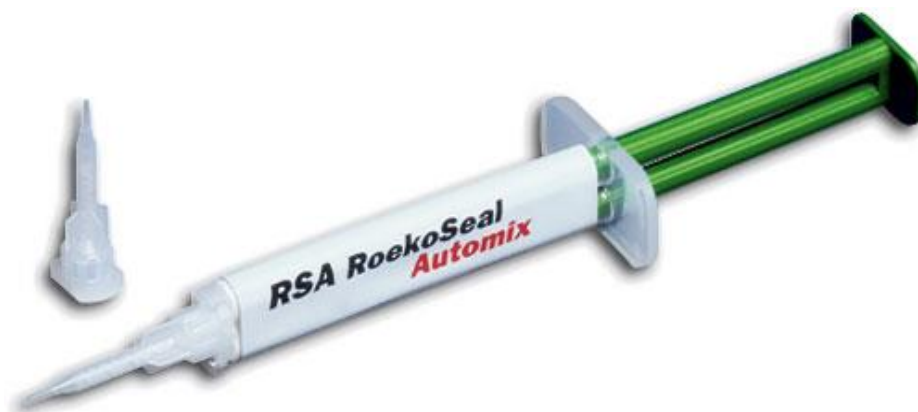
Slika 7. RoekoSeal. Preuzeto iz: (37).