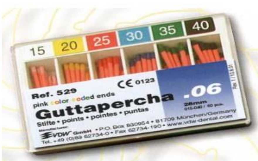
Slika 9. Gutaperka. Preuzeto iz: (39).

kao antiseptični ulošci između dvije posjete (4). Nedostaci gutaperke su mala čvrstoća i slaba adhezija. Kada se rabe u kombinaciji s cementom, gotovo su idealni materijal za punjenje korijenskog kanala.