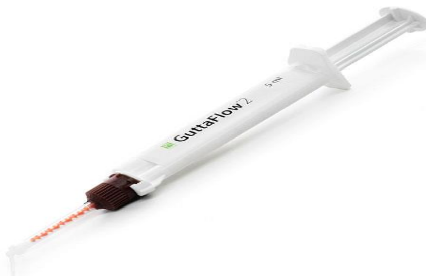
Slika 8. GuttaFlow. Preuzeto iz: (38).