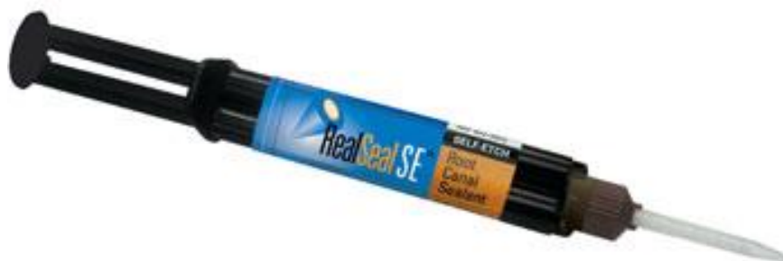
Slika 2. RealSeal SE. Preuzeto iz: (19).

MetaSeal SE) uopće ne rabe adhezijski sustavi jer su kompozitne smole ove generacije samoadhezivne (18).