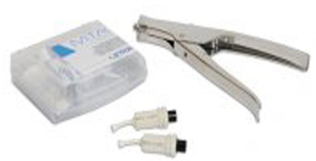
Slika 12. MTA Caps. Preuzeto iz: (47).

tekućinama (45). Biodentin (slika 12.) je materijal temeljen na kalcij silikatu kojeg odlikuju brzo stvrdnjavanje i jednostavno rukovanje (45). Biokeramički materijali (slika 13.) su biokompatibilni, radiokontrastni, bioaktivni, induciraju reparaciju i regeneraciju parodontnih tkiva, imaju visoku pH vrijednost te djeluju antimikrobno (46).