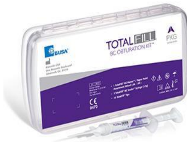
Slika 14. Totafill. Preuzeto iz: (49).