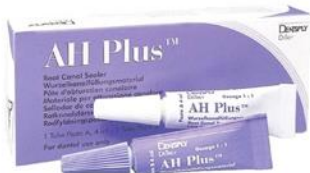
Slika 1. AH Plus.

Kompozitne smole mogu se podijeliti u četiri generacije obzirom na kronologiju pojave tih materijala na tržištu, a njihova je prednost stvaranje monobloka u korijenskom kanalu ukoliko se kombiniraju s Resilon ili EndoREZ štapićima. Predstavnik prve generacije kompozitnih smola kao punila je Hydron. Materijal je bio temeljen na poliHEMA i zbog svog sastava bio je hidrofilan (15). Međutim, spomenuti materijal uzrokovao je upalu (16) i imao je loša fizičko-mehanička svojstva (17) te se ova generacija kompozitnih smola više ne koristi. Druga generacija kompozitnih smola (npr. EndoRez) također je bila hidrofilna i nije zahtijevala uporabu adhezijskih sustava (18). Kod treće generacije kompozitnih smola (npr. RealSeal, Epiphany, Fibrefill) rabili su se dvokomponentni samojetkajući adhezijski sustavi dok se kod četvrte generacije (npr. RealSeal SE (slika 2.),