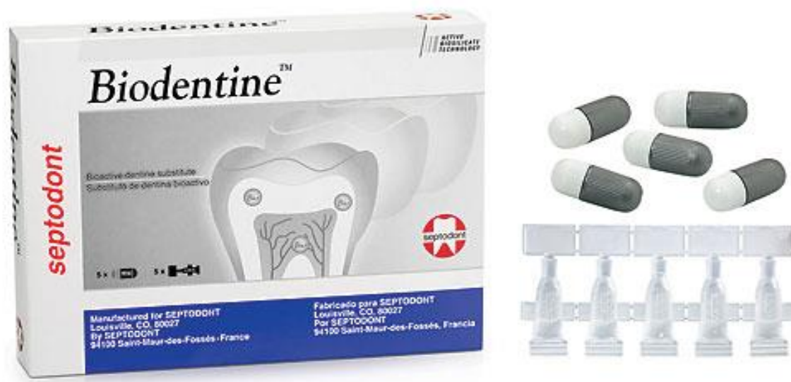
Slika 13. Biodentin. Preuzeto iz: (48).