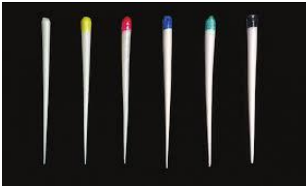
Slika 10. Resilon štapići. Preuzeto iz: (41).