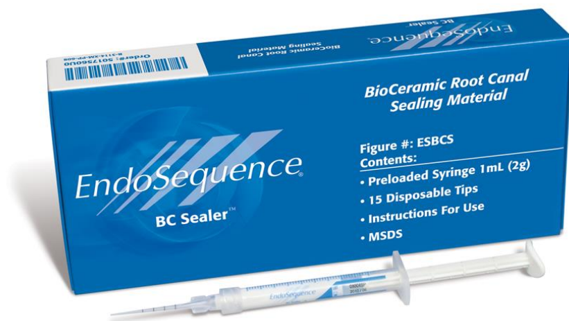
Slika 6. Endosequence. Preuzeto iz: (34).

materijala su antibakterijsko djelovanje te kemijska veza s dentinom koju ostvaruju stvarajući kristale hidroksiapatita (33).