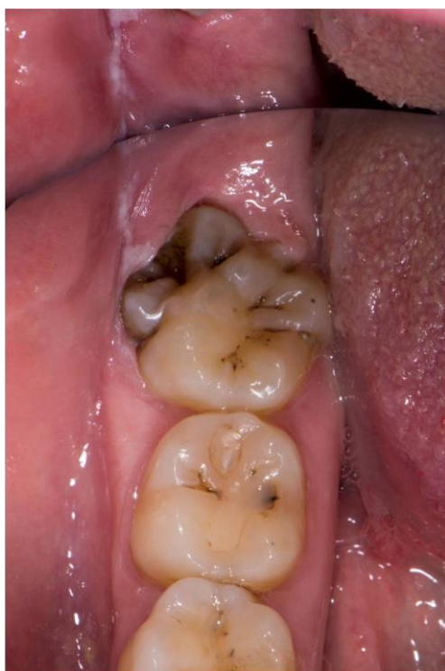
Slika 6. Zub 38 sa šest kvržica na okluzalnoj plohi i tri prekobrojne kvržice, srednja je prekrivena gingivom.

Zub 38 je iznimno velike krune i razvedene morfologije sa šest kvržica na okluzalnoj plohi. Distobukalno se nastavljaju tri iznimno velike prekobrojne kvržice, od kojih srednju prekriva obrazna sluznica (slika 6). Na ortopantomogramu se razaznaju dva korijena ali se ne može sa sigurnošću isključiti treći, prekobrojni korijen (slika 7).