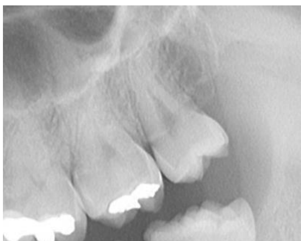
Slika 5. Detalj ortopantomograma: zub 28 normalne morfologije s piramidnim oblikom korijena.