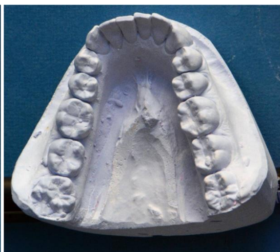
Slika 12. Sadreni model donje čeljusti. Prvi i drugi kutnjaci sa šest odnosno pet kvržica na griznoj plohi.