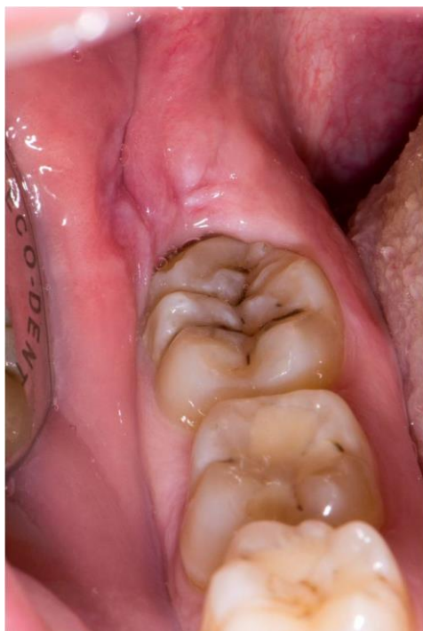
Slika 8. Zub 48 sa šest kvržica na griznoj plohi. Dvije prekobrojne kvržice distobukalno prekriva obrazna sluznica.