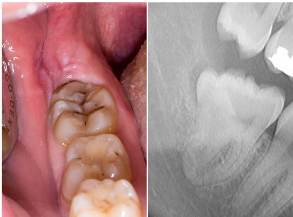
Slika 8. Zub 48 sa šest kvržica na griznoj plohi. Dvije prekobrojne kvržice distobukalno prekriva obrazna sluznica.