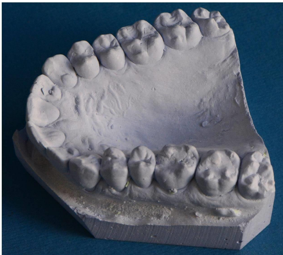
Slika 10. Sadreni model gornje čeljusti. Izraženo je Carabellijevo obilježje na prvim i drugim kutnjacima.