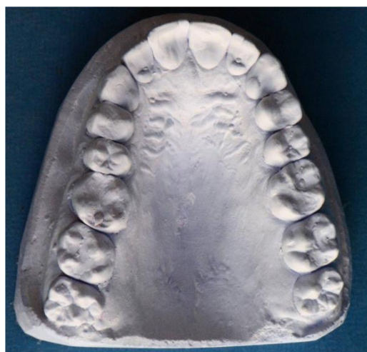
Slika 11. Sadreni model gornje čeljusti.