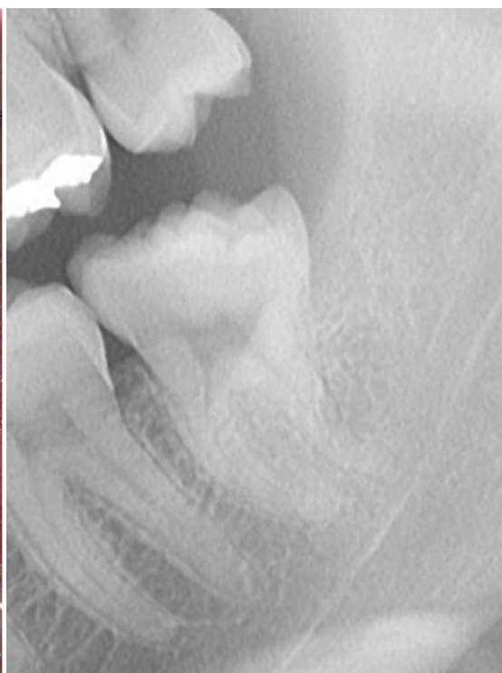
Slika 7. Detalj ortopantomograma: 38 s dva ali moguće i tri korijena.

Zub 48 ima razvedenu morfologiju sa šest kvržica na griznoj plohi. Tek sondiranjem ispod obrazne sluznice može se ustanoviti dodatni dio krune zuba s dvije velike prekobrojne kvržice smještene distobukalno (slika 8). Na ortopantomogramu se vide prekobrojne kvržice i uvećan (proširen) distalni korijen (slika 9).