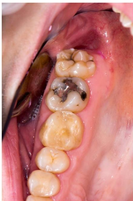
Slika 2. Zub 18 s dvije palatinalno smještene prekobrojne kvržice.

Iz nalaza na pregledu te analize fotografija, modela i ortopantomograma nađeno je sljedeće. Zub 18 pokazuje atipičnu morfologiju krune s pet kvržica na griznoj plohi i dvije prekobrojne kvržice smještene palatinalno (slika 2), dok je na