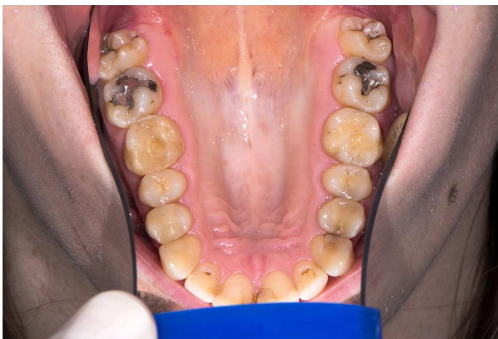
Slika 4. Gornji zubni luk okluzalno. Vidljiva normalna morfologija zuba 28 i promijenjena morfologija zuba 18 s dvije prokobrajne palatinalno smještene kvržice.

ortopantomogramu vidljiva normalna morfologija korjenova (slika 3). Zub 28 pokazuje tipičnu morfologiju gornjih kutnjaka s četiri kvržice na griznoj plohi i sustavom brazdi u obliku slova "H" te piramidnim oblikom korijena (slike 4 i 5).