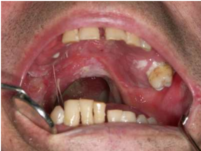
Slika 1. Oralni mukozitis.

Mukozitis je bolna, ulcerozna upala koja nastaje uslijed citotoksičnog učinka kemoterapije i radioterapije (Slika 1). Klinički se očituje kao eritem i upala koja se pojavljuje na sluznici ždrijela i usne šupljine. Rani klinički znak je zamućeni, bjelkasti izgled sluznice koji se pojavljuje na kraju prvog tjedna terapije. Potom u trećem tjednu nastaju ulceracije koje su praćene jakim bolovima, zbog čega je nekim bolesnicima potrebna parenteralna prehrana (8).