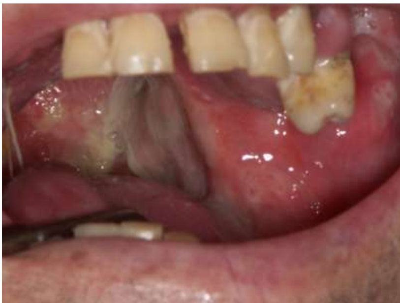
Slika 3. Stadij ulceracije oralnog mukozitisa.

Kliničke manifestacije oralnog mukozitisa zamjetne su u četvrtom stadiju upalnog procesa, a to je stadij ulceracije (Slika 3). Tijekom te faze narušen je integritet mukoze i submukoze te se pacijenti žale na bol i potrebna im je terapija (10). Lakši je prodor mikroorganizama kroz oštećenu sluznicu, oni invadiraju tkivo te uzrokuju upalni odgovor i stvaranje novih proupalnih citokina, pojačavanje ekspresije proapoptičkih medijatora i jače oštećenje tkiva (10).