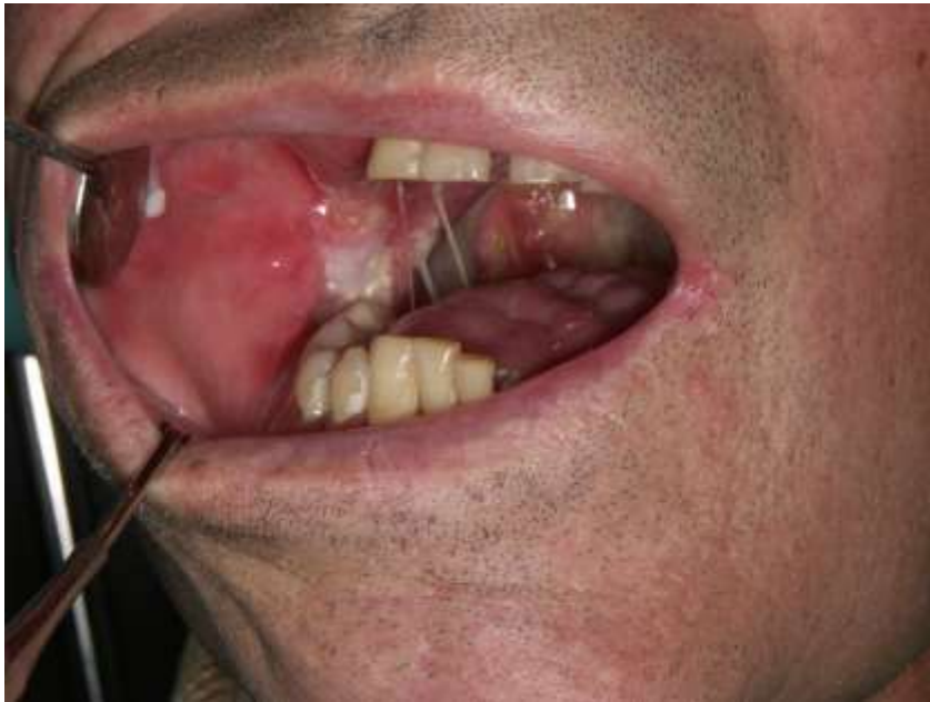
Slika 2. Oralni mukozitis - crvenilo i upala na sluznici usne šupljine i ždrijela.

Dijagnoza oralnog mukozitisa postavlja se na temelju anamneze i kliničkog pregleda. Promjene koje ukazuju na pojavu oralnog mukozitisa očituju se kao crvenilo i upala na sluznici usne šupljine i ždrijela, a potom su vidljive i ulceracije (Slika 2). Kod osoba koje primaju kombinaciju radioterapije i kemoterapije javlja se teži oblik bolesti (8).