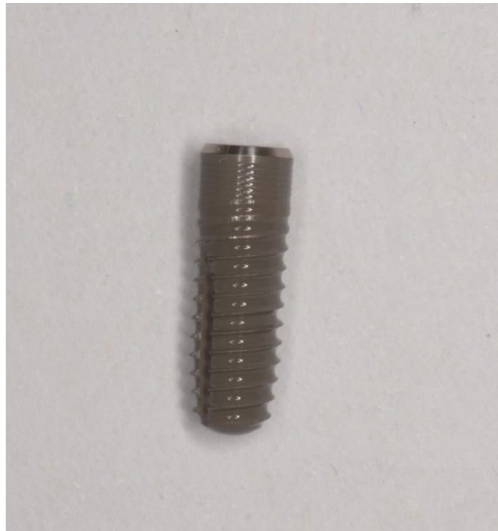
Slika 1. Makromorfologija titanskog dentalnog implantata

Svojstvo koje osigurava preciznu implantaciju, primarnu stabilnost implantata i pravilno usmjeravanje sila unutar kosti jest njegova makrostruktura. Ona se odnosi na dio endosealnog implantata koji se nalazi unutar alveolarne kosti i izgleda poput vijka, bio on paralelnih stijenki ili konusnog oblika (5).