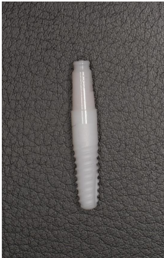
Slika 2. Dentalni implantat od cirkonij-oksidge keramike

Postoje tri alotropske modifikacije cirkonijevog-oksida: monoklinski, kubični i tetragonski. Pri sobnoj temperaturi cirkonij-oxid nalazi se u monoklinskom obliku koji je stabilan sve do 1170°C. Međutim, pri temperaturi od 1170°C prelazi u tetragonski oblik, prilikom čega mu se volumen smanji za otprilike 5%. Daljnjim povišenjem temperature do 2370°C tetragonski oblik cirkonij-oksida prelazi u kubični. Međutim, tijekom hlađenja, cirkonij-oxid postaje izrazito nestabilan. Razlog tomu jest povećanje volumena 3 do 4% koje uzrokuje nastanak mikrofraktura. Time drastično gubi mehanička svojstva (31).