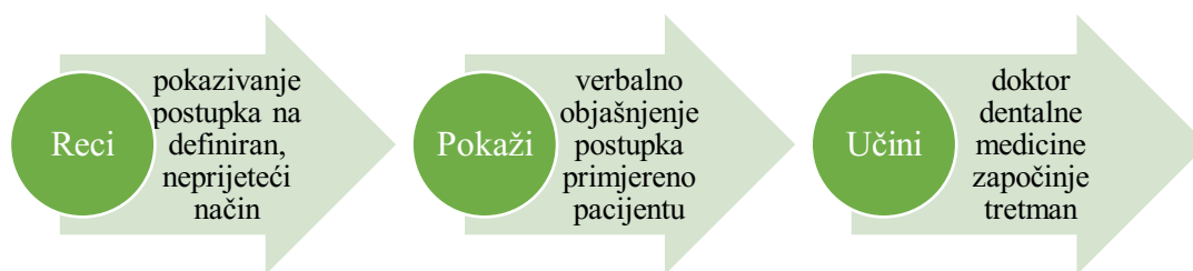
Slika 2. Grafički prikaz tehnike „reci – pokaži – učini“.

Stariji ljudi cijene pristojan i prijateljski pristup. Potrebno je odvojiti dovoljno vremena kako bi im se objasnio tijek liječenja (40). Metoda koja se u literaturi najčešće izdvaja je metoda „reci-pokaži-učini“ (engl. tell-show-do ) (slika 2.). Tehnika „reci-pokaži-učini“ izvrstan je način uspostavljanja odnosa jer je interaktivan i komunikativan pristup. Korisna je jer smanjuje strah od nedostatka kontrole – jednog od najčešćih stomatoloških strahova. Faza „reci“ uključuje verbalno objašnjenje postupka primjereno pacijentu. U fazi „pokaži“ slijedi pokazivanje postupka na definiran, neprijeteći način i konačno, u fazi „učini“ doktor dentalne medicine započinje tretman bez odstupanja od objašnjenja i demonstracije tijekom trajanja postupka. Komunikacija između doktora dentalne medicine i pacijenta ključna je za produktivan odnos koji rezultira kompetentnom kliničkom skrbi (43, 44). Također, uklanjanje stresnih čimbenika kao što su buka stomatoloških uređaja osiguravanjem čepića za uši ili korištenjem terapijskih postupaka bez bučnih uređaja te smanjivanje vremena čekanja pospješuju ugodnost posjeta doktoru dentalne medicine (40).