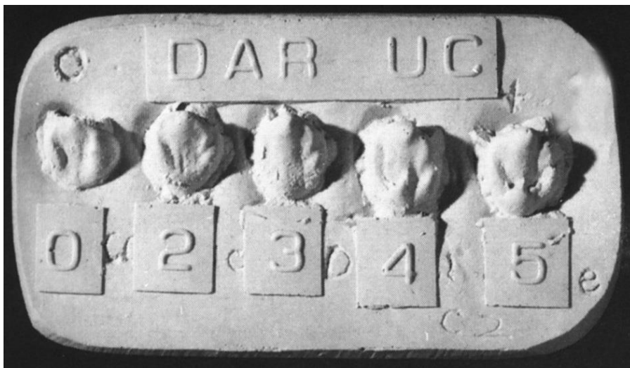
Slika 2. Pločica prekobrojni distalni greben, preuzeto iz (32)

Istraživanje na populaciji južne Indije pokazalo je da je nedostatak pete, distobukalne kvržice, na mandibularnom prvom molaru češće u žena s učestalošću od 40.6%, dok kod muškaraca učestalost iznosi 16.2%. Pretpostavlja se da je ova pojava odraz evolucijskih promjena, koje se očituju u redukciji tvrdog zubnog tkiva, a kod muškaraca, pretpostavlja se, te se promjene sporije odvijaju (22).