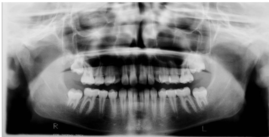
Slika 3. Ortopantomogram, snimljen pri prvom pregledu pacijentice. Vidi se nedostatak zametaka gornjih trajnih očnjaka.

U dobi od 17 godina, pacijentica dolazi na redoviti pregled. Intraoralnim pregledom utvrđeno je da pacijentica i dalje ima gornje mliječne očnjake (slike 4a-c). Središnja dijastema je također bila prisutna, ali reducirana na 0.5mm. Kontrolni ortopantomogram je pokazao prisutnost sva četiri zametka trajnih trećih kutnjaka (slika 5) (37).