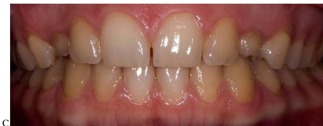
Slika 4. a-c Pacijentica u dobi od 17 godina ima perzistentne mliječne očnjake.