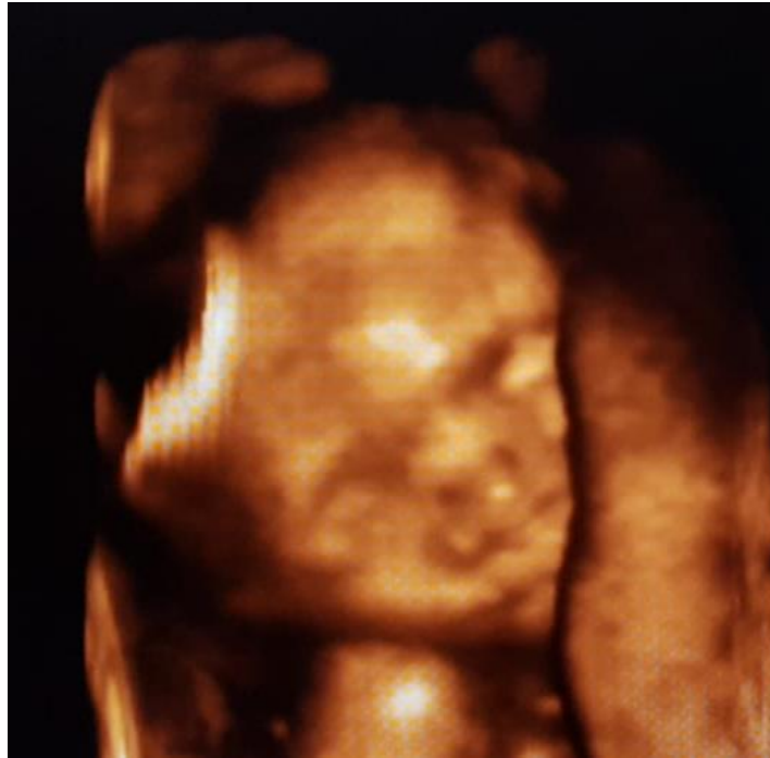
Slika 3. Fotografija 4D ultrazvuka zdravog djeteta na kojoj se vidi da nema rascjepa