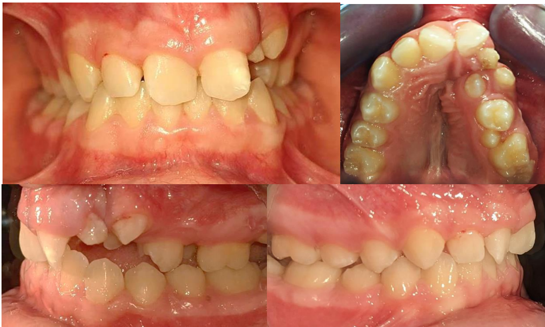
Slika 2. Intraoralne fotografije jednostranog rascjepa alveolarnog grebena na lijevoj strani

Uvula bifida često je znak postojanja submukoznog rascjepa nepca u kojemu je nazalni i oralni sloj sluznice normalan, međutim, postoji prekid kontinuiteta mišićnog sloja. Stoga, ukoliko dijete ima nazalan govor, a nema klinički vidljivog rascjepa, treba posumnjati na submukozni rascjep (2).