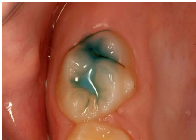
Slika 6. Jetkanje.

i tehnika mikroabrazije zrakom koja čisti organski sadržaj jamica i fisura prije samog pečačenja (14). Preventivnom restauracijom se odstranjuje meko karijesno tkivo u dijelovima fisura, s minimalnim gubitkom čvrstog tkiva, a to uključuje prevenciju i zaustavljanje karijesa u ostatku fisura, aplikacijom restaurativnog materijala i pečatnog materijala koji prekriva sve dijelove fisura (4). Sredstvo za pečačenje stavlja se preko polimeriziranog materijala i preko preostalih fisura, kao zaštita od nastanka karijesa te štiti kompozitni ispun od abrazije (13).