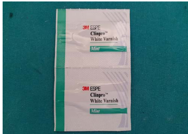
Slika 13. Fluoridni lak Clinpro White Varnish.