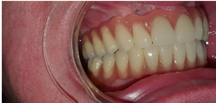
Slika 19. Završni rad lateralno desno