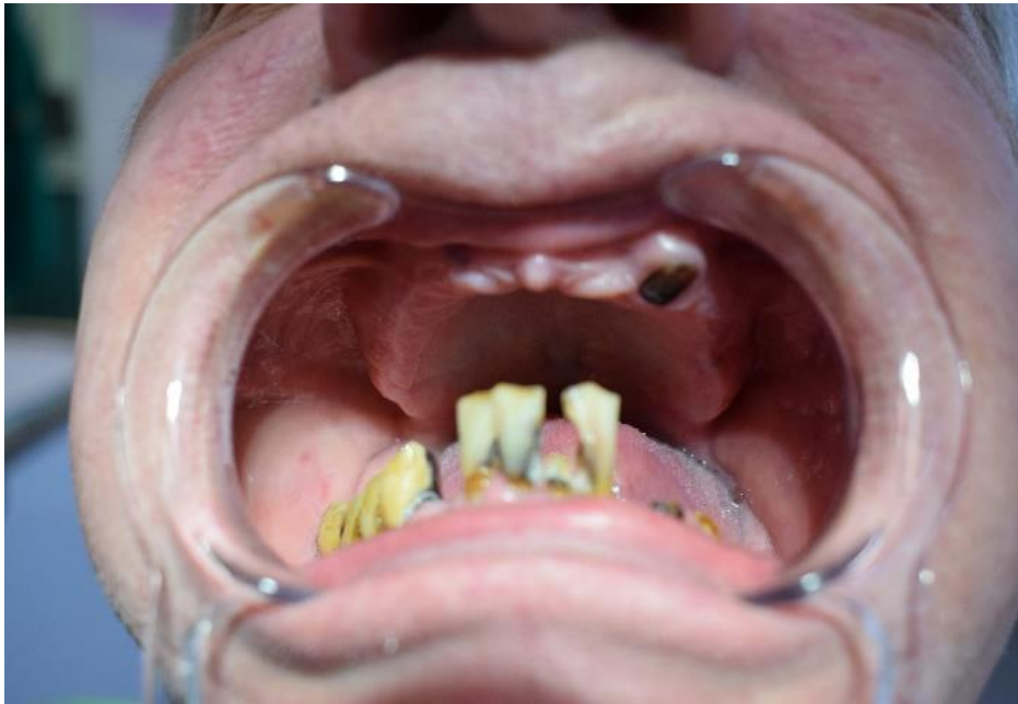
Slika 2. Prikaz početne situacije kod pacijenta gore