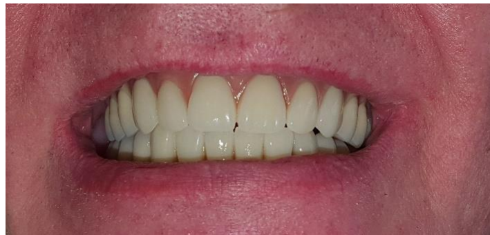
Slika 20. Završni rad

Pacijent je završen i zadovoljan krajnjim ishodom terapije. Bude li se sve odvijalo po planu, pacijent nam se dužan jednom godišnje javiti na kontrolni pregled te čišćenje protetskog rada tj. poliranje u dentalnom laboratoriju, a sve u svrhu kako bi što duže ostao besprijekoran.