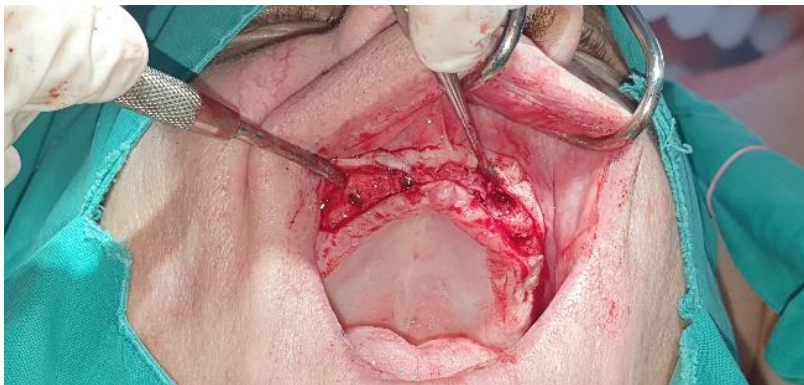
Slika 6. Situacija nakon ugradnje implantata u gornjoj čeljusti