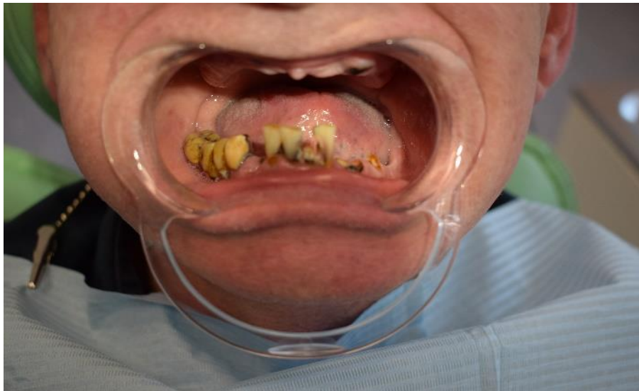
Slika 1. Prikaz početne situacije kod pacijenta dolje

Kliničkim i radiološkim (OPT-ortopanogramom, RVG-radiovizografija, CBCT- cone beam computer tomography ) pregledom utvrđuje se gubitak velikog broja zubi, zaostali korjenovi, loše stanje preostalih zubi te brojne upale sluznice. Detaljno se izmjerio BOP (krvarenje pri sondiranju), PPD (parodontna dubina sondiranja), PL (plak indeks).