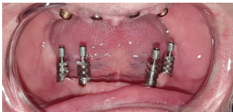
Slika 16. Transferi za otisak u donjoj čeljusti