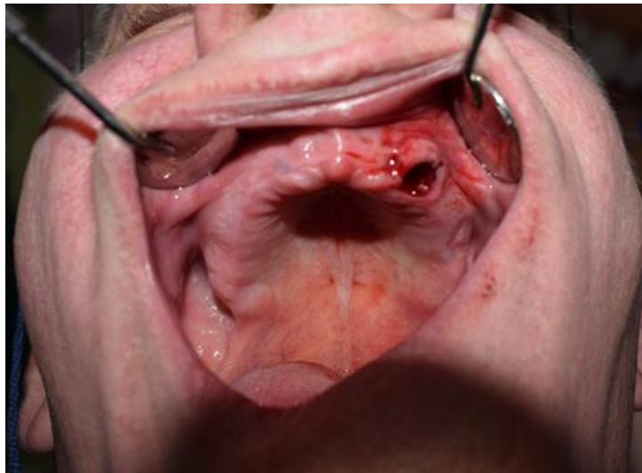
Slika 4. Stanje nakon vađenja zuba u gornjoj čeljusti

Zbog dugogodišnjeg zanemarivanja zubi okolno tkivo oko zuba bilo je poprilično upaljeno, a zubi su bili i poprilično klimavi. Nakon vađenja dobro smo počistili alveole zubi kohleom kako bi izvadili sav upalni sadržaj, zagladili kost Ljerovim kliještima da rubovi ne budu oštri, postavili šavove te dali antibiotik. Odluka je donesena iz opravdanih razloga te u dogovoru sa pacijentom, da na postavu implantata idemo za nekih 2 do 3 mjeseca kad se upala smiri što sama po sebi što od antibiotika. Točno nakon dva mjeseca nastavljamo dalje sa zahvatima tj. idejom postave implantata.