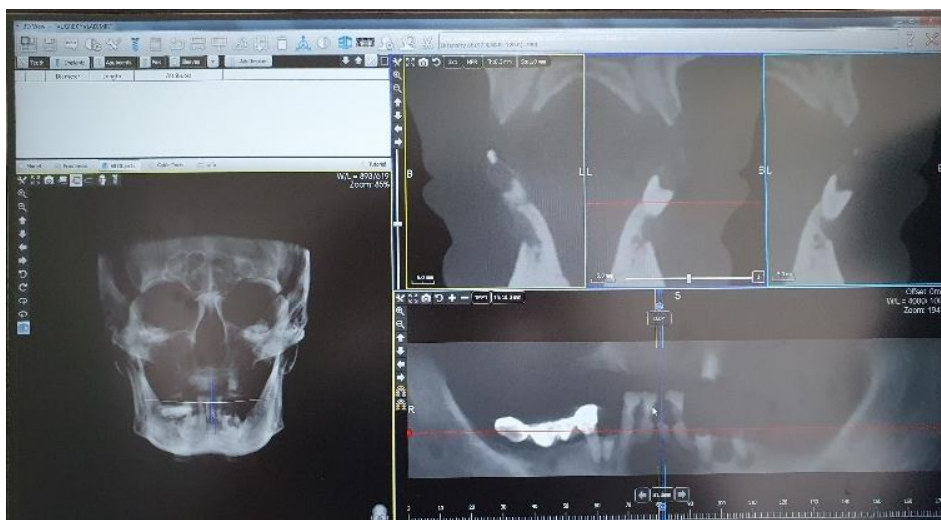
Slika 3. CBCT snimak početne situacije kod pacijenta