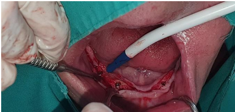
Slika 9. Situacija nakon ugradnje implantata u donjoj čeljusti