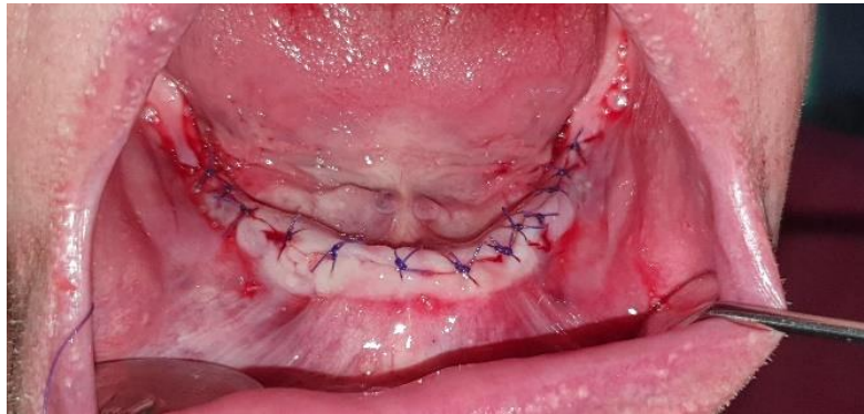
Slika 10. Primarno zatvaranje kirurškog polja u donjoj čeljusti