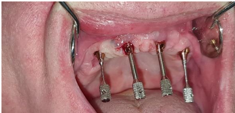
Slika 12. Smjer ugrađenih implantata u gornjoj čeljusti

Otisak se uzima pomoću individualiziranog transfera kako bi se dobio što precizniji izlaz profila gingive.