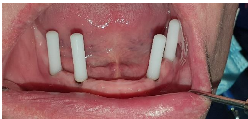
Slika 15. Smjer ugrađenih implantata u donjoj čeljusti