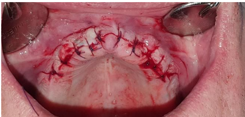
Slika 7. Primarno zatvaranje kirurškog polja u gornjoj čeljusti