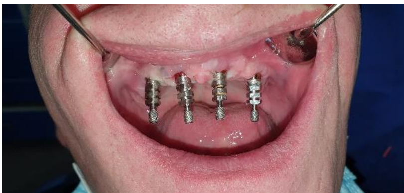
Slika 13. Transferi za otisak u gornjoj čeljusti