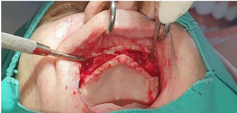
Slika 5. Otvaranje reznja u gornjoj čeljusti