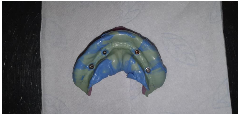
Slika 17. Kontrola otiska u donjoj čeljusti

Cilj protetskog rada jest da bude na zašarfljivanje te jednokomadni, prije same predaje počisti se četkicom i ispere alkoholom. Zatim se fiksira na implantate silom od 20 Ncm po propisu proizvođača, a otvor za vijak zatvori se teflon trakom i zapečati tekućim kompozitom.