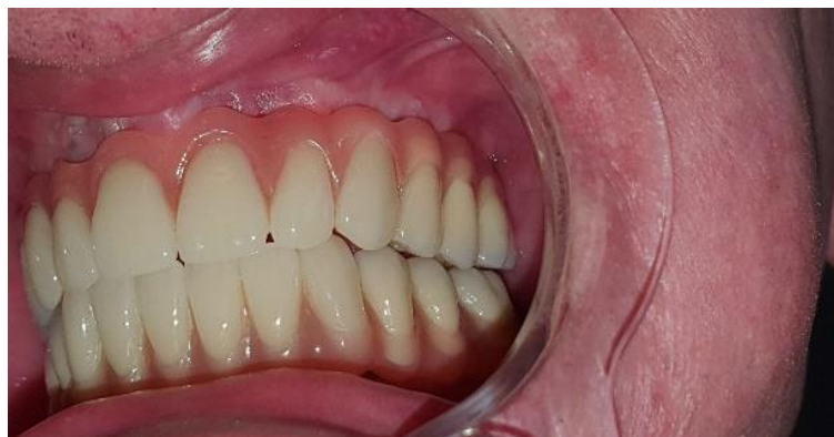
Slika 18. Završni rad lateralno lijevo

Cilj protetskog rada jest da bude na zašarfljivanje te jednokomadni, prije same predaje počisti se četkicom i ispere alkoholom. Zatim se fiksira na implantate silom od 20 Ncm po propisu proizvođača, a otvor za vijak zatvori se teflon trakom i zapečati tekućim kompozitom.