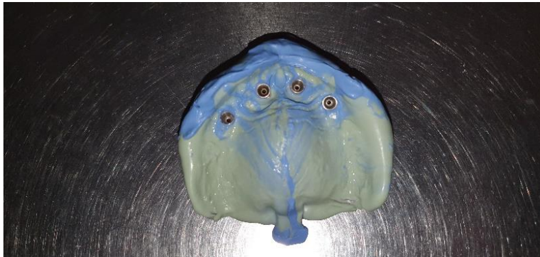
Slika 14. Kontrola otiska u gornjoj čeljusti