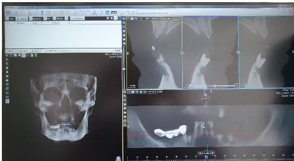
Slika 3. CBCT snimak početne situacije kod pacijenta