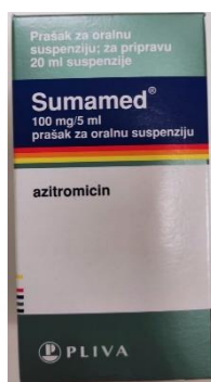
Slika 6. Sumamed prášak za oralnu suspenziju

Odrasli i djeca starija od 16 godina: 500 mg jednokratna doza prvi dan, sljedećih 2-5 dana 250mg jedanput na dan.