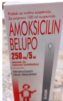
Slika 1. Amoksicilin prašak za oralnu suspenziju

Doziranje za odrasle i adolescente težine >40 kg : 250-500 mg svakih 8 sati