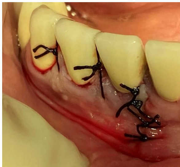
Slika 4. Klinički slučaj: Šivanje mekih tkiva nakon provedene apikotomije

Uspjeh zahvata ovisi ponajviše o dva čimbenika – uklanjanju nekrotičnog, odnosno inficiranog tkiva i učinkovitom brtvljenju korijenskog kanala (10). Stopa uspješnosti kontinuirano raste uvođenjem moderne tehnologije poput lupa, mikroskopa i ultrasoničnih nastavaka te trenutno iznosi između 74% i 92% (11), no uvjerljivo najistraživaniji čimbenik uspješnosti endo-kirurškog zahvata su materijali koji se koriste za retrogradno punjenje. Budući da sama kiretaža periapikalne lezije uklanja posljedicu, ali ne i sam uzrok apikalnog propuštanja, uspješnost zahvata ovisi o materijalu koji osigurava apikalno brtvljenje, a trebao bi biti dimenzijski stabilan, vezati se na stijenke korijenskog kanala, djelovati antibakterijski, omogućiti regeneraciju kosti te naposljetku neće biti toksičan za organizam (8).