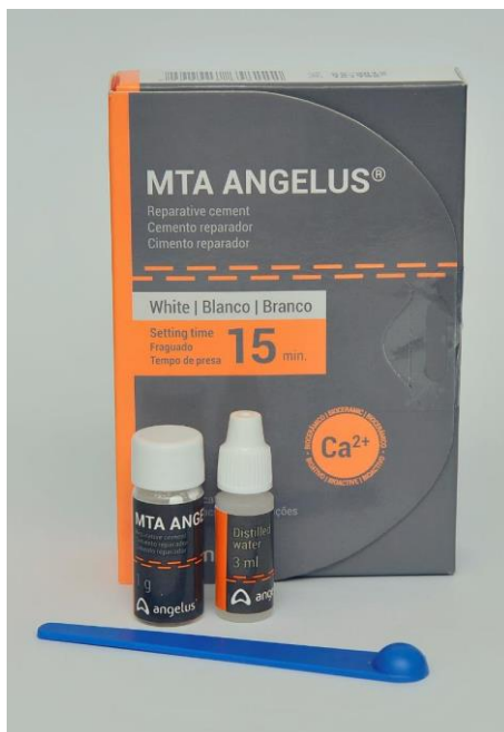
Slika 6: Sadržaj pakiranja MTA Angelusa – prašak i tekućina koji se ručno miješaju