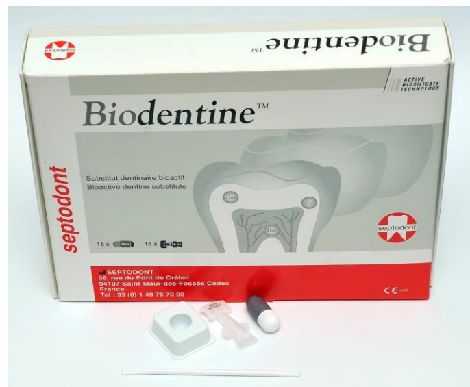
Slika 7. Sadržaj pakiranja Biodentina – inkapsulirani prašak i tekućina koja se dodaje u kapsulu prije trituracije

kolagenih fibrila te tako stvaraju kemijsku i mehaničku vezu i smanjuju rubno propuštanje (35). Također, prisutstvom kalcijevog karbonata smanjuje se ukupni udio vode u smjesi koja je nužna za stvrdnjavanje, ali ujedno i usporava sami proces (42). Utjecaj na vrijeme stvrdnjavanja ima i omjer silikata. Naime, dikalcijev silikat koji je u Biodentinu izostavljen, a nalazi se npr. u MTA-u, sporo se hidrira što produžava potrebno vrijeme stvrdnjavanja i utječe na homogenost smjese. Homogenija smjesa biodentina se bolje adaptira uz marginalne stjenke i samim time bolje brtvi. Kombinacija svih tih faktora čini biodentin superiornijim materijalom od MTA-a što se tiče sposobnosti brtvljenja (31). Dodatna prednost biodentina nad MTA-om u smislu materijala za retrogradno punjenje je ta što dolazi u inkapsuliranim dozama praška koje se tritiriraju nakon dodavanja pet kapljica tekućine (slika 7) (20).