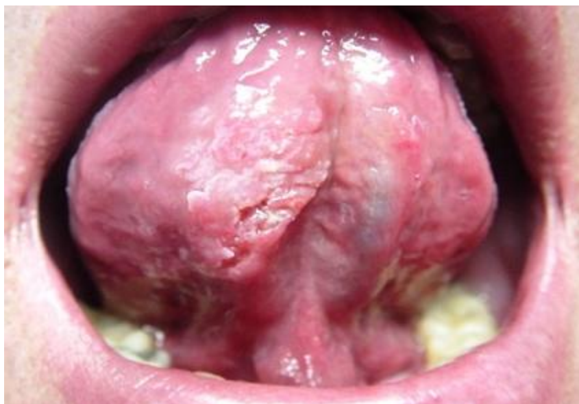
Slika 4. Karcinom usne šupljine na ventralnoj strani jezika.

Svaka crvena, bijela, crvenobijela i lezija koja ne cijeli kroz 14 dana treba pobuditi sumnju na postojanje karcinoma. Oblikom lezija može biti neulcerirana ili ulcerirana, izdignuta ili ravna te može biti indurirana ili palpabilna (25). Karcinom usne šupljine širi se limfnim putevima te može zahvatiti limfne čvorove glave i vrata, posebice gornje vratne i podčeljusne čvorove, s tim da obično zahvaća one čvorove ispilateralno. Znak za uzbunu su nepomični uvećani limfni čvorovi što može ukazivati na to da su stanice karcinoma probile čahuru čvora (25).