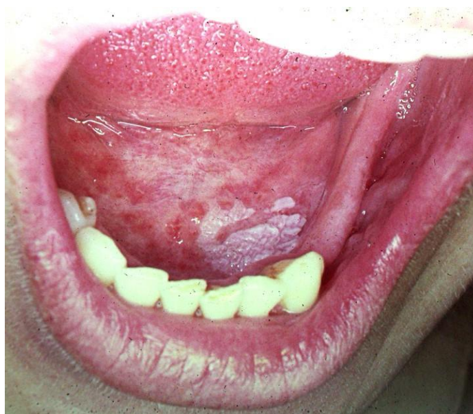
Slika 1. Leukoplakija.

Leukoplakija (Slika 1.) je definirana kao bijeli plak ili mrlja na oralnoj sluznici koja se ne može ni klinički ni histološki okarakterizirati kao neka druga lezija (29). Prevalencija u svijetu varira te iznosi od 0,2 do 24,8%, a maligno alterira u 4 – 6% slučajeva (29). Na temelju kliničke slike postoje dvije podjele. Jolan Banoczy leukoplakiju dijeli na: jednostavnu, proliferativnu verukoznu i erozivnu, a prema Svjetskoj zdravstvenoj organizaciji dijeli se na: homogenu, nehomogenu i vlasastu (29, 30). Diferencijalno dijagnostički ju treba razlikovati od drugih „bijelih lezija“, a to su: kronična hiperplastična kandidijaza, hiperkeratotični lichen planus, leukoedem, kemijske i mehaničke ozljede, ektopične žlijezde slinovnice (status Fordyce). U terapiji je posebno naglašena važnost na doživotnu kontrolu bolesnika (29). Preporučljivo je leukoplakiju bez displazije epitela kontrolirati svakih 6 mjeseci te napraviti biopsiju jedanput godišnje, dok se pacijenti s leukoplakijom s displazijom nakon njezina uklanjanja savjetuju kontrolirati svakih 3 – 6 mjeseci, a biopsija izvoditi 2 – 3 puta godišnje.