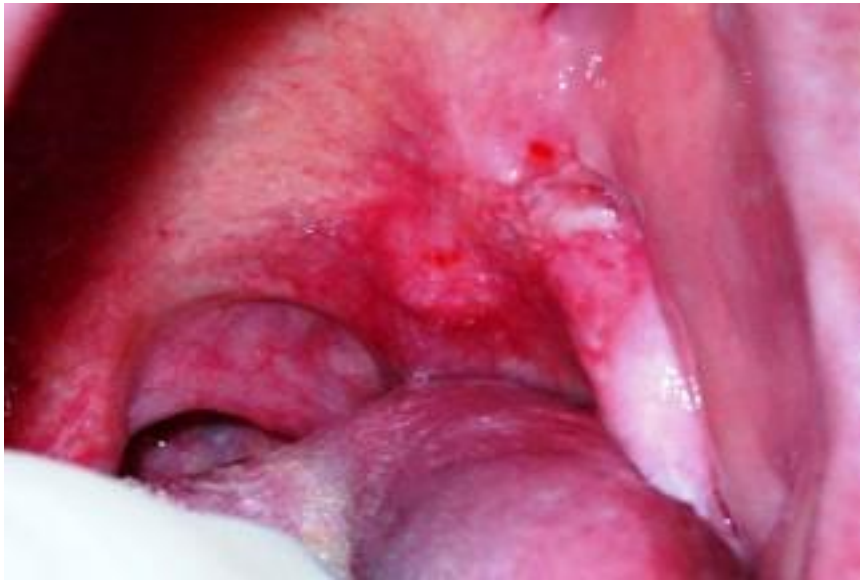
Slika 5. Karcinom usne šupljine u retromolarnom području.