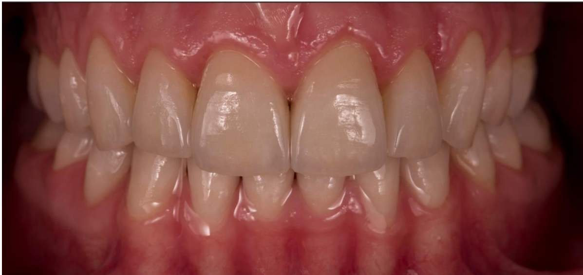
Slika 8. Cementirane potpuno keramičke krunice.