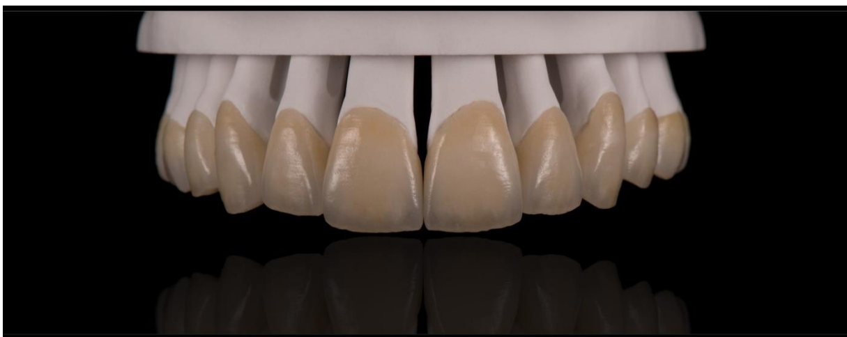
Slika 7. Potpuno keramičke krunice na modelu.

Potpuno keramičke krunice koristimo u terapiji amelogenesis imperfecte ponajprije u frontalnom segmentu jer omogućavaju postizanje vrhunske estetike gdje i pravilnim odabirom materijala poput cirkonij-oksidne keramike možemo zamaskirati prirodnu boju zuba.