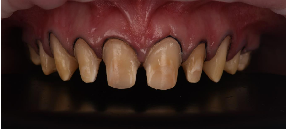
Slika 6. Preparacija za potpuno keramičke krunice.

Cementiranje silikatne keramike provodi se adhezivnom tehnikom, dok oksidnu keramiku cementiramo konvencionalnim metodama.