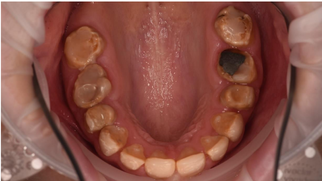
Slika 3. Atricijom destruirani zubi.

U trajnoj denticiji terapijski postupak uvelike ovisi o dobi, ekonomskome statusu pacijenta i broju zahvaćenih zuba, a najčešće uključuje ekstrakciju prekomjerno destruiranih zuba i njihov nadomjestak korištenjem mostova ili djelomičnih proteza, primjenu kompozitnih ili keramičkih ljuskica te krunica. Cilj je ukloniti preosjetljivost, rekonstruirati vertikalnu dimenziju okluzije, funkciju i zadovoljiti estetske zahtjeve pacijenta. (14, 16).