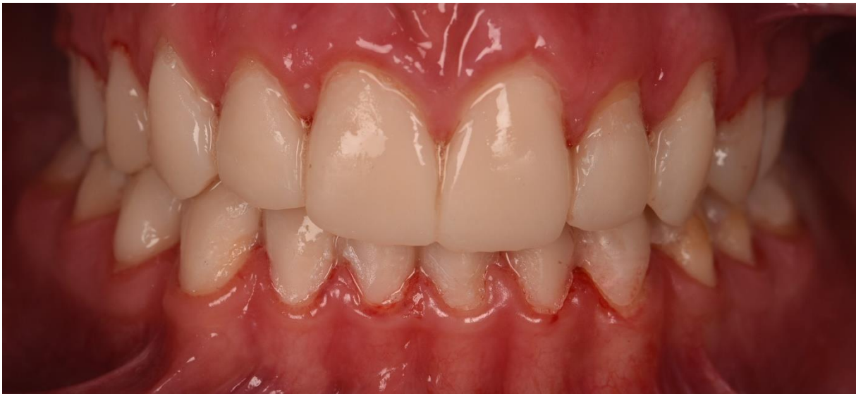
Slika 5. Mock-up .

Mock-up nam služi kao vodilja kojim možemo odrediti opseg brušenja tvrdoga zubnog tkiva uz njegovu maksimalnu poštedu. Nadomjestak dobiven izradom mock-upa možemo provjeriti funkcijski i estetski u usnoj šupljini pri čemu ćemo provjeriti dužinu zuba, položaj u odnosu na usnicu te izgovor glasova. U ovoj fazi moguće su korekcije dok oboje, terapeut i pacijent, nisu zadovoljni estetskim i funkcijskim komponentama budućeg rada (21).