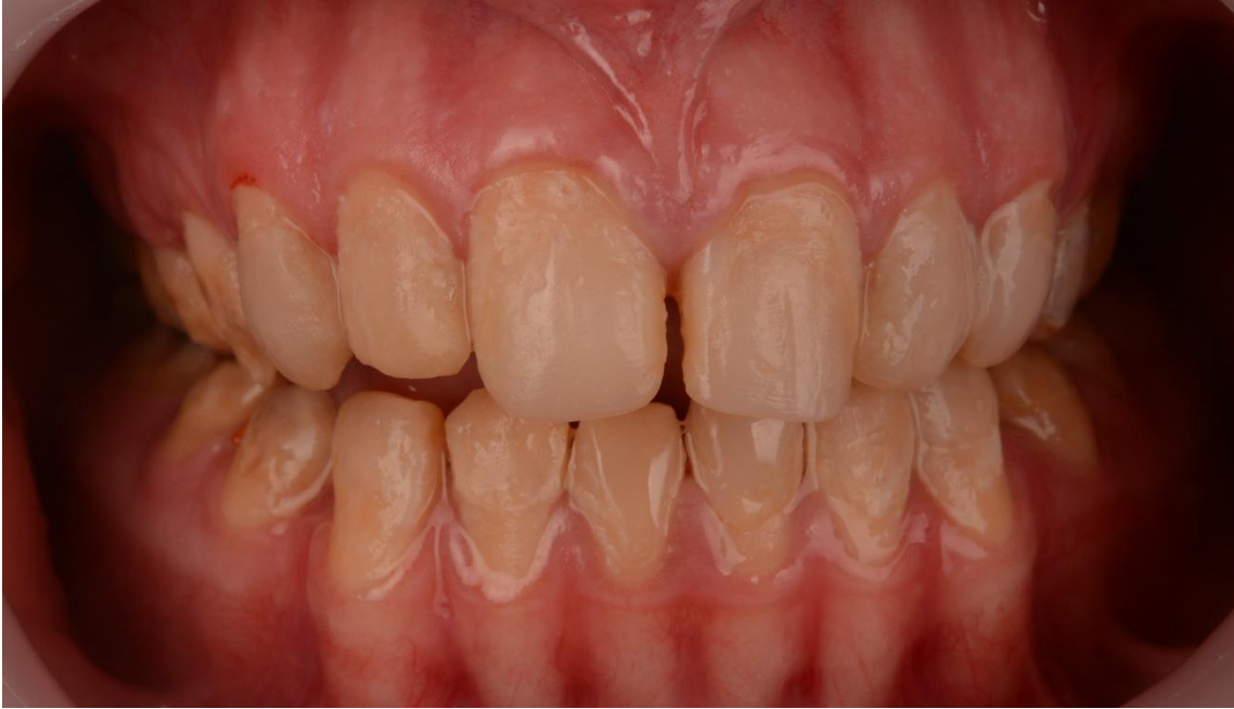
Slika 1. Amelogenesis imperfecta .

Radiološkom dijagnostikom možemo utvrditi razliku između pojedinih oblika AI. Tako kod hipomineralizacijske amelogenesis imeprfecte caklina je radiološki jednake ili manje gustoće od dentina, dok kod hipomaturacijske uočavamo jednaku gustoću cakline i dentina na rendgenogramu. Hipoplastični oblik karakterizira caklina intenzivnijeg zasjenjenja zbog njezine normalne mineralizacije, ali stanjene debljine u odnosu na njezine uobičajene vrijednosti.