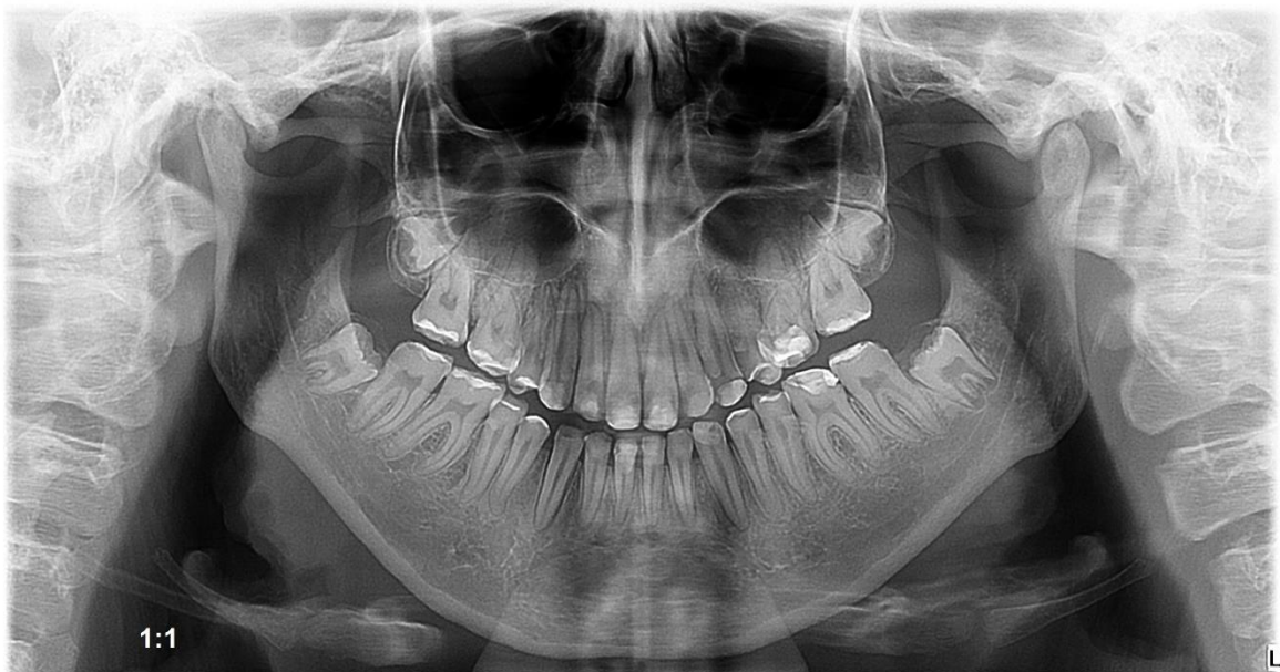
Slika 2. Radiografska snimka pacijenta s AI.

Radiološkom dijagnostikom možemo utvrditi razliku između pojedinih oblika AI. Tako kod hipomineralizacijske amelogenesis imeprfecte caklina je radiološki jednake ili manje gustoće od dentina, dok kod hipomaturacijske uočavamo jednaku gustoću cakline i dentina na rendgenogramu. Hipoplastični oblik karakterizira caklina intenzivnijeg zasjenjenja zbog njezine normalne mineralizacije, ali stanjene debljine u odnosu na njezine uobičajene vrijednosti.