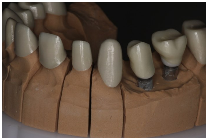
Slika 4. Radni model s izrađenom osnovom iz cirkonij-oksidge keramike za krunice na implantatima - pričvršćivanje cementom.

Danas se zbog visokih estetskih standarda u dentalnoj medicini kod pričvršćivanja suprastrukture na implantat sve češće koriste cementi. Cementiranjem fiksnih implantoprotetskih radova kod kojeg se ispunjavaju mikropukotine između nadogradnje i implantata postiže se dobro rubno brtvljenje. Problemi koji se mogu javiti u slučaju pričvršćivanja cementom su biološke komplikacije te periimplantitisi i perikoronitisi uzrokovani zaostatnim slojem cementa koji nije odgovarajući uklonjen, kao i nemogućnost skidanja rada kod komplikacija kao što su lom metalne osnove nadogradnje, vijka ili keramičke ljuske (30).