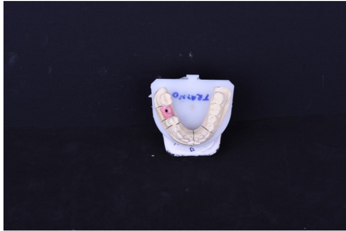
Slika 6. Radni model za izradu krunice na implantatima.