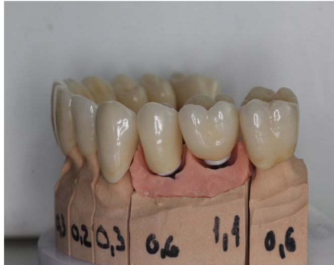
Slika 3. Radni model sa slojevanom keramikom za krunice na implantatima - pričvršćivanje cementom.

zoni gdje su cementirane ili vijkom pričvršćene na individualiziranoj nadogradnji implantata iz cirkonij-oksidge keramike, dok se u stražnjem području koriste metal-keramičke krunice i mostovi na prefabriciranim nadogradnjama (cementirani ili vijkom pričvršćeni) (3, 27, 28).