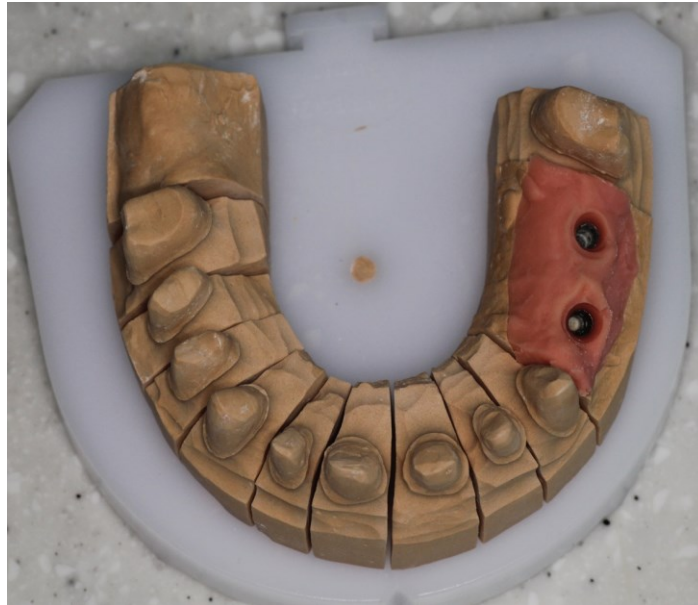
Slika 2. Radni model za izradu dviju krunica na implantatima. Preuzeto s dopuštenjem autora: Nikša Dulčić, prof.dr.sc.