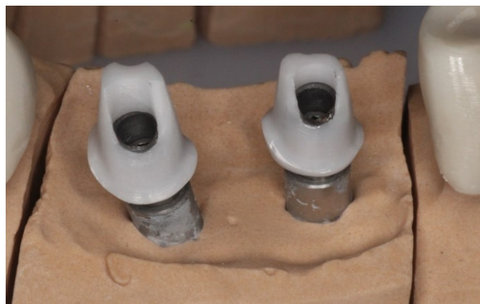
Slika 8. Radni model s nadogradnjom iz cirkonij-oksidne keramike.

Mehanička indikacija upućuje da su glavni uzroci rizika stabilnost veze između metalnog implantata i nadogradnje iz cirkonij-oksidne keramike. Kod nadogradnje iz cirkonij-oksidne keramike doktor dentalne medicine bi trebao koristiti implantate manjeg promjera i to iz istog sustava koji se kasnije može koristiti za nadogradnju. Implantat bi trebao biti ugrađen u idealnom položaju i smjeru, u suprotnom bi kasnije na ionako već užoj nadogradnji s relativno tankim stijenkama bilo potrebno dodatno brušenje radi kompenzacije smjera. Ograničavajući čimbenik je najčešće promjer glave pričvrstnog vijka nadogradnje, što traži izradu najmanjeg mogućeg promjera pristupnog otvora za vijak. Pacijenti kod kojih se nadomještaju vrlo uski zubi uglavnom su ljudi nježne tjelesne konstitucije, pa doktor dentalne medicine i dentalni tehničar moraju usuglasiti optimalnu debljinu materijala. Oni često imaju vrlo tanko meko tkivo, pa primjena cirkonij-oksidne keramike u nadogradnji donosi veliku prednost (45).