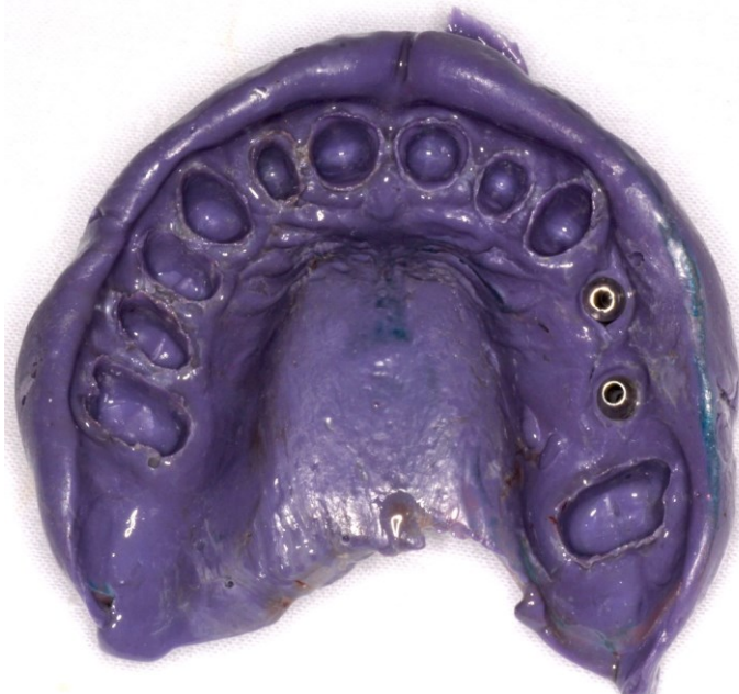
Slika 1. Otisak za izradu dviju krunica na implantatima. Preuzeto s dopuštenjem autora: Nikša Dulčić, prof.dr.sc.

Postoje dvije osnovne vrste nadogradnji, konfekcijske ili tvornički prefabricirane i individualne nadogradnje. Konfekcijske ili tvornički prefabricirane nadogradnje strojno su obrađene nadogradnje koje se izravno vijčano spajaju na predviđeno mjesto na implantatu. Materijal od kojeg mogu biti izrađene su titanij ili cirkonij-oksida keramika. Neke od tvorničkih nadogradnji moraju se dodatno obraditi u laboratoriju. Tvorničke nadogradnje trebale bi se u potpunosti prilagoditi, dok su polukonfekcijske već djelomično prilagođene u koronarnom dijelu. Takva vrsta nadogradnji se najviše koristi u području kutnjaka. Prednost konfekcijskih odnosno tvornički prefabriciranih nadogradnji je u manjem broju posjeta pacijenata ordinaciji, čime se ubrzava terapija, kao i relativno niska cijena nadogradnji. Nedostaci konfekcijskih odnosno tvornički prefabriciranih nadogradnji su zahtjevnost u postizanju estetike i izlaznog profila. Potrebna je također i preciznost položaja implantata u kosti, time se smanjuje naknadno brušenje nadogradnje i sprječava smanjenje retencije i rezistencije protetskog nadomjeska na implantatu (24).