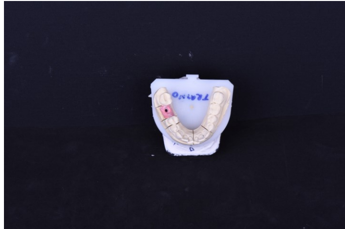
Slika 6. Radni model za izradu krunice na implantatima.